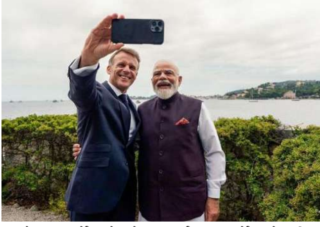
પુનરોચ્ચાર કર્યો હતો, જેમાં તેમણે મધ્યમ-સ્તરની શક્તિઓને સંયુક્ત રીતે વધતા ભૂ-રાજકીય પડકારોનો સામનો કરવા હાકલ કરી હતી.

કેનેડિયન વડા પ્રધાન માર્ક કાર્નેએ વિશ્વના સૌથી શક્તિશાળી રાષ્ટ્રોના જૂથ, જી ૭ ના પ્લેટફોર્મ પર ભારતની તાકાતને સ્વીકારી છે. તેમણે કહ્યું કે ફ્રાન્સમાં ૨૭ સમિટમાં ભારતની ભાગીદારી બદલાતી વૈશ્વિક વ્યવસ્થાને પ્રતિબિંબિત કરે છે. તેમણે કહ્યું કે આ જૂથ હવે ફક્ત આંતરરાષ્ટ્રીય બાબતો પર પ્રભુત્વ મેળવવાનો દાવો કરી શકે નહીં. યુરોપના છ દિવસના પ્રવાસ દરમિયાન ટ્રિનિટી કોલેજ ડબલિનમાં બોલતા, માર્ક કાર્નેએ જણાવ્યું હતું કે ભારત જેવા દેશોનો સમાવેશ દર્શાવે છે કે ૨૭ એ વાતને સ્વીકારે છે કે મુખ્ય વૈશ્વિક પડકારોનો સામનો કરવા માટે તેના પરંપરાગત સભ્યપદથી આગળ વ્યાપક આંતરરાષ્ટ્રીય સહયોગ અને દ્રષ્ટિકોણની જરૂર છે. જી ૭ સમિટ પહેલા, કેનેડિયન નેતાએ કહ્યું, "આ એક માન્યતા છે કે ભલે જી ૭ એક સમયે વિશ્વ ચલાવતું હતું, તે હવે તેને ચલાવતું નથી, અને ન તો તે તેનો ઢોંગ કરે છે." આ વર્ષે જી ૭ સમિટ ફ્રાન્સમાં યોજાઈ રહી છે, જ્યાં ભારતને મહેમાન દેશ તરીકે આમંત્રણ આપવામાં આવ્યું છે. ભારત આઠમાં ઓછા ૨૦ વર્ષથી જી ૭ માં મહેમાન દેશ તરીકે ભાગ લઈ રહ્યું છે.