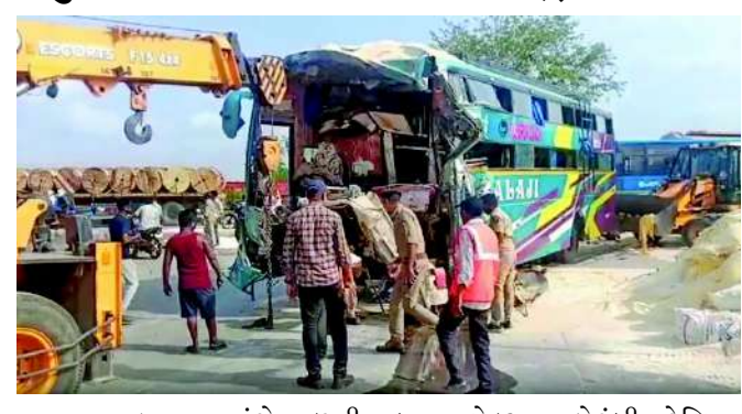
આ અકસ્માત અંગે મળતી વિગત પ્રમાણે રાજસ્થાનના બાસવાડાથી બસ સુરત જતી હતી.

વડોદરા શહેરના રોડ રસ્તા રક્તરંજિત થવાનો સિલસિલો યથાવત રહ્યો હતો. લકઝરી બસ અને ટ્રક વચ્ચે ટક્કરમાં ૦૬ લોકોના મોત થયા હતા, જ્યારે ૨૫થી વધુ મુસાફરો ઈજાગ્રસ્ત થયા છે. મૃતકમાં એક ૦૮ વર્ષનું બાળક પણ છે. બસના ચાલકે આગળ જઈ રહેલી ટ્રકને પાછળથી જોરદાર ટક્કર મારતાં આ ગમખવાર અકસ્માત સર્જ્યો હોવાનું જાણવા મળ્યું છે.