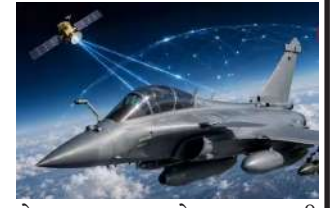
ફ્રાન્સે ભારતને પહોંચાડવામાં આવનાર રાફેલમાં અદ્યતન ઉપગ્રહ સંચાર લિંક્સ અને કૃત્રિમ બુદ્ધિમત્તાનો સમાવેશ કરવા સંમત નહીં, પરંતુ "એક સિસ્ટમની અંદર હવાઈ લડાઈ પ્રણાલી" માને છે.

ફ્રાન્સ હવે ભારતને પહોંચાડવામાં આવનાર રાફેલમાં અદ્યતન ઉપગ્રહ સંચાર લિંક્સ અને કૃત્રિમ બુદ્ધિમત્તાનો સમાવેશ કરવા સંમત નહીં, પરંતુ "એક સિસ્ટમની અંદર હવાઈ લડાઈ પ્રણાલી" માને છે. વડા પ્રધાન નરેન્દ્ર મોદી હાલમાં ફ્રાન્સની મુલાકાતે છે, જ્યાં તેઓ જી-૭ સમિટમાં ભાગ લેવા માટે ઈવિયન પહોંચ્યા છે. અહેવાલો અનુસાર, સુપરપાવર બનાવવા માટે રાફેલના પ્રસ્તાવિત ટેકનોલોજી અપગ્રેડોનો અમલ ભારતીય વાયુસેનાના મલ્ટી-રોલ ફાઇટર એરક્રાફ્ટ કાર્યક્રમ હેઠળ કરવામાં આવી રહ્યો છે. આમાં ફ્રાન્સ પાસેથી ૧૧૪ રાફેલની ખરીદીનો સમાવેશ થાય છે. આ બધા રાફેલ આગામી પેઢીની ટેકનોલોજીથી સજ્જ હશે, જે ભવિષ્યમાં ભારતીય રાફેલ કાફલાને હાલના એફ૩૦ અને એફ૩૫ થી એફ ૫ ટેકનોલોજીમાં અપગ્રેડ કરવામાં સક્ષમ બનાવશે. આ બધા રાફેલ અદ્યતન નેટવર્ક-કેન્દ્રિત યુદ્ધ ક્ષમતાઓ અને એઆઈ-આધારિત નિર્ણય લેવાની ક્ષમતાથી સજ્જ હશે. જો રાફેલ એસએટીસીઓએમથી સજ્જ હશે, તો તે વિનાશ વેરશે.