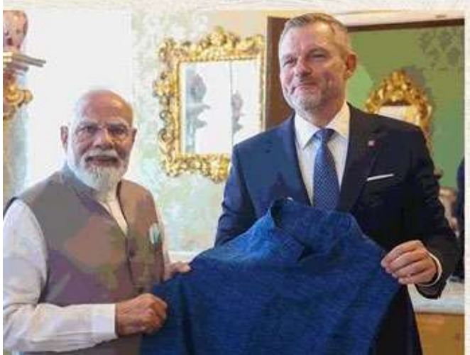
બંને દેશોએ આતંકવાદ સામેની લડાઈ, શિક્ષણ અને રોજગાર સહિત અનેક મુખ્ય ક્ષેત્રોમાં કરારો પર હસ્તાક્ષર કર્યાં વારાણસી (બનારસ) પર કેન્દ્રિત હતું. તેમાં તાજેતરમાં વારાણસીની મુલાકાત લીધેલા સ્વોવાકિયન કલાકારોની કૃતિઓ દર્શાવવામાં આવી હતી. તેમની કલા દ્વારા, કલાકારોએ બનારસની સુંદરતા

નવીદિલ્હી, પ્રધાનમંત્રી નરેન્દ્ર મોદીએ સ્વોવાકિયાની તેમની ઐતિહાસિક હે દિવસી મુલાકાત પૂર્ણ કરી છે. ૧૯૮૩માં સ્વોવાકિયાની સ્વતંત્રતા પછી ભારતીય વડા પ્રધાનની આ પહેલી મુલાકાત હતી. આ મુલાકાત દરમિયાન, બંને દેશોએ આતંકવાદ સામેની લડાઈ, શિક્ષણ અને રોજગાર સહિત અનેક મુખ્ય ક્ષેત્રોમાં મોટા કરારો પર હસ્તાક્ષર કર્યાં. બંને દેશોએ હવે તેમના સંબંધોને "વ્યાપક ભાગીદારી" સુધી પહોંચાડ્યા છે. તેમની મુલાકાત દરમિયાન, પ્રધાનમંત્રી મોદીએ, સ્વોવાકિયાના રાષ્ટ્રપતિ પીટર પેલેગ્રિની સાથે, શ્રાવિસ્લાવામાં રાષ્ટ્રપતિ મહેલમાં એક ખાસ પ્રદર્શનની મુલાકાત લીધી. આ પ્રદર્શન ભારતના પ્રાચીન અને પવિત્ર શહેર અને સંસ્કૃતિને કેનવાસ પર કેદ કરી હતી. પીએમ મોદીએ સોશિયલ મીડિયા પર આ અનુભવ શેર કર્યો, તેને "શ્રાવિસ્લાવામાં બનારસ સાથે જોડાણ" ગણાવ્યું. પીએમએ સોશિયલ મીડિયા પ્લેટફોર્મ પર લખ્યું, "શ્રાવિસ્લાવામાં બનારસ સાથે જોડાણ! ગઈકાલે શ્રાવિસ્લાવામાં રાષ્ટ્રપતિ મહેલમાં, રાષ્ટ્રપતિ પેલેગ્રિની અને મેં વારાણસી પર કેન્દ્રિત એક રસપ્રદ પ્રદર્શનની મુલાકાત લીધી, જેમાં તાજેતરમાં વારાણસીની મુલાકાત લેનારા સ્વોવાકીય કલાકારોની કૃતિઓ દર્શાવવામાં આવી હતી. કલા અને સંસ્કૃતિમાં લોકોને એકસાથે લાવવાની અદ્ભુત ક્ષમતા છે. આ પ્રદર્શનમાં પ્રદર્શિત થયેલા તમામ કલાકારોને મારા હૃદયપૂર્વક અભિનંદન.