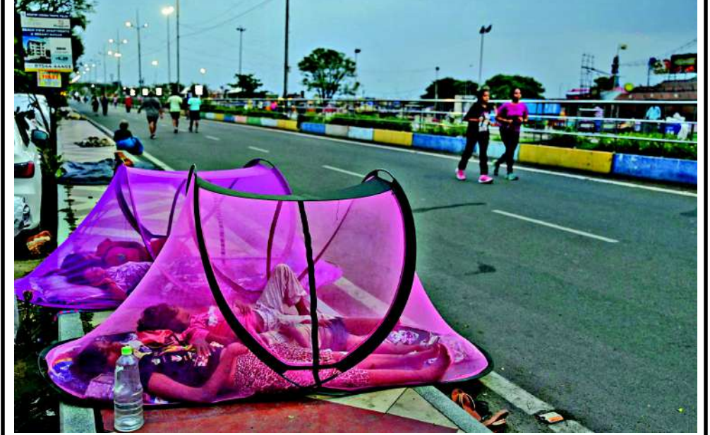
સ્વાસ્થ્ય એક સંપત્તિ સમાન છે, આરોગ્યની જાળવણી માટે શરીરને કાર્યરત રાખવું જરૂરી છે. સુખી સંપત્તિ લોકો આરોગ્યની જાળવણી માટે વહેલી સવારે ઘોડાવા માટે નીકળે છે, બીજા તરફ બેઘર બાળકો દિવસભરની રજળપાટ કર્યા પછી વહેલી સવારે કુદરતના ખોળે મીઠી નીંદર માણી રહ્યા છે.

પ્રધાન નરેન્દ્ર મોદીએ ભારત-યુકે વ્યૂહાત્મક ભાગીદારીને વધુ મજબૂત કરવા પર સહમતિ વ્યક્ત કરી હતી. જી-૭ સમિતિના 'સાઈડલાઈન્સ' પર પીએમ મોદી અને કેનેડાના નવા વડા પ્રધાન માર્ક કાર્ની વચ્ચે પણ અત્યંત મહત્વપૂર્ણ મુલાકાત થઈ હતી. જેમાં બંને દેશોએ અત્યંત પારદર્શી અને ખુલ્લા મનથી દ્વિપક્ષીય સંબંધો તેમજ આંતરરાષ્ટ્રીય ઘટનાક્રમો પર પોતાના વિચારો શેર કર્યા હતા. પીએમ મોદીએ વિશેષ રૂપે કેનેડામાં વસતા ઓવરસીઝ ઈન્ડિયન્સની સંભાળ અને મદદ માટે કેનેડા સરકારનો આભાર માન્યો હતો. વેપારિક સંબંધો પર વાત કરતા તેમણે સ્પષ્ટ કર્યું કે ભારત, કેનેડા સાથે મુક્ત વ્યાપાર કરાર ને લઈને ખુબ જ ઉત્સુક છે અને તેને આ વર્ષે જ પૂર્ણ કરવાનો લક્ષ્ય છે. કેનેડાના પીએમ માર્ક કાર્નીએ પીએમ મોદીને કેનેડા આવવાનું આમંત્રણ આપ્યું હતું, જેનો પીએમ મોદીએ સહર્ષ સ્વીકાર કર્યો હોવાનું પણ જણવા મળ્યું છે. આગામી સમયમાં પીએમ મોદી કેનેડાના પ્રવાસે જઈ શકે છે.