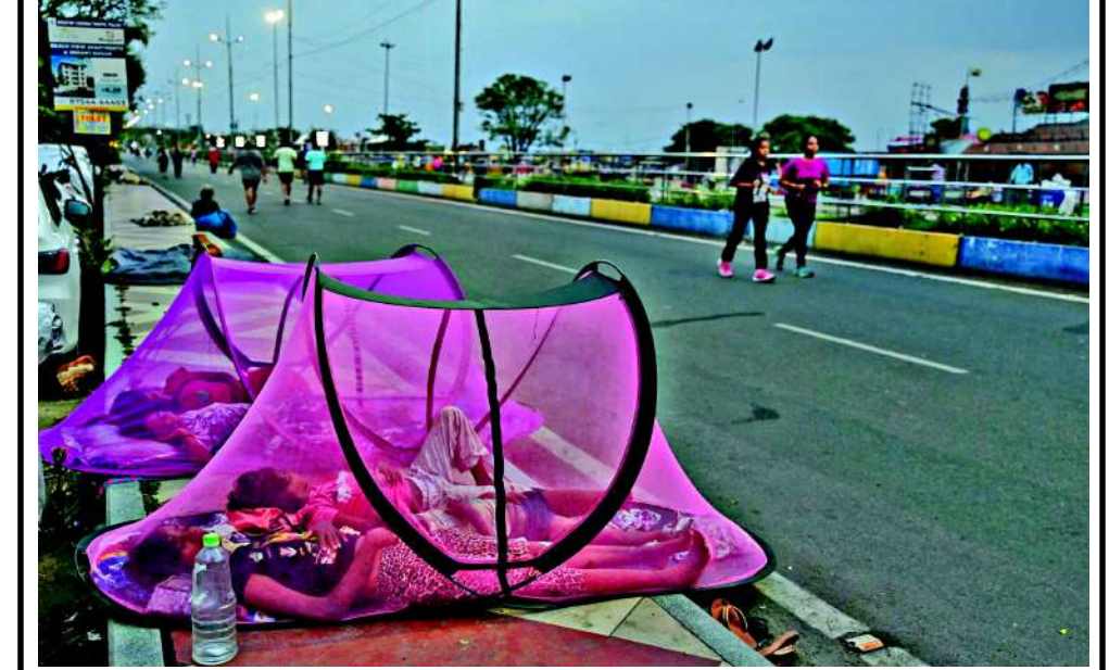
સ્વાસ્થ્ય એક સંપત્તિ સમાન છે, આરોગ્યની જાળવણી માટે શરીરને કાર્યરત રાખવું જરૂરી છે. સુખી સંપત્તિ લોકો આરોગ્યની જાળવણી માટે વહેલી સવારે ઘોડાવા માટે નીકળે છે, બીજા તરફ બેઠર બાળકો દિવસભરની રજાપાટ કર્યા પછી વહેલી સવારે કુદરતના ખોળે મીઠી નીદર માણી રહ્યા છે.

પ્રધાન નરેન્દ્ર મોદીએ ભારત-યુકે વ્યૂહાત્મક ભાગીદારીને વધુ મજબૂત કરવા પર સહમતિ વ્યક્ત કરી હતી. જી-૭ સમિતિના 'સાઈડલાઈન્સ' પર પીએમ મોદી અને કેનેડાના નવા વડા પ્રધાન માર્ક કાર્ની વચ્ચે પણ અત્યંત મહત્વપૂર્ણ મુલાકાત થઈ હતી. જેમાં બંને દેશોએ અત્યંત પારદર્શી અને ખુલ્લા મનથી દ્વિપક્ષીય સંબંધો તેમજ આંતરરાષ્ટ્રીય ઘટનાક્રમો પર પોતાના વિચારો શેર કર્યા હતા. પીએમ મોદીએ વિશેષ રૂપે કેનેડામાં વસતા ઓવરસીઝ ઈન્ડિયન્સની સંભાળ અને મદદ માટે કેનેડા સરકારનો આભાર માન્યો હતો. વેપારિક સંબંધો પર વાત કરતા તેમણે સ્પષ્ટ કર્યું કે ભારત, કેનેડા સાથે મુક્ત વ્યાપાર કરાર ને લઈને ખુબ જ ઉત્સુક છે અને તેને આ વર્ષે જ પૂર્ણ કરવાનો લક્ષ્ય છે. કેનેડાના પીએમ માર્ક કાર્નીએ પીએમ મોદીને કેનેડા આવવાનું આમંત્રણ આપ્યું હતું, જેનો પીએમ મોદીએ સહર્ષ સ્વીકાર કર્યો હોવાનું પણ જણવા મળ્યું છે. આગામી સમયમાં પીએમ મોદી કેનેડાના પ્રવાસે જઈ શકે છે.