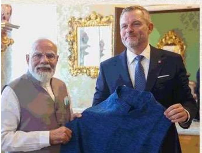
બંને દેશોએ આતંકવાદ સામેની લડાઈ, શિક્ષણ અને રોજગાર સહિત અનેક મુખ્ય ક્ષેત્રોમાં કરારો પર હસ્તાક્ષર કર્યાં વારાણસી (બનારસ) પર કેન્દ્રિત હતું. તેમાં તાજેતરમાં વારાણસીની મુલાકાત લીધેલા સ્વૌવાકિયન કલાકારોની કૃતિઓ દર્શાવવામાં આવી હતી. તેમની કલા દ્વારા, કલાકારોએ બનારસની સુંદરતા

નવીદિલ્હી, પ્રધાનમંત્રી નરેન્દ્ર મોદીએ સ્વૌવાકિયાની તેમની ઐતિહાસિક હે દિવસી મુલાકાત પૂર્ણ કરી છે. ૧૯૮૩માં સ્વૌવાકિયાની સ્વતંત્રતા પછી ભારતીય વડા પ્રધાનની આ પહેલી મુલાકાત હતી. આ મુલાકાત દરમિયાન, બંને દેશોએ આતંકવાદ સામેની લડાઈ, શિક્ષણ અને રોજગાર સહિત અનેક મુખ્ય ક્ષેત્રોમાં મોટા કરારો પર હસ્તાક્ષર કર્યાં. બંને દેશોએ હવે તેમના સંબંધોને "વ્યાપક ભાગીદારી" સુધી પહોંચાડ્યા છે. તેમની મુલાકાત દરમિયાન, પ્રધાનમંત્રી મોદીએ, સ્વૌવાકિયાના રાષ્ટ્રપતિ પીટર પેલેગ્રિની સાથે, શ્રાતિસ્લાવામાં રાષ્ટ્રપતિ મહેલમાં એક ખાસ પ્રદર્શનની મુલાકાત લીધી. આ પ્રદર્શન ભારતના પ્રાચીન અને પવિત્ર શહેર અને સંસ્કૃતિને કેનવાસ પર કેદ કરી હતી. પીએમ મોદીએ સોશિયલ મીડિયા પર આ અનુભવ શેર કર્યો, તેને "શ્રાતિસ્લાવામાં બનારસ સાથે જોડાણ" ગણાવ્યું. પીએમએ સોશિયલ મીડિયા પ્લેટફોર્મ પર લખ્યું, "શ્રાતિસ્લાવામાં બનારસ સાથે જોડાણ! ગઈકાલે શ્રાતિસ્લાવામાં રાષ્ટ્રપતિ મહેલમાં, રાષ્ટ્રપતિ પેલેગ્રિની અને મેં વારાણસી પર કેન્દ્રિત એક રસપ્રદ પ્રદર્શનની મુલાકાત લીધી, જેમાં તાજેતરમાં વારાણસીની મુલાકાત લેનારા સ્વૌવાકીય કલાકારોની કૃતિઓ દર્શાવવામાં આવી હતી. કલા અને સંસ્કૃતિમાં લોકોને એકસાથે લાવવાની અદ્ભુત ક્ષમતા છે. આ પ્રદર્શનમાં પ્રદર્શિત થયેલા તમામ કલાકારોને મારા હૃદયપૂર્વક અભિનંદન.