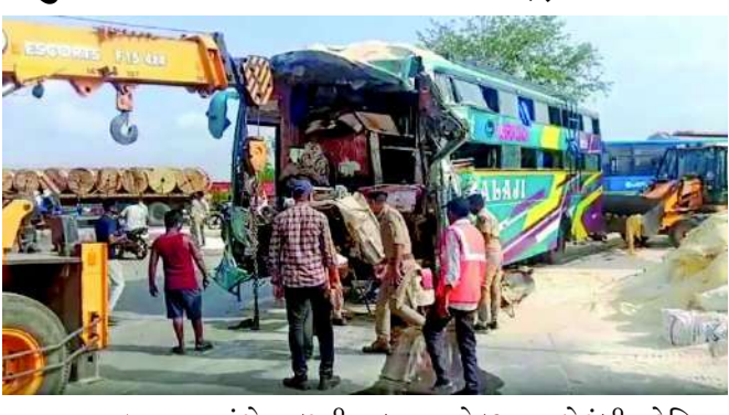
આ અકસ્માત અંગે મળતી વિગત પ્રમાણે રાજસ્થાનના બાસવાડાથી બસ સુરત જતી હતી.

વડોદરા શહેરના રોડ રસ્તા રક્તરંજિત થવાનો સિલસિલો યથાવત રહ્યો હતો. લકઝરી બસ અને ટ્રક વચ્ચે ટક્કરમાં ૦૬ લોકોના મોત થયા હતા, જ્યારે ૨૫થી વધુ મુસાફરો ઈજાગ્રસ્ત થયા છે. મૃતકમાં એક ૦૮ વર્ષનું બાળક પણ છે. બસના ચાલકે આગળ જઈ રહેલી ટ્રકને પાછળથી જોરદાર ટક્કર મારતાં આ ગમખવાર અકસ્માત સર્જ્યો હોવાનું જાણવા મળ્યું છે.