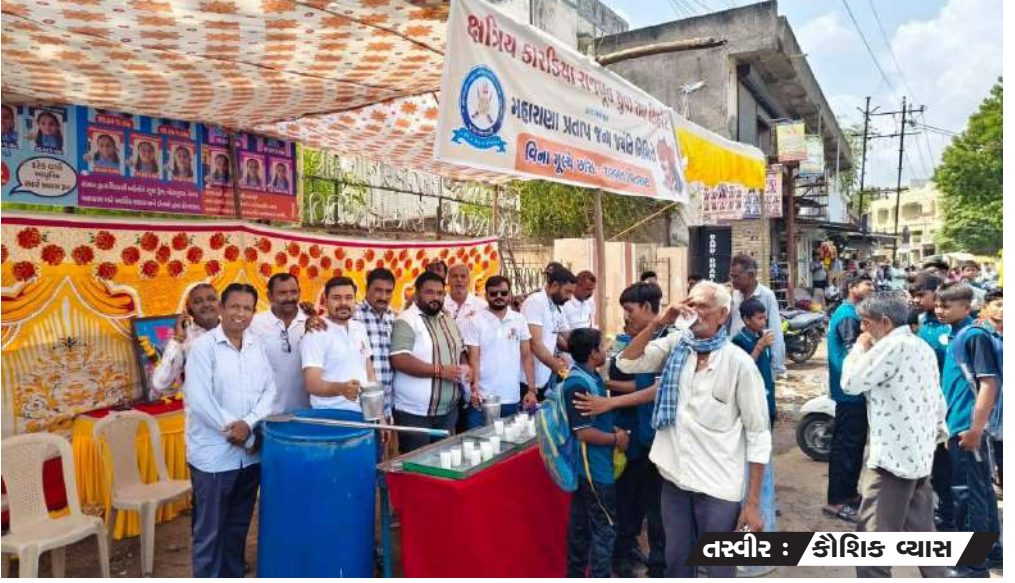
સિહોર તાલુકા કારકીયા રાજપૂત યુવા સંઘ દ્વારા દર વર્ષની માફક આ વર્ષે પણ મહારાણા પ્રતાપજી જન્મ જયંતિ સિહોર વડલા ચોક ખાતે છાશ શરબત વિતરણ કરી ઉજવવામાં આવી હતી તેમજ સમાજના સ્થાનિક સ્વરાજ્યની ચૂંટણીમાં વિજેતા થયેલું સન્માન તથા વક્તવ્ય સ્પર્ધાનું આયોજન બંધન પાર્ટી પ્લોટ ખાતે કરવામાં આવ્યું હતું જેમાં યુવા સંઘના હોદેદારો ઉપસ્થિત રહ્યા હતા.