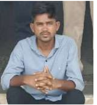
ભાવનગર, તા. ૧૮ અલંગ પોલીસ સ્ટેશનની ટીમે એક સગીરવયની પૂર્વ વિદ્યાર્થીનીનું અપહરણ કરી

દુષ્કર્મી શિક્ષકને અલંગ પોલીસે ગણતરીની કલાકોમાં ઝડપી લીધો