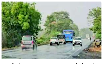
હળવોથી મધ્યમ વરસાદ ચાલુ રહ્યો છે. બીજા તરફ, ખેડા જિલ્લાના ગળતેશ્વરમાં ૫૭ મીમી અને કપડવંજમાં ૫૫ મીમી વરસાદ ખાબક્યો છે. નરિયાદ, મહુધા અને કઠલાલમાં પણ વરસાદી માહોલ જામ્યો છે.

અમદાવાદ ગુજરાતમાં છેલ્લા ૨૪ કલાકમાં મધ્ય અને ઉત્તર ગુજરાતના વિવિધ ભાગોમાં સાર્વત્રિક વરસાદ નોંધાયો છે. મહીસાગર જિલ્લાના બાલાસિનોરમાં સૌથી વધુ પોણા ૬ ઈંચ જેટલો ભારે વરસાદ ખાબકતાં જળબંબાકારની સ્થિતિ સર્જાઈ છે. આ ઉપરાંત અરવલ્લી, ખેડા, પંચમહાલ અને વડોદરા જિલ્લાના અનેક તાલુકાઓમાં પણ મેઘરાજાએ ધમાકેદાર બેટિંગ કરી છે, જેના કારણે ગરમીથી રાહત મળવાની સાથે ખેડૂતોમાં આનંદની લાગણી ઘવાઈ ગઈ છે. સરકારી આંકડા મુજબ, છેલ્લા ૨૪ કલાકમાં મહીસાગરના બાલાસિનોરમાં સૌથી વધુ ૧૪૦ મીમી (૫.૭૯ ઈંચ) વરસાદ નોંધાયો છે. નીચાણવાળા વિસ્તારોમાં પાણી ભરાઈ જવાને કારણે વાહનચાલકો અને સ્થાનિક લોકોને ભારે મુશ્કેલીનો સામનો કરવો પડ્યો હતો. અરવલ્લી જિલ્લાના ભિલોડામાં ૭૫ મીમી (૨.૯૫ ઈંચ) અને ધનસુરામાં ૬૬ મીમી (૨.૬૦ ઈંચ) વરસાદ પડ્યો છે, જ્યારે સાદંબા, બાયડ અને મોડાસામાં પણ