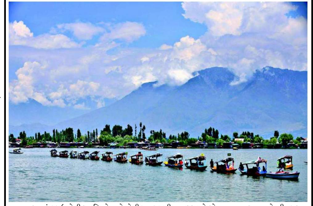
ભારતમાં ટકાઉ ખેતી પદ્ધતિઓ અને ખેતીલાયક જમીનના રક્ષણને પ્રોત્સાહન આપવા માટે શ્રીનગરના દાલ તળાવ પર એક બોટ રેલીનું આયોજન કરવામાં આવ્યું હતું.

નવી દિલ્હી અમેરિકા અને ઈરાન વચ્ચે ચાલી રહેલા યુદ્ધનો અંત લાવવા માટે પ્રમુખ ડોનાલ્ડ ટ્રમ્પ અને ઈરાની રાષ્ટ્રપ્રમુખ મસૂદ પેઝેશ્કિયાને દ્વારા હસ્તાક્ષર કરાયેલા શરતોના ડ્રાફ્ટને સત્તાવાર રીતે જાહેર કરવામાં આવ્યો છે. આ કરારમાં હોર્મુઝની ખાડીને ફરીથી ખોલવા અને ઈરાન પરના આર્થિક પ્રતિબંધો હળવા કરવા જેવી બાબતો સામેલ છે. જોકે, આ ૧૪ પોઈન્ટના કરારમાંથી પાંચમો પોઈન્ટ સૌથી વધુ ધ્યાન ખેંચી રહ્યો છે, કારણ કે તેમાં હાલમાં તો જહાજો પર કોઈ ટોલ ટેક્સ ન લગાવવાનો ઉલ્લેખ છે, પરંતુ ભવિષ્યમાં ટોલ વસૂલવાની સંભાવનાઓને પણ નકારી શકાતી નથી. કરારના સત્તાવાર દસ્તાવેજના પત્રા મુદ્દામાં જણાવ્યા અનુસાર, 'આ કરાર પર હસ્તાક્ષર થયા બાદ ઈરાન એ સુનિશ્ચિત કરવાના તમામ પ્રયાસો કરશે કે કોમર્શિયલ (વાણિજ્યિક) જહાજો કોઈપણ પ્રકારના ટોલ ટેક્સ વગર માત્ર ૬૦ દિવસ માટે પર્શિયન ખાડીથી ઓમાન સાગર અને ઓમાન સાગરથી પર્શિયન ખાડી સુધી સુરક્ષિત રીતે અવરજવર કરી શકે.' આ મુદ્દામાં વધુમાં સ્પષ્ટતા કરાઈ છે કે, દસ્તાવેજના પત્રા મુદ્દામાં જણાવ્યા અનુસાર, 'આ કરાર પર હસ્તાક્ષર થયા બાદ ઈરાન એ સુનિશ્ચિત કરવાના તમામ પ્રયાસો કરશે કે કોમર્શિયલ (વાણિજ્યિક) જહાજો કોઈપણ પ્રકારના ટોલ ટેક્સ વગર માત્ર ૬૦ દિવસ માટે પર્શિયન ખાડીથી ઓમાન સાગર અને ઓમાન સાગરથી પર્શિયન ખાડી સુધી સુરક્ષિત રીતે અવરજવર કરી શકે.' આ મુદ્દામાં વધુમાં સ્પષ્ટતા કરાઈ છે કે, દસ્તાવેજના પત્રા મુદ્દામાં જણાવ્યા અનુસાર, 'આ કરાર પર હસ્તાક્ષર થયા બાદ ઈરાન એ સુનિશ્ચિત