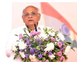
નિર્દેશો આપ્યા છે. જેમાં નેશનલ રૂરલ લાઈવલીહુડ મિશન તથા નેશન અર્બન લાઈવલીહુડ મિશનમાં નોંધાયેલા કે અન્ય સ્વેચ્છિક સ્વ સહાય જુથ જેમાં આજીવિકાના સમાન હેતુ થી જોડાયેલી મહિલાઓના એક અથવા એકથી વધુ સેલ્ફ હેલ્પ ગ્રુપને ટેક્સટાઈલ પોલિસી અંતર્ગત લાભ મળી શકશે.

અને કેટેગરી ક્લાસીફિકેશન હેઠળ સમાવેશ થતા તેમજ મ્યુનિસિપલ કોર્પોરેશન વિસ્તારની હદમાં સ્થાપિત એકમોને પણ ગુજરાત ટેક્સટાઈલ પોલીસ અંતર્ગત સહાય પાત્ર ગણવામાં આવશે. મુખ્યમંત્રીએ મહિલા સશક્તિકરણના અભિગમને વધુ વ્યાપક બનાવવા માટે ટેક્સટાઈલ પોલિસીની કેટલીક જોગવાઈઓમાં મહત્વપૂર્ણ સુધારા કરવાના નિર્દેશો આપ્યા છે.