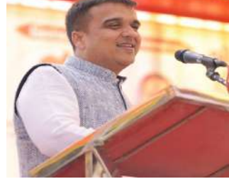
રાજ્યના ઉદ્યોગમંત્રી હર્ષ સંઘવીનો મુખ્ય હેતુ ગુજરાતની ઔદ્યોગિક ઈકોસિસ્ટમને મજબૂત કરવાનો અને રાજ્યના યુવાનો માટે મોટા પાયે નવી રોજગારીની તકો ઉભી કરવાનો છે. સરકારનું આ મુલાકાત દરમિયાન વિશ્વની નામાંકિત કંપનીઓ જેવી કે AP Moller

આંતરરાષ્ટ્રીય સહયોગ અને ઝડપી આર્થિક વિકાસ પ્રત્યે રાજ્ય સરકારની પ્રતિબદ્ધતા દર્શાવે છે. આ પ્રવાસ દરમિયાન નાયબ મુખ્યમંત્રી હર્ષ સંઘવી વિવિધ બેઠકોમાં ભાગ લેશે. ગુજરાતમાં રોજગારી અને ઔદ્યોગિક વિકાસને વેગ આપવા માટે તેઓ એડવાન્સ મેન્યુફેક્ચરિંગ, ટેક્સટાઈલ, સેમિકન્ડક્ટર, ફાર્માસ્યુટિકલ્સ, રિન્યુએબલ એનર્જી, ફૂડ પ્રોસેસિંગ, કેમિકલ્સ, શિપિંગ-લોજિસ્ટિક્સ અને એરોસ્પેસ જેવા મહત્વના ક્ષેત્રોમાં રોકાણ આકર્ષવા માટે વિશ્વના ટોચના ઉદ્યોગપતિઓ અને નેતાઓ સાથે પટ (પટ) જેટલી હાઈ-લેવલ 'વન-ટુ-વન' બેઠકો યોજશે.