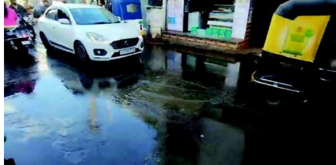
વાણણી દુભાઈ રહી છે. પવિત્ર મન અને શરીરે દર્શન કરવા જતા ભવિકો માટે આ ગંદકીમાંથી પસાર થવું ખૂબ જ

૫૬ સીડી, ગોમતી રોડ, જોધાભા યોક સહિતના વિસ્તારમાં કાયમી સમસ્યા, તંત્રનું મૌન