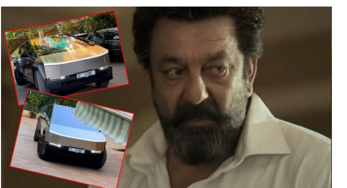
એલોન મસ્કના પ્રિય છે. જોકે, એવી ચર્ચા છે કે સંજુ બાબાએ ટેસ્લા સાયબરટ્રક ખરીદી છે. આ કાર હજુ સુધી ભારતમાં સત્તાવાર રીતે લોન્ચ થઈ નથી, તેથી મુંબઈની શેરીઓમાં તેનો દેખાવ ચર્ચાનો વિષય બની રહ્યો છે. ટેસ્લા સાયબરટ્રકની કિંમતની વાત કરીએ તો, આ ભવિષ્યવાદી કાર હજુ સુધી ભારતીય બજારમાં પ્રવેશી નથી. જોકે, જો ભારતમાં આયાત કરવામાં આવે તો, તેના સ્ટુઅલ-મોટર છંદક વેરિઅન્ટની કિંમત ૧.૫૦ કરોડથી ૧.૮૦ કરોડ અને ટ્રિપલ મોટર વેરિઅન્ટની કિંમત ૨.૧૦ થી ૨.૫૦ કરોડની વચ્ચે હોઈ શકે છે.

મુંબઈ, બોલીવુડ અભિનેતા સંજય દત્ત ઘણીવાર તેમના અભિનય તેમજ તેમની સંપત્તિ માટે સમાચારમાં રહે છે. તાજેતરમાં, અભિનેતા બ્લોકબસ્ટર 'ધુરંધર' માં પોલીસ અધિકારક અસલમ ચૌધરી તરીકે હેડલાઈન્સમાં છવાયેલા હતા અને હવે તેઓ પ્રભાસ અભિનીત ફિલ્મ "ધ રાજા સાબ" માં તેમની નકારાત્મક ભૂમિકા માટે સમાચારમાં છે. આ દરમિયાન, સંજય દત્તનો એક વીડિયો સોશિયલ મીડિયા પર વાયરલ થઈ રહ્યો છે, જેમાં તે એક એવી કાર ચલાવતો જોવા મળી રહ્યો છે જે હજુ સુધી ભારતમાં લોન્ચ થઈ નથી. સંજય દત્તના ગેરેજમાં પહેલાથી જ ટેન્જ રોવર, મર્સિડીઝ-મેબેક અને ડિફેન્ડર જેવી લક્ઝરી કારનો ભંડાર છે. હવે, એલોન મસ્કની પ્રિય ટેસ્લા સાયબરટ્રક તેમના કલેક્શનમાં જોડાઈ ગઈ છે. તાજેતરમાં, સંજય દત્ત મુંબઈમાં જોવા મળ્યો હતો, અને આ વીડિયો સોશિયલ મીડિયા પર ઝડપથી વાયરલ થઈ રહ્યો છે. તેનું કારણ તેની નવી કાર છે. વીડિયોમાં, સંજય દત્ત મુંબઈની શેરીઓમાં ટેસ્લા સાયબરટ્રક ચલાવતો જોવા મળે છે, જે વિશ્વના સૌથી ધનિક વ્યક્તિ