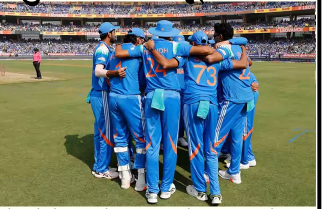
હતો અને તેના સ્થાને આર. ટુર્નામેન્ટમાંથી બહાર થઈ ગયો હતો. મોહિત શર્મા તેમના સ્થાને આવ્યો હતો. ૨૦૧૫નો વર્લ્ડ કપ ઓસ્ટ્રેલિયા અને ન્યૂઝીલેન્ડમાં રમાયો હતો. ઈશાંત શર્મા ટીમનો ભાગ હતો પરંતુ ઘૂંટણની ઈજાને કારણે શરૂઆત પહેલાં જ ટુર્નામેન્ટમાંથી બહાર થઈ ગયો હતો. મોહિત શર્મા તેમના સ્થાને આવ્યા. ૨૦૧૧ ના વર્લ્ડ કપ માટે પ્રવીણ કુમારનો ભારતીય ટીમનો સમાવેશ કરવામાં આવ્યો હતો.

૨૦ વર્લ્ડ કપ ચૂકી ગયો. તે ટીમની ભાગ હતો પણ કમરની તકલીફને કારણે રમી શક્યો નહીં. ટુર્નામેન્ટ શરૂ થાય તે પહેલાં જ મોહમ્મદ શમીને ટીમમાં સામેલ કરવામાં આવ્યો હતો. વીરેન્દ્ર સેહવાગ ઈજાને કારણે ટી ૨૦ વર્લ્ડ કપ ચૂકી ગયો. ૨૦૦૮માં, ખભાની ઈજાને કારણે તેને ટીમમાંથી બહાર કરવામાં આવ્યો હતો. ૨૦૧૦માં ખભાની ઈજાને કારણે તેની જગ્યાએ મુરલી વિજયને લેવામાં આવ્યો હતો. જ્યારે ૨૦૨૩ વર્લ્ડ કપ માટે ભારતીય ટીમની પસંદગી કરવામાં આવી ત્યારે અક્ષર પટેલનું નામ ટીમમાં સામેલ કરવામાં આવ્યું હતું. જોકે, ટુર્નામેન્ટ શરૂ થાય તે પહેલાં જ તે ઈજાગ્રસ્ત થઈ ગયો