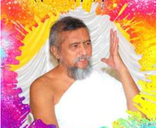
ભાવ અને ભક્તિસભર સામેયું કરવામાં આવશે. આ શુભ પ્રસંગે પૂજ્ય આચાર્ય મહારાજ સાહેબની સાથે ૨૪ સાધુ અને સાધ્વીજી ભગવંતો