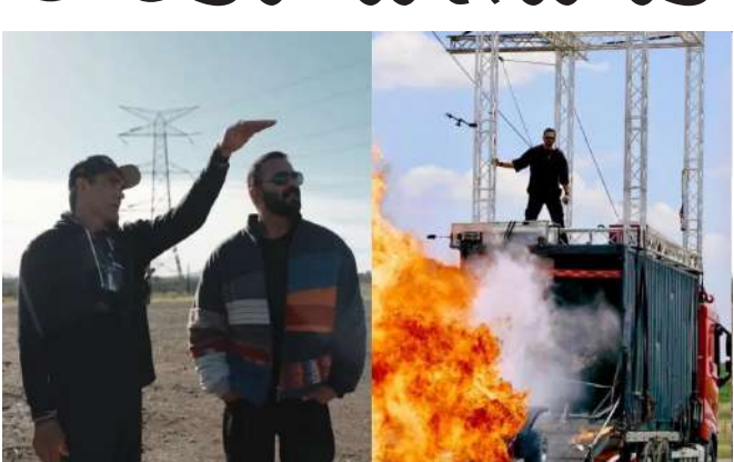
અને વાહનોનું વ્યક્તિગત રીતે નિરીક્ષણ કરતો જોવા મળ્યો હતો. રોહિત શેઠ્ઠીએ એક મજેદાર કેપ્શન સાથે વિડીયો અપલોડ કર્યો છે, "સ્ક્રીન પર રોમાંચ, પડદા પાછળ સલામતી... કોઈ કમ્પ્યુટર ગ્રાફિક્સ નહીં... કોઈ ખાસ ઢાંઢ નહીં... ફક્ત કાચો અને વાસ્તવિક સ્ટેટ... ખતરો કે ખિલાડીની દુનિયામાં આપનું

મુંબઈ, રોહિત શેઠ્ઠી અને તેમની ટીમ 'ખતરો કે ખિલાડી ૧૫' ના રિલીઝ માટે પૂરજોશમાં તૈયારીઓ કરી રહી છે. પ્રીમિયર રિલીઝ તારીખ જાહેર કરતા પહેલા, શોના હોસ્ટે એક વિડીયો શેર કર્યો છે જે સ્ટેટ-આધારિત રિયાલિટી શોના શૂટિંગ દરમિયાન લેવામાં આવતી સલામતીની સાવચેતીઓનું સુંદર રીતે પ્રદર્શન કરે છે. વિડીયોમાં, રોહિતે સમજાવ્યું કે તે સ્ટેટ કરતી વખતે સલામતીના તમામ નિયમોનું પાલન કરે છે અને સ્પર્ધકોની સલામતીને ધ્યાનમાં રાખીને, કાર્ય પહેલાં સ્ટેટ સેટઅપ