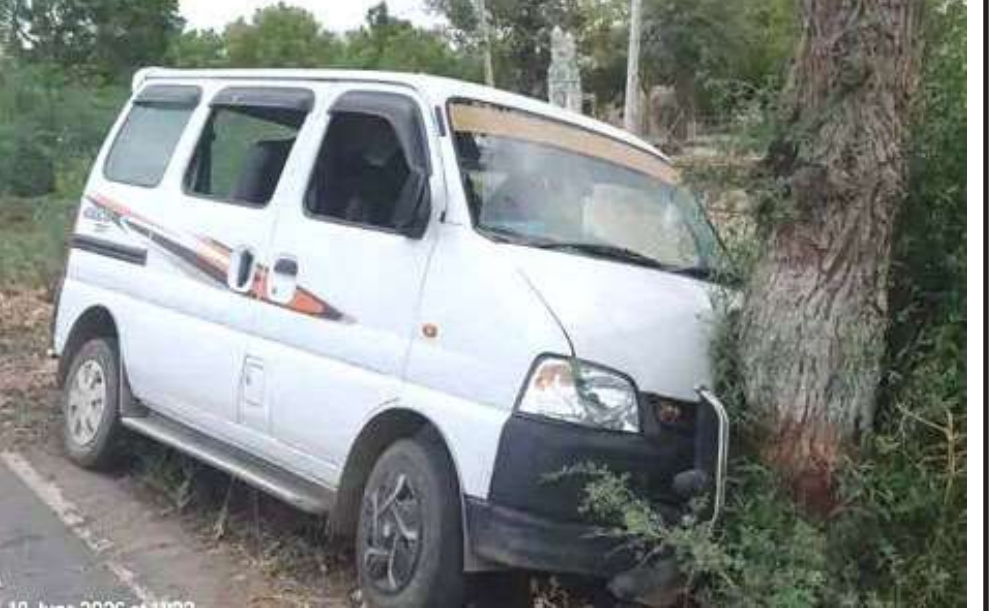
ઉમરાળાથી ચોગઠ રોડ પર દાતાર ચોકડી નજીક એક ગંભીર અકસ્માત સર્જાયો હતો, જેમાં એક ઈકો કાર ધડાકાભેર ઝાડ સાથે અથડાઈ હતી. પ્રાથમિક અહેવાલો અનુસાર, કાર ચાલકે અચાનક સ્ટેરિંગ પરનો કાબુ ગુમાવી દેતા કાર રોડ પરથી નીચે ઉતરી ગઈ હતી અને માર્ગ કિનારે આવેલા ઝાડ સાથે ભટકાઈ હતી. આ ખોરદાર ટક્કરને કારણે ઈકો કારને મોટું નુકસાન થયું હતું અને કાર ચાલકને શરીરે નાની-મોટી ઈજાઓ નુકસાની હતી. અકસ્માતને પગલે સ્થાનિક લોકો એકઠા થઈ ગયા હતા અને ઈજાગ્રસ્ત ચાલકને તાત્કાલિક સારવાર અર્થે નજીકની હોસ્પિટલમાં ખસેડવામાં આવ્યા હતા.