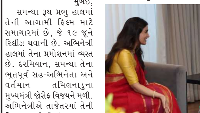
સુંદર નોંધ પણ લખી. સમન્થા વિજયને મળવા આવી ત્યારે લાલ સાડીમાં એકદમ સુંદર દેખાતી હતી. ફોટા શેર કરતા, તેણીએ તેના ભૂતપૂર્વ સહ-અભિનેત્રીની પ્રશંસા કરતી એક

મુંબઈ, સમન્થા રૂથ પ્રભુ હાલમાં તેની આગામી ફિલ્મ માટે સમાચારમાં છે, જે ૧૯ જૂને રિલીઝ થવાની છે. અભિનેત્રી હાલમાં તેના પ્રમોશનમાં બ્યસ્ટ છે. દરમિયાન, સમન્થા તેના ભૂતપૂર્વ સહ-અભિનેતા અને વર્તમાન તમિલનાડુના મુખ્યમંત્રી જોસેફ વિજયને મળી. અભિનેત્રીએ તાજેતરમાં તેની ફિલ્મ "મા ઈન્તી બંગારામ" ના પ્રમોશન માટે ચેન્નાઈની મુલાકાત લીધી હતી. તેણી મુખ્યમંત્રી વિજય સાથે મળી અને મુલાકાતના ફોટા સોશિયલ મીડિયા પર શેર કર્યા. અભિનેત્રીએ વિજય માટે એક