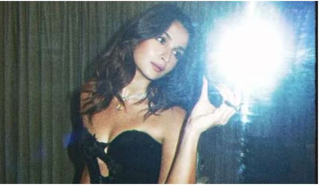
અમૃત રત્ન સન્માન ૨૦૨૬ માં બોલતા, આલિયા ભટ્ટે ખુલાસો કર્યો કે જ્યારે તે નાની હતી, ત્યારે તે ગોવિંદા અને કરિશ્મા કપૂરના ગીતો જોતી હતી અને ઘણીવાર ફિલ્મો વિશે વિચારતી હતી. આલિયાએ સમજાવ્યું, "સાચું કહું તો, હું બાળપણથી જ અરીસા સામે અભિનય કરતી આવી છું... મારા મનમાં એક સ્વપ્ન હતું કે એક દિવસ હું તે ટીવી શોમાં આવવા માંગુ છું. મને નાનપણથી જ ખબર હતી કે હું અભિનય કરવા માંગુ છું અને કેમ્પ સામે રહેવા માંગુ છું. હું બાળપણથી જ આ જ કરવા માંગુ છું."

મુંબઈ, આલિયા ભટ્ટ હવે વિવિધ કારણોસર સમાચારમાં છે. યશ રાજ ફિલ્મ્સની સ્પાય-થ્રિલર "આલ્ફા" નું ટ્રેલર તાજેતરમાં રિલીઝ થયું છે, જેમાં આલિયા ભટ્ટ મુખ્ય ભૂમિકામાં છે, ત્યાં "કલ્કી ૨૮૮૮ એડી" ની સિક્વલમાં તેણીને કાસ્ટ કરવામાં આવશે તેવી પણ ચર્ચા છે. દરમિયાન, આલિયા ભટ્ટે ફિલ્મ ઉદ્યોગમાં તેની સફર વિશે વાત કરી. તેણીએ ખુલાસો કર્યો કે તેણી બાળપણથી જ અભિનેત્રી બનવાનું સ્વપ્ન જોતી હતી. આલિયાએ ખુલાસો કર્યો કે તેણીએ ફિલ્મોમાં પ્રવેશ્યા પહેલા જ અભિનય શરૂ કરી દીધો હતો. તે અરીસામાં જોઈને અભિનય અને અભિનય કરતી હતી.