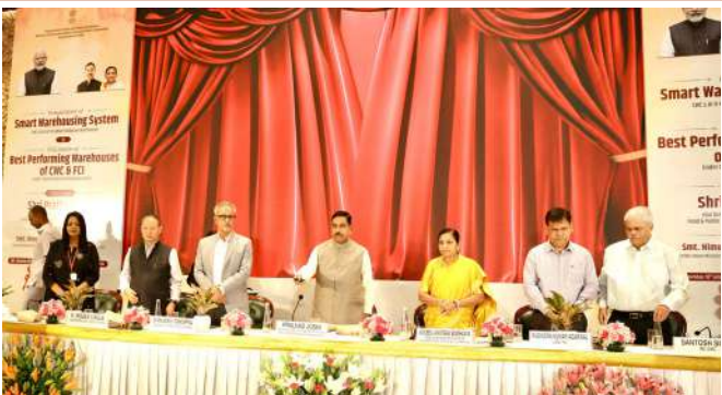
મંત્રાલય કામગીરીને વધુ પારદર્શક, ઝડપી અને અસરકારક બનાવવા માટે સતત અભ્યાસીક ટેકનોલોજીનો ઉપયોગ કરી રહ્યો છે. આ જ ક્રમમાં શરૂ કરવામાં આવેલી 'સ્માર્ટ વેરહાઉસિંગ સિસ્ટમ' દ્વારા સેન્ટ્રલ વેરહાઉસિંગ કોર્પોરેશન (CWC) ના ગોડાઉનોમાં આર્ટિફિશિયલ ઇન્ટેલિજન્સ (AI), ઇન્ટરનેટ ઓફ થિંગ્સ (IoT) અને CCTV જેવી સ્માર્ટ ટેકનોલોજીથી રિયલ-ટાઈમ

નવી દિલ્હી, તા. ૧૯ દેશમાં ખાદ્ય સંગ્રહ અને વિતરણ વ્યવસ્થાને આધુનિક બનાવવાની દિશામાં આજે એક ઐતિહાસિક પગલું લેવામાં આવ્યું છે. ખાદ્ય અને જાહેર વિતરણ મંત્રાલયના વ્યાપક સુધારા એજન્ડા હેઠળ આજે દેશમાં 'સ્માર્ટ વેરહાઉસિંગ સિસ્ટમ'નો ભારત મંડપમ ખાતેથી ઔપચારિક શુભારંભ કરવામાં આવ્યો હતો. આ મહત્વાકાંક્ષી પહેલનો મુખ્ય ઉદ્દેશ્ય ખાદ્ય પુરવઠા શૃંખલા (food supply chain) માં ડિજિટલ પરિવર્તન અને આધુનિકીકરણને પ્રોત્સાહન આપવાનો છે. ખાદ્ય અને જાહેર વિતરણ