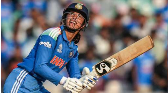
સમાવેશ થતો હતો. આ ટુર્નામેન્ટમાં તેની સતત બીજી સદી પણ હતી. તેની શાનદાર ઈનિંગને કારણે, ભારતે ૨૦ ઓવરમાં ૨૦૮ રનનો વિશાળ સ્કોર બનાવ્યો અને ત્યારબાદ ૯૫ રનથી મેચ જીતી લીધી. મંધાનાને તેના ઉત્કૃષ્ટ પ્રદર્શન માટે પ્લેયર ઓફ ધ મેચ જાહેર કરવામાં આવી. જોકે, ફક્ત તેની ઈનિંગ જ ચર્ચાનો વિષય ન હતી; તેની શાનદાર બેટિંગ દરમિયાન, મંધાનાએ ટી ૨૦ ક્રિકેટમાં ૬૦૦ થી વધુ બાઉન્ડ્રી ફટકારીને ઈતિહાસ રચ્યો. આ

નવીદિલ્હી, ભારતીય મહિલા ક્રિકેટ ટીમની ઉપ-કેપ્ટન સ્મૃતિ મંધાના સતત બેટથી ધમાલ મચાવી રહી છે. આ જ કારણ છે કે દરેક મેચમાં કોઈને કોઈ મોટો રેકોર્ડ બનતો અથવા તૂટતો જોવા મળે છે. આઈસીસી મહિલા ટી ૨૦ વર્લ્ડ કપ ૨૦૨૬ નેધરલેન્ડ્સ સામેની મેચમાં, મંધાનાએ એક એવો વિશ્વ રેકોર્ડ બનાવ્યો જે પુરુષ કે મહિલા ક્રિકેટમાં કોઈ પણ બેટ્સમેન ક્યારેય હાંસલ કરી શક્યો નથી. લીડસના હેડિંગ્સ સ્ટેડિયમમાં રમાયેલી મેચમાં, મંધાનાએ ૪૭ બોલમાં ૭૪ રનની શાનદાર ઈનિંગ રમી. તેની ઈનિંગમાં ૧૧ ચોગ્ગા અને એક છગ્ગાનો