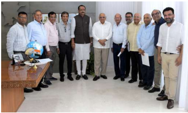
(GMB) દ્વારા રજૂ થનારી નવી પોલિસીમાં સુચવેલા ફેરફારોનો સ્વીકાર કરી તેને વહેલી તકે અમલી બનાવવાની માગ કરવામાં આવી છે. આ ઉપરાંત, HKC (હોંગકોંગ કન્વેન્શન) હેઠળ જે નિયમનો પહેલેથી જ આવરી લેવાયા છે, તેનું

ભાવનગર, તા. ૧૯ અલંગના શિપ રિસાયકલિંગ ઇન્ડસ્ટ્રીઝ એસોસિએશન (ઈન્ડિયા), રી-રોલિંગ મિલ એસોસિએશન અને ફર્નિસ એસોસિએશનના હોદ્દાદારો દ્વારા ગાંધીનગર ખાતે મુખ્યમંત્રી ભૂપેન્દ્રભાઈ પટેલને ઉદ્યોગના વિકાસમાં અવરોધરૂપ પડતર પ્રશ્નો અંગે વિગતવાર રજૂઆત કરવામાં આવી હતી. આ બેઠકમાં કૃષિમંત્રી જીતુભાઈ વાઘાણી પણ ઉપસ્થિત રહ્યા હતા.