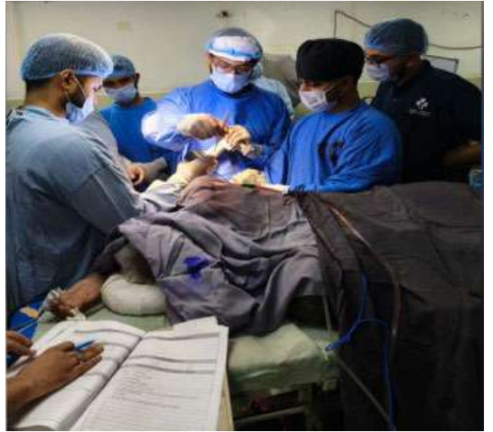
દર્દીએ લગભગ અઢી મહિના અગાઉ અન્યત્ર સર્જરી કરાવી હોવા છતાં સતત અસહ્ય દુ:ખાવો, કોષ્ટકોની ગતિમાં ગંભીર મર્યાદા અને દૈનિક જીવનની સામાન્ય પ્રવૃત્તિઓ કરવામાં મુશ્કેલી અનુભવતા હતા. ત્યારબાદ તેઓ વધુ સારવાર માટે પી. ડી.યુ.