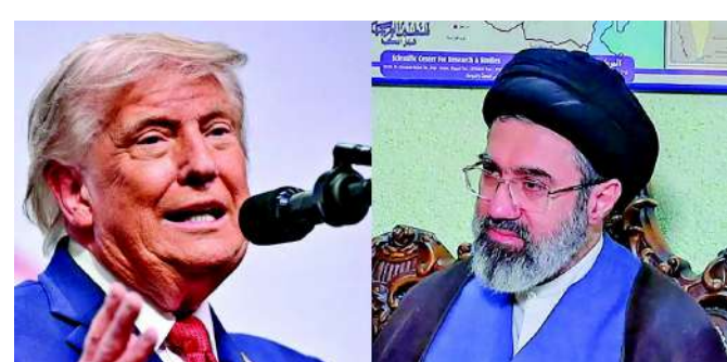
નવી દિલ્હી અમેરિકા અને ઈરાન વચ્ચે યુદ્ધ સમાપ્ત થવા અને ડીલ થઈ ગયા પછી, ઈરાનના સર્વોચ્ચ નેતા મોજતબા ખામેનેઈનું પહેલું નિવેદન સામે આવ્યું છે. ખામેનેઈએ દાવો કર્યો છે કે અમેરિકા રાષ્ટ્રપતિ ડોનાલ ટ્રમ્પે આ કરાર કરાવવા માટે લાચારીમાં આવીને તમામ પ્રકારના દબાણ

કરાર ઉપર હસ્તાક્ષર બાદ ઈરાનના સર્વોચ્ચ નેતાનું પ્રથમ નિવેદન અને દાવપેચનો ઉપયોગ કર્યો હતો. સાથે જ તેમણે જણાવ્યું કે, તેઓએ અમેરિકા સાથે થયેલા આ કરારને મંજૂરી આપી દીધી છે, જોકે તેમણે એવું પણ કહ્યું કે આ મુદ્દા પર તેમનો "અલગ અભિપ્રાય" હતો. તેમણે આ બાબતે વધુ વિગતો આપી ન હતી. તેમણે કહ્યું કે તેમણે આ કરારને આગળ વધવા દીધો કારણ કે ઈરાનના રાષ્ટ્રપતિ મસૂદ પેઝેશકિયાને તેમને ભરોસો આપ્યો હતો કે તેઓ ઈરાનના અધિકારોનું રક્ષણ કરશે. સર્વોચ્ચ નેતાએ એમ પણ કહ્યું કે ભવિષ્યમાં તેહરાન અને વોશિંગ્ટન વચ્ચે "આમને-સામને વાતચીત" થશે, પરંતુ તેનો અર્થ એ નહીં હોય કે "દુશ્મનના અભિપ્રાય કે સ્થિતિનો સ્વીકાર કરી લેવામાં આવ્યો છે." આ પહેલીવાર છે જ્યારે ખામેનેઈએ આ કરાર પર કોઈ પ્રતિક્રિયા આપી છે. ૨૮ ફેબ્રુઆરીના રોજ ઈરાન પર થયેલા અમેરિકા-ઈઝરાયેલના હુમલામાં તેમના પિતા અને પૂર્વ સુપ્રીમ લીડર અયાતુલ્લા અલી ખામેનેઈના અવસાન બાદ, માર્ચ મહિનામાં મોજતબાએ આ પદ સંભાળ્યું હતું. ત્યારપછી તેઓ સાર્વજનિક રૂપે ક્યારેય જોવા મળ્યા નથી. આમ તો ડોનાલ ટ્રમ્પે મોજતબા ખામેનેઈના નિવેદન પર સીધી રીતે કોઈ પ્રતિક્રિયા આપી નથી, પરંતુ તેમણે સોશિયલ મીડિયા પર એક પોસ્ટ મૂકી છે.