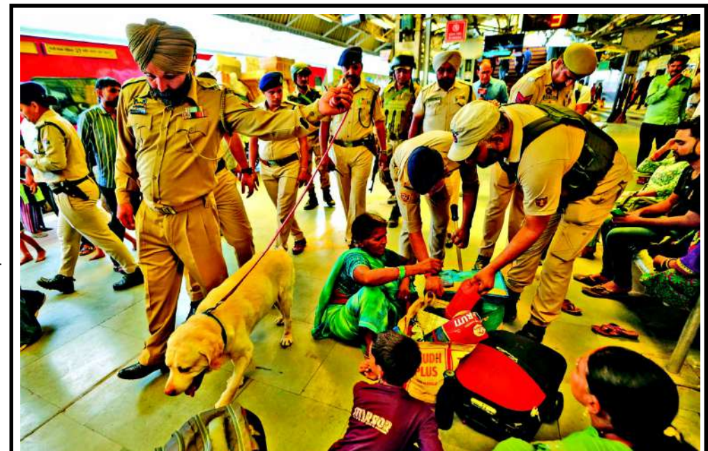
ભારતમાં અમરનાથ યાત્રાનું એક આગવું મહત્વ છે. દેશભરમાંથી ભાવિકો અમરનાથ યાત્રાએ જ્યા છે ત્યારે યાત્રિકોની સુરક્ષા માટે તંત્ર સજ્જ થયું છે. રેલવે સ્ટેશન પર સુરક્ષા અધિકારીઓ દ્વારા માલસામાનનું ચેકિંગ કરવામાં આવી રહ્યું છે.

વાયદા બજારમાં સુનામી : સોનામાં ૨૬૦૦ અને ચાંદીના ભાવમાં ૩.૭૦૦૦નો કડાકો ફૂડ ઓઈલના ભાવમાં ઘટાડો અને યુએસ ફેડરલ રિઝર્વ દ્વારા વ્યાજ દરો યથાવત રાખવામાં આવતા વાયદા બજાર તૂટ્યું મુંબઈ સંપૂર્ણપણે તૂટી ગયું છે. વાયદા બજારની માહિતી અનુસાર, ચાંદી અત્યારે રૂ. ૨૩૦૮૭૯.૦૦ પર ટ્રેડ કરી રહી છે, જે આગલા બંધ ભાવથી ૬૬૯૩.૦૦ (-૨.૮૨%) નો સીધો ઘટાડો દર્શાવે છે. જો દિવસના સૌથી નીચા સ્તરની સરખામણી કરીએ તો તેમાં મહત્તમ ૭૦૪૮ નો મોટો કડાકો આવી ચૂક્યો છે. સોનાના ભાવમાં પ્રતિ ૧૦ ગ્રામ રૂ. ૨૬૦૦ થી વધુ અને ચાંદીમાં પ્રતિ કિલોગ્રામ રૂ. ૭૦૦૦ થી વધુનો આકરો ઘટાડો થતાં બજાર સોનું અત્યારે ૧૪૬૭૧૪.૦૦ પર ટ્રેડ થઈ રહ્યું છે, જે આગલા બંધથી -૨૫૯૫.૦૦ (-૧.૭૪%) નો ઘટાડો દર્શાવે છે. દિવસના સૌથી નીચા સ્તરને સરખાવતા સોનામાં એક તબક્કે ૨૬૦૮ નો જંગી ઘટાડો નોંધાયો છે. બજારના આર્થિક નિષ્ણાતોના જણાવ્યા અનુસાર સોના-ચાંદીમાં આવેલા આ અચાનક કડાકા પાછળ બે મુખ્ય વૈશ્વિક કારણો જવાબદાર માનવામાં આવી રહ્યા છે: