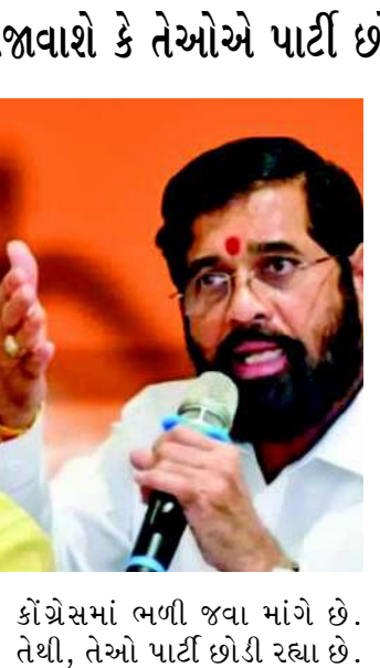
પત્રમાં સાંસદોએ જણાવ્યું હતું કે વરિષ્ઠ યુબીટી નેતાઓ પાર્ટીને કોંગ્રેસમાં ભળી જવા માંગે છે. તેથી, તેઓ પાર્ટી છોડી રહ્યા છે.

બળવાખોર સાંસદો એક પત્ર જાહેર કરશે જેમાં સમજાવશે કે તેઓએ પાર્ટી છોડવાનો નિર્ણય કેમ લીધો કે સ્વીકરની ઓફિસ ચકાસણી માટે કેટલાક સાંસદોની ભૌતિક હાજરીની જરૂર છે. તેમણે કહ્યું કે આ આગામી દિવસોમાં થવાની અપેક્ષા છે. સૂત્રોએ જણાવ્યું હતું કે સહીઓની ચકાસણી હાલમાં ચાલુ છે. શિવસેનાના તમામ છ બળવાખોર સાંસદોએ શિંદેની આગેવાની હેઠળની શિવસેનામાં વિલીનીકરણની માંગણી કરતો પત્ર પર હસ્તાક્ષર કર્યા છે. તે લોકસભા સ્પીકર ઓમ બિરલાને મળ્યા. સાંસદોએ લોકસભા સ્પીકરને એક પત્ર સુપરત કર્યો છે. સૂત્રોએ જણાવ્યું હતું કે આ પત્રમાં સાંસદોએ સ્પષ્ટપણે જણાવ્યું હતું કે તેઓ શિવસેના (શિંદે) જૂથમાં ભળી રહ્યા છે.