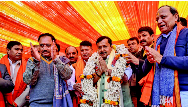
અને રાજનાથ સિંહ જેવા અગ્રણી ઉમેદવારી ફોર્મ પર ૨૦ પ્રસ્તાવકોની સહીઓ છે. આવતીકાલે સવારે ૧૧

નવીદિલ્હી, ભારતીય જનતા પાર્ટીના રાષ્ટ્રીય અધ્યક્ષ ચૂંટણી માટે નામાંકન પ્રક્રિયા પૂર્ણ થઈ ગઈ છે. ભાજપના કાર્યકારી પ્રમુખ નીતિન નવીન માટે કુલ ૩૭ ઉમેદવારી પત્રો દાખલ કરવામાં આવ્યા છે. આ નામાંકન રાજ્યો અને કેન્દ્રશાસિત પ્રદેશો વતી દાખલ કરવામાં આવ્યા છે. સંસદીય પક્ષના નામાંકન પત્ર પર પ્રસ્તાવક તરીકે પીએમ મોદીની સહી છે. સંસદીય પક્ષ વતી, વડા પ્રધાન નરેન્દ્ર મોદી, ગૃહ પ્રધાન અમિત શાહ, નીતિન ગડકરી