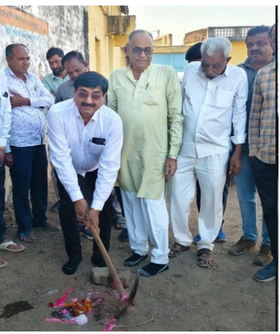
અગાઉ અભ્યાસ કરી ચૂકેલાં ઉદ્યોગપતિઓ, શિક્ષણવિદ, અનેક આ જ ગામનાં વતનીઓ પત્રકારો તરીકે આજે મોટી નામનાં મેળવેલ છે.