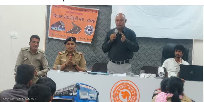
અને ઓવરટેક કરવાનું હોય ત્યારે સાઈડ ઈન્ડિકેટરનો ઉપયોગ કરવો. એસ.ટી. સૂત્ર સ્વચ્છ, સલામત, સમયબદ્ધતાને વળગી રહેવું સહિતની બાબતોને લઈને

અમરેલી: જાન્યુઆરી ૨૦૨૬ માસ દરમિયાન જી.એસ.આર.ટી.સી નિયામક કચેરી ખાતે ભાવનગર, અમરેલી, જુનાગઢ જિલ્લાના કુલ ૧૩૦ ડ્રાઈવર્સ અને કંડક્ટરોને રોડ સેફ્ટી વિષયક માહિતી માર્ગદર્શન આપવામાં આવ્યું હતું. જેમાં નશામાં વાહન ચલાવવું નહિ, નો-પાર્કિંગ ઝોનમાં વાહન પાર્કિંગ કરવું નહિ, ટીનિંગ વખતે વાહન ધીમું રાખવું, લેન ડ્રાઈવીંગ કરવું, વાહનને વળાંક લેવાનો હોય