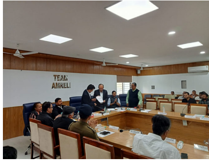
વર્ષ ૨૦૨૪-૨૫ દરમિયાન ૫૦ ટકા કે તેથી વધુ વસૂલાત કરેલ હોય તેવી ગ્રામ પંચાયતો, પાણી સમિતિઓ અને સેલ્ફ હેલ્પ ગ્રુપ ઉપરાંત

અમરેલી: ગ્રામ્ય કક્ષાની પાણી પુરવઠા યોજનાઓનું અસરકારક અને યોગ્ય સંચાલન થાય, માળખું સુદૃઢ બને, પાણીવેરાની વસૂલાતમાં નિયમિતતા આવે તેમજ ગ્રામ પંચાયત સક્ષમ બને અને લોકોને નિયમિત પાણી પુરવઠો મળી રહે એ હેતુથી નર્મદા જળ સંપત્તિ, પાણી પુરવઠા અને કલપસર વિભાગ (પાણી પુરવઠા વિભાગ) હેઠળ ગ્રામ પંચાયત માટે પાણીવેરા વસૂલાત પ્રોત્સાહન યોજના અમલમાં છે.