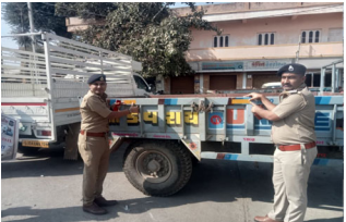
રસ્તાઓમાંથી વાહન પસાર થાય છે ત્યારે ગામડામાં નાના રસ્તાઓમાં લાઈટ આવેલ ન હોય અને ટ્રેલર, છકડો, સનેડામાં પાછળની બાજુએ લાઈટ આવેલ

અમરેલી: ‘શીખ સે સુરક્ષા, ટેકનોલોજી સે પરિવર્તન’ અંતર્ગત જાન્યુઆરી માસ દરમિયાન આર.ટી.ઓ અમરેલી દ્વારા રોડ સેફ્ટીની વિવિધ પ્રવૃત્તિઓ યજવામાં આવી રહી છે. જેમાં જનજાગૃતિ વધારવાના પ્રયત્નો સામેલ છે.