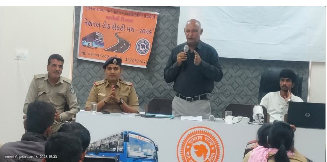
અને ઓવરટેક કરવાનું હોય ત્યારે સાઈડ ઈન્ડિકેટરનો ઉપયોગ કરવો. એસ.ટી. સૂત્ર સ્વચ્છ, સલામત, સમયબદ્ધતાને વળગી રહેવું સહિતની બાબતોને લઈને

અમરેલી: જાન્યુઆરી ૨૦૨૬ માસ દરમિયાન જી.એસ.આર.ટી.સી નિયામક કચેરી ખાતે ભાવનગર, અમરેલી, જુનાગઢ જિલ્લાના કુલ ૧૩૦ ડ્રાઈવર્સ અને કંડક્ટરોને રોડ સેફ્ટી વિષયક માહિતી માર્ગદર્શન આપવામાં આવ્યું હતું. જેમાં નશામાં વાહન ચલાવવું નહિ, નો-પાર્કિંગ ઝોનમાં વાહન પાર્કિંગ કરવું નહિ, ટીનિંગ વખતે વાહન ધીમું રાખવું, લેન ડ્રાઈવીંગ કરવું, વાહનને વળાંક લેવાનો હોય