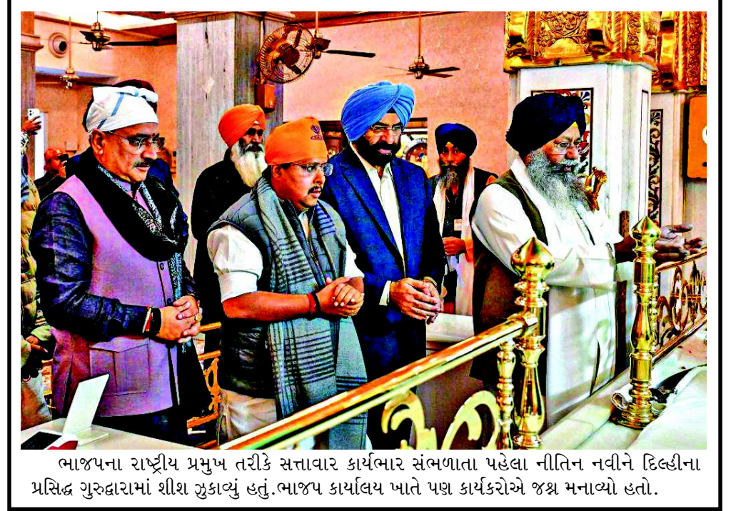
ભાજપના રાષ્ટ્રીય પ્રમુખ તરીકે સત્તાવાર કાર્યભાર સંભળાતા પહેલા નીતિન નવીને દિલ્હીના પ્રસિદ્ધ ગુરુદ્વારામાં શીશ ઝુકાવ્યું હતું.ભાજપ કાર્યાલય ખાતે પણ કાર્યકરોએ જશ્ન મનાવ્યો હતો.

આ સંક્ષિપ્ત મુલાકાત દરમિયાન યુએઈના રાષ્ટ્રપતિ શેખ મોહમ્મદ બિન ઝાયેદ અલ નાહયાન માત્ર ૧.૪૫ કલાક માટે જ ભારત આવ્યાં હતાં, પરંતુ આ બેઠક કે કલાક સુધી ચાલી હતી. જોકે તેમ છતાં પણ આ વિચની સૌથી નાની વિદેશ યાત્રા કહેવાશે. આટલા ટૂંકા સમય માટે મોટા દેશના રાષ્ટ્રપતિનું આગમન આશ્ચર્યજનક હતું પરંતુ આ દરમિયાન અનેક મુદ્દાઓ પર બંને દેશોએ સમજૂતી કરાર કર્યાં છે.