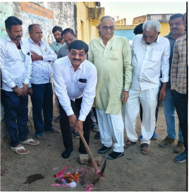
અગાઉ અભ્યાસ કરી ચૂકેલાં ઉદ્યોગપતિઓ, શિક્ષણવિદ, અનેક આ જ ગામનાં વતનીઓ આજે મોટા શહેરમાં જઈ નામનાં મેળવેલ છે.

આ નાનકડાં પરંતુ રળિયામણાં ગામમાં ધારાસભ્ય ગ્રાન્ટમાંથી દેવળા પ્રાથમિક શાળા સુધી શરૂ કરી પાટી વાળા રસ્તે રૂપિયા ૫ લાખના ખર્ચે પેવિંગ બ્લોકના કામનું ખાતમૂહુર્ત ધારીના ધારાસભ્ય જે.વી. કાકડીયાના હસ્તે કરવામાં આવ્યું હતું.