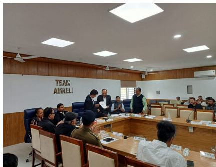
વર્ષ ૨૦૨૪-૨૫ દરમિયાન ૫૦ ટકા કે તેથી વધુ વસૂલાત કરેલ હોય તેવી ગ્રામ પંચાયતો, પાણી સમિતિઓ અને સેલ્ફ હેલ્પ ગ્રુપ ઉપરાંત

અમરેલી: ગ્રામ્ય કક્ષાની પાણી પુરવઠા યોજનાઓનું અસરકારક અને યોગ્ય સંચાલન થાય, માળખું સુદૃઢ બને, પાણીવેરાની વસૂલાતમાં નિયમિતતા આવે તેમજ ગ્રામ પંચાયત સક્ષમ બને અને લોકોને નિયમિત પાણી પુરવઠો મળી રહે એ હેતુથી નર્મદા જળ સંપત્તિ, પાણી પુરવઠા અને કલપસર વિભાગ (પાણી પુરવઠા વિભાગ) હેઠળ ગ્રામ પંચાયત માટે પાણીવેરા વસૂલાત પ્રોત્સાહન યોજના અમલમાં છે.