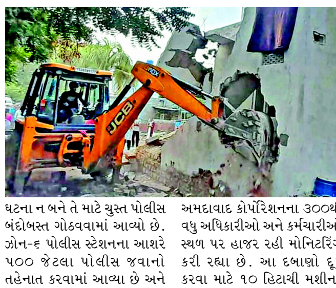
અમદાવાદ કોર્પોરેશનના ૩૦૦થી વધુ અધિકારીઓ અને કર્મચારીઓ ઝોન-૬ પોલીસ સ્ટેશનના આશરે ૫૦૦ જેટલા પોલીસ જવાનો તહેનાત કરવામાં આવ્યા છે અને

અમદાવાદ મ્યુનિસિપલ કોર્પોરેશન દ્વારા શહેરના તળાવોને દબાણમુક્ત કરવાની ઝુંબેશ તેજ કરવામાં આવી છે. ચંડોળા અને ઈસનપુર બાદ આજે વટવા વિસ્તારમાં આવેલા વાંદરવટ તળાવ પર મેગા ડિમોલિશન હાથ ધરવામાં આવ્યું છે. તળાવની અંદર અને તેની આસપાસ ખડકાયેલા ૪૦૦ જેટલા ગેરકાયદે દબાણોને દૂર કરવાની કામગીરી શરૂ કરાઈ છે. વટવા વિસ્તારમાં આવેલા વાંદરવટ તળાવ પર દબાણ હટાવવાની પ્રક્રિયા દરમિયાન કોઈ અનિચ્છનીય