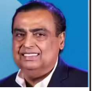
માહિતી આપી હતી કે બેટરી ગીળા ફેક્ટરીની ક્ષમતા વધારીને ૧૨૦ ઈંચ કરવામાં આવશે. રિલાયન્સ ગ્રીન એનર્જીના માટે સેમસંગ (Samsung C&T) સાથે ૩ બિલિયન ડોલરનો ઐતિહાસિક પુરવઠા કરાર પણ કર્યો છે. કચ્છનો શુદ્ધ પ્રદેશ જ્યાં અમે ૫,૫૦,૦૦૦ એકર કરતાં વધુ વિસ્તારમાં એક રિન્યુએબલ એનર્જી હબ વિકસાવી રહ્યા છીએ. તેમણે ઉમેર્યું હતું કે, જે વિશ્વમાં સપ્લાય થઈ નેન પડકારવામાં આવી રહી છે અને ટેકનોલોજીની પહોંચને હથિયાર બનાવવામાં આવી રહી છે, ત્યાં ભારતમાં વૈશ્વિક સ્તરની બેટરી ઉત્પાદન ક્ષમતાનું નિર્માણ કરવું એ માત્ર એક વ્યાપારી નિર્ણય નથી. તે રાષ્ટ્રીય સ્થિતિસ્થાપકતા માટે એક વ્યૂહાત્મક અનિવાર્ય છે. રિલાયન્સ ઈન્ડસ્ટ્રીઝના સ્થાપક અને ચેરપર્સન શ્રીમતી નીતા અંબાણીએ જણાવ્યું હતું કે, "અમારું લક્ષ્ય એક મિલિયન મહિલા સાહસિકોનો સશક્ત બનાવવા ઉપરાંત બે લાખ યુવા ભારતીયોને રોજગારી મેળવવામાં મદદ કરવાનું તેમજ ગ્રામીણ પરિવહન માટે ૨૦ મિલિયનથી વધુ લોકો સુધી પહોંચાવવાનું છે. અમે આપણી કળા, કલાકારો અને કારીગરોને ટેકો આપવા સાથે ભારતીય સંસ્કૃતિને વૈશ્વિક મંચ પર પ્રેમ, આદર અને ગૌરવ સાથે આગળ વધારીએ છીએ."