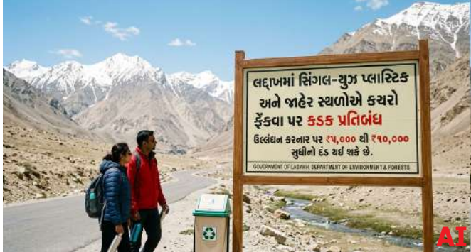
પર્યાવરણનું રક્ષણ કરવાનો અને પર્યટન સ્થળોની કુદરતી સુંદરતા જાળવવાનો છે. પ્લાસ્ટિક કચરા અને ખુલ્લામાં કચરાને કારણે વધતા પ્રવાસન પ્રદેશને પર્યાવરણીય નુકસાન પહોંચાડી રહ્યું છે. પ્રતિબંધ હેઠળ જે વસ્તુઓ પર પ્રતિબંધ રહેશે: પ્લાસ્ટિક કટલરી (ચમચી, કાંટા, વગેરે), પ્લાસ્ટિક કપ, પ્લેટ અને સ્ટ્રો, પ્લાસ્ટિક ટ્રે, પેકિંગ/રિપિંગ ફિલ્મ, થર્મોકોલ સુશોભન સામગ્રી, પ્લાસ્ટિકના ધ્વજ, પ્લાસ્ટિક સ્ટિચર, નિર્ધારિત જાડાઈ કરતા ઓછા પ્લાસ્ટિકના બેનરો, ગુનેગારોને પકડવા માટે સીસીટીવીની પણ તપાસ કરવામાં આવશે.

સિંગલ-યુઝ પ્લાસ્ટિક અને જાહેર સ્થળોએ કચરો ફેંકવા પર કડક પ્રતિબંધ અમલમાં આવ્યો છે. લેફ્ટનન્ટ ગવર્નર વીકે સક્સેનાએ આ અંગે કડક સૂચનાઓ જારી કરી છે. ઉલ્લંઘન કરવાથી ભારે દંડ થશે. લદાખમાં, સિંગલ-યુઝ પ્લાસ્ટિકનો ઉપયોગ, વેચાણ અને કચરો હવે મોંઘે પડશે. લેફ્ટનન્ટ ગવર્નર વિનય કુમાર સક્સેનાએ કેન્દ્રશાસિત પ્રદેશ લદાખમાં ઓળખાયેલી સિંગલ-યુઝ પ્લાસ્ટિક વસ્તુઓ પર કડક પ્રતિબંધ મૂકવાનો આદેશ આપ્યો છે. નવા નિયમો હેઠળ, સિંગલ-યુઝ પ્લાસ્ટિક પ્રતિબંધનું ઉલ્લંઘન કરતી વ્યક્તિઓ, વ્યાપારી સંસ્થાઓ, હોટલ, રેસ્ટોરન્ટ અને અન્ય સંસ્થાઓને ૧૦,૦૦૦ નો પર્યાવરણીય દંડ ફટકારવામાં આવશે. કચરો ફેંકવા બદલ ૫,૦૦૦ નો દંડ ફટકારવામાં આવશે. જાહેર સ્થળોએ કચરો ફેંકવા પર ૫,૦૦૦ નો દંડ ફટકારવામાં આવશે. વધુમાં, લેડ એરપોર્ટ અને લદાખના પ્રવેશ સ્થળો પર સિંગલ-યુઝ પ્લાસ્ટિકની તપાસ કરવામાં આવશે. આ પહેલનો હેતુ લદાખના નાજુક હિમાલયી