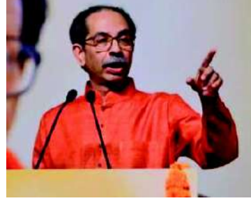
દિવસે શિવસેનાનો લાગશે તે દિવસે હું હટી જઈશ.' ઉદ્ધવ ઠાકરેએ 'ઓપરેશન તોડવા'

મુંબઈ શિવસેનાની સ્થાપનાને ૬૦ વર્ષ પૂર્ણ થવાના અવસરે ઉદ્ધવ ઠાકરે મોટું નિવેદન આપ્યું છે. તેમણે ભાવુક અંદાજમાં કાર્યકર્તાઓને કહ્યું કે, 'જો પાર્ટી કાર્યકર્તાઓ અને નેતાઓને લાગે કે હું શિવસેના પ્રમુખ પદ માટે યોગ્ય નથી, તો હું આજે જ પદ છોડવા તૈયાર છું. હું કોઈપણ લાયક વ્યક્તિને શિવસેનાના અધ્યક્ષ બનાવવા તૈયાર છું. હું પડકારોથી પીછેહઠ કરવાનો નથી, પરંતુ જે