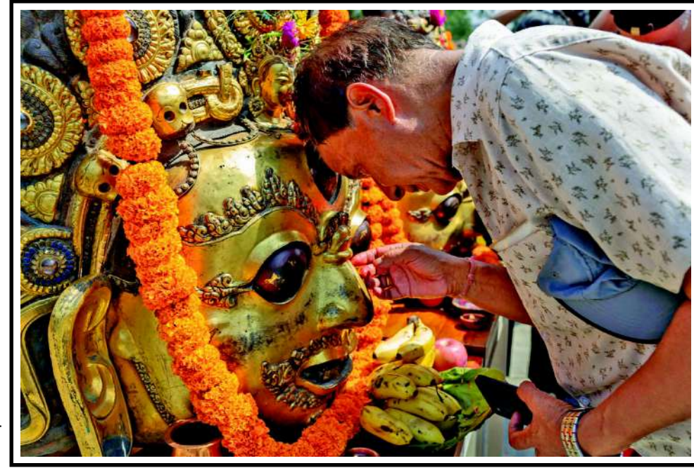
નેપાળના રાષ્ટ્રીય સંગ્રહાલયમાંથી દોલખામાં તેના મૂળ મંદિર તરફ જતા ૧૬મી સદીના ભેરવ માસ્કમાંથી એકને એક માણસ સ્પર્શ કરે છે. આ માસ્ક ૧૯૯૪માં ચોરાઈ ગયા હતા અને યુએસ મ્યુઝિયમમાંથી મળી આવ્યા હતા અને ૩૦ વર્ષ પછી નેપાળ પરત કરવામાં આવ્યા હતા.

ટ્રેકિંગ વેબસાઇટ્સના જણાવ્યા અનુસાર, આ અકસ્માત શુક્રવારે સાંજે આશરે ૫:૧૫ વાગ્યે બેડફોર્ડ શહેરની બહાર સર્જાયો હતો. અકસ્માતનો ભોગ બનેલી બંને ટ્રેનો દક્ષિણ તરફ લંડનના સેન્ટ પેનકાસ સ્ટેશન જઈ રહી હતી.