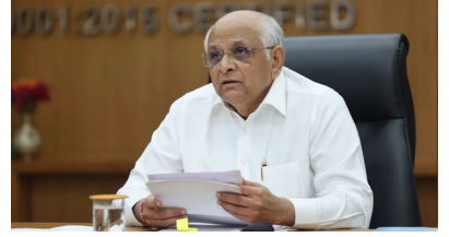
પ્રધાનમંત્રી નરેન્દ્ર મોદી પશ્ચિમ બંગાળના પ્રવાસેથી દેશભરના ખેડૂતોને વર્ચ્યુઅલી સંબોધિત કરશે અને ત્યાંથી જ એક સિંગલ ક્લિક દ્વારા સહાયની રકમ મુક્ત કરશે. પીએમ મોદીના આ આદેશ સાથે જ દેશભરના આશરે ૮.૪૪ કરોડ ખેડૂત પરિવારોના બેંક ખાતામાં કુલ રૂપિયા ૧૮,૮૮૦ કરોડની જગી સહાય રકમ ઓનલાઈન જમા થઈ જશે. કેન્દ્ર સરકારનું આ પગલું ગ્રામીણ અર્થતંત્રને વેગ આપવા અને ખરીફ પાકની મોસમમાં ખેડૂતોને બિયારણ તેમજ ખાતરની ખરીદીમાં આર્થિક મદદરૂપ સાબિત થશે.

ખેડૂતોના ખાતામાં મોટી રકમ જમા થવા જઈ રહી છે. પ્રધાનમંત્રી નરેન્દ્ર મોદી આવતીકાલે દેશભરના અગ્રદાતાઓ માટે સહાયનો આગામી હમો સત્તાવાર રીતે રિલીઝ કરશે. આ અંતિ મહત્વના અવસરને વધાવવા