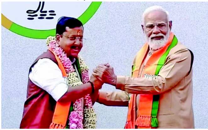
હાર્દિક અભિનંદન પાઠવું છું. ઘણા મહિનાઓથી, પક્ષના નાનામાં નાના એકમથી લઈને રાષ્ટ્રીય અધ્યક્ષ સુધીની સંગઠન પ્રક્રિયા

પીએમમોદીએ કહ્યું, "હું નીતિન નવીનજીને વિશ્વના સૌથી મોટા રાજકીય પક્ષના પ્રમુખ તરીકે ચૂંટાયા બદલ હાર્દિક અભિનંદન પાઠવું છું"