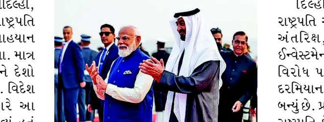
ઓળખ બની ગઈ છે. આ મુલાકાત દરમિયાન બંને દેશોએ રક્ષા, અંતરિક્ષા અને ઈન્ફ્રાસ્ટ્રક્ચરના ક્ષેત્રમાં મહત્વના કરાર કર્યા.

આ મુલાકાતમાં બંને દેશોએ રક્ષા, અંતરિક્ષા અને ઈન્ફ્રાસ્ટ્રક્ચરના ક્ષેત્રમાં મહત્વના કરાર કર્યા