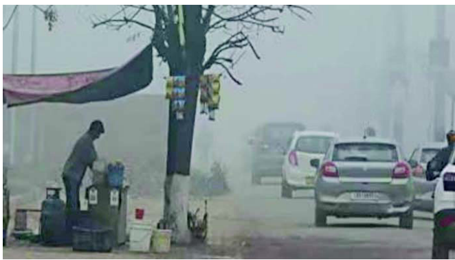
મોજુ ફરી વળ્યું હતું.

રાજકોટ, રાજકોટ સહિત સૌરાષ્ટ્ર-કચ્છમાં ઠંડીમાં સામાન્ય ઘટાડો નોંધાયો છે. જ્યારે ગિરનાર ઉપર ઠંડી યથાવત છે. ગિરનાર ૫.૫ ડિગ્રી ઠંડી નોંધાઈ છે. જ્યારે કચ્છના નલીયામાં ૧૦.૮, અમરેલી ૧૧.૬, રાજકોટ ૧૧.૫, જામનગરમાં ૧૨ ડિગ્રી લઘુતમ તાપમાન નોંધાયું છે.