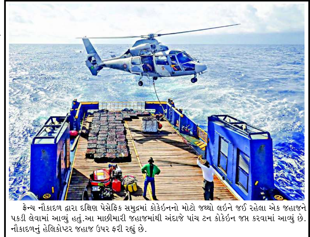
કેન્યા નૌકાદળ દ્વારા દક્ષિણ પેસેફિક સમુદ્રમાં કોકોઈનનો મોટો જથ્થો લઈને જઈ રહેલા એક જહાજને પકડી લેવામાં આવ્યું હતું. આ માછીમારી જહાજમાંથી અંદાજે પાંચ ટન કોકોઈન જપ્ત કરવામાં આવ્યું છે. નૌકાદળનું હેલિકોપ્ટર જહાજ ઉપર ફરી રહ્યું છે.

બોઈ પરના એક પત્રકારના જણાવ્યા અનુસાર, ટેકનિકલ ખામી થોડી વારમાં પ્રેસ કેમિન્ટની લાઈટ્સ બંધ થઈ ગઈ હતી. જોકે, તે સમયે કોઈ સત્તાવાર કારણ આપવામાં આવ્યું ન હતું. ઉડાન ભર્યાના લગભગ અડધા કલાક પછી, પત્રકારોને જાણ કરવામાં આવી કે વિમાન પરત ફરી રહ્યું છે. એરફોર્સ વન વોશિંગ્ટન, ડી.સી. વિસ્તારમાં સુરક્ષિત રીતે ઉતર્યું. ત્યારબાદ રાષ્ટ્રપતિનો સ્ટાફ બેકઅપ વિમાનમાં સ્વિટ્ઝર્લેન્ડના દાવોસ ગયો. વિમાન ઉપાડ્યા બાદ થોડી ઘ