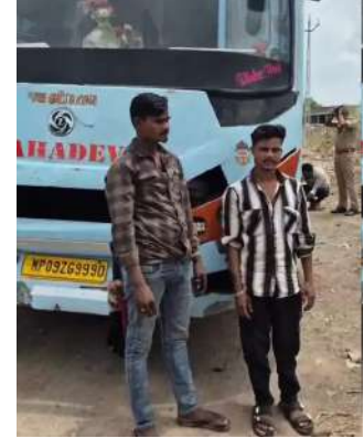
બનાવેલા ગુપ્ત ચોરખાનામાંથી ભારતીય બનાવટનો વિદેશી દારૂ અને બિયરનો જથ્થો મળી આવ્યો હતો.

અમરેલી: અમરેલી જિલ્લામાં દારૂની હેરાફેરી સામે પોલીસે કાર્યવાહી કરતાં ખાનગી પેસેન્જર બસમાં બનાવવામાં આવેલા ગુપ્ત ચોરખાનામાંથી વિદેશી દારૂ અને બિયરનો જથ્થો ઝડપી પાડ્યો છે. પોલીસે બે શખ્સોને ઝડપી પાડ્યા છે, જ્યારે એક ફરાર હોવાનું સામે આવ્યું છે. શહેર પોલીસને મળેલી બાતમીના આધારે પીઆઈ એમ. એમ. ઝાલાના માર્ગદર્શન હેઠળ શહેર પોલીસ ટીમે ગઈ કાલે બપોરના સમયે અમરેલી રોડ પર લાકી બાયપાસથી ચિત્તલ તરફ જતાં માર્ગ પર ચેકિંગ દરમિયાન એક પેસેન્જર બસને અટકાવી તપાસ કરવામાં આવી હતી. તપાસ દરમિયાન બસમાં ખાસ