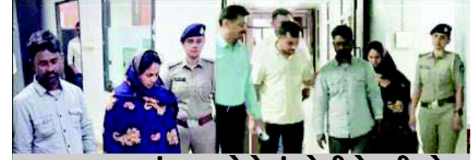
૧૫ રાજ્યમાં ૫૬ શહેરોમાં સોની વેપારીઓ સાથે છેતરપીંડી આચરી હોવાની કબૂલાત