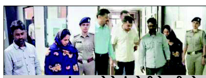
૧૫ રાજ્યમાં ૫૬ શહેરોમાં સોની વેપારીઓ સાથે છેતરપીંડી આચરી હોવાની કબૂલાત