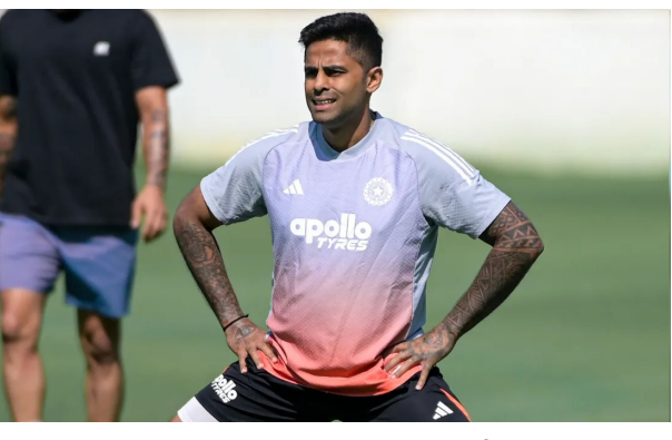
ફેરફાર કરવાના મૂકમાં નથી. ટી ૨૦ શ્રેણીની પ્રથમ મેચ પહેલાં પ્રેસ કોન્ફરન્સમાં, કેપ્ટને તેમના બેટિંગ ક્રમમાં પણ સ્પષ્ટતા કરી. તેમણે કહ્યું કે તેઓ ટીમની જરૂરિયાતોને આધારે શ્રીજી અથવા ચોથા નંબર પર રમી શકે છે. સૂર્યકુમારે એમ પણ કહ્યું કે તેમને ભારત માટે આ બંને સ્થાનોનો અનુભવ છે. આંકડાકીય રીતે, ચોથા નંબર પર તેમનું પ્રદર્શન થોડું સારું રહ્યું છે, જોકે શ્રીજી નંબર પર તેમનું પ્રદર્શન પણ સારું છે. લાંબા સમયથી ફોર્મ સાથે સંબંધ કરી રહેલા સૂર્યકુમાર યાદવે સ્પષ્ટપણે કહ્યું કે તેઓ તેમના ખરાબ ફોર્મ છતાં તેમની બેટિંગ શૈલીમાં કોઈ ફેરફાર કરશે નહીં. તેણે સ્વીકાર્યું કે તે હાલમાં રન બનાવી રહ્યો નથી, પરંતુ તે જ શૈલીમાં રમવાનું ચાલુ રાખશે જેણે

કેપ્ટન સૂર્યકુમાર યાદવનું તાજેતરનું પ્રદર્શન આંતરરાષ્ટ્રીય સ્તરે અપેક્ષાઓ પર ખરું ઉતર્યું નથી. તેણે છેલ્લી ચાર મેચોમાં માત્ર ૩૪ રન બનાવ્યા છે, જેના કારણે તેના ફોર્મ અને ૨૦૨૬ ટી ૨૦ વર્લ્ડ કપમાં તેની ભૂમિકા પર પ્રશ્નો ઉભા થયા છે. આમ છતાં, ટીમ મેનેજમેન્ટ અને પસંદગીકારોએ તેના કેપ્ટનશીપ હેઠળ ટીમના પ્રદર્શનને ખેતાં તેના પર સંપૂર્ણ વિશ્વાસ જાળવી રાખ્યો છે. ન્યૂઝીલેન્ડ સામેની પાંચ મેચની ટી ૨૦ શ્રેણી પહેલાં, સૂર્યકુમાર યાદવે પોતાના પ્રદર્શન વિશે વાત કરી. તેમણે કહ્યું કે નેટ્સમાં તેમની બેટિંગ સારી રહી છે અને તેના પરિણામો ટૂંક સમયમાં મેચોમાં દેખાશે. મુબઈના આક્રમક બેટ્સમેનને સ્પષ્ટતા કરી કે તેઓ તેમની રમવાની શૈલીમાં કોઈ ફેરફાર કરવાના મૂકમાં નથી.