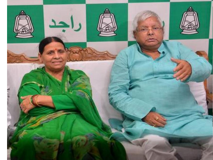
સંપૂર્ણ નિરીક્ષણ કર્યું. સૂત્રો સૂચવે છે કે લાલુ પરિવાર ટૂંક સમયમાં તેમના નવા ઘરમાં રહેવા જઈ શકે છે.

પટણા, પ્રસાદ યાદવ અને તેમના પત્ની રાબડી દેવી ફરી એકવાર હેડલાઈન્સમાં છે. લાંબા સમય પછી ૧૦ સર્ક્યુલર રોડ પરથી તેમના એક સાથે બહાર નીકળવાથી રાજકીય વર્તુળોમાં ખળભળાટ મચી ગયો. થોડા સમય પછી, એવું અહેવાલ આવ્યું કે લાલુ અને રાબડી મહુઆબાગમાં નિર્માણાધીન તેમના બંગલાનું નિરીક્ષણ કરવા માટે નીકળી ગયા છે. લાલુ સામાન્ય રીતે સ્થળની મુલાકાત લે છે. જોકે, આજે રાબડી દેવી જાતે પહોંચ્યા, નિર્માણાધીન ઘરનું