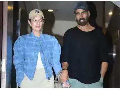
જેલી ત્યાગી તરીકે છે. સૌરભ શુક્લા, ગજરાજ રાવ, અમૃતા રાવ અને હુમા કુરેશી પણ મુખ્ય ભૂમિકાઓ ભજવે છે. આ ફિલ્મ ૧૯ સપ્ટેમ્બરના રોજ સિનેમાઘરોમાં રિલીઝ થઈ હતી. તેના પહેલા દિવસે, તેણે બોક્સ ઓફિસ પર ૧૨ કરોડની કમાણી કરી હતી. આ કલેક્શનને સરેરાશ ગણવામાં આવે છે. કાનૂની મુશ્કેલીઓ પછી, ફિલ્મ 'જેલી એલએલબી ૩' સિનેમાઘરોમાં રિલીઝ થઈ ગઈ છે. સૌરભ શુક્લા, ગજરાજ રાવ, અમૃતા રાવ અને હુમા કુરેશી પણ મુખ્ય ભૂમિકાઓ ભજવે છે. આ ફિલ્મ ૧૯ સપ્ટેમ્બરના રોજ સિનેમાઘરોમાં રિલીઝ થઈ હતી. તેના પહેલા દિવસે, તેણે બોક્સ ઓફિસ પર ૧૨ કરોડની કમાણી કરી હતી. આ કલેક્શનને સરેરાશ ગણવામાં આવે છે. કાનૂની મુશ્કેલીઓ પછી, ફિલ્મ 'જેલી એલએલબી ૩' સિનેમાઘરોમાં રિલીઝ થઈ ગઈ છે. સૌરભ શુક્લા, ગજરાજ રાવ, અમૃતા રાવ અને હુમા કુરેશી પણ મુખ્ય ભૂમિકાઓ ભજવે છે. આ ફિલ્મ ૧૯ સપ્ટેમ્બરના રોજ સિનેમાઘરોમાં રિલીઝ થઈ હતી. તેના પહેલા દિવસે, તેણે બોક્સ ઓફિસ પર ૧૨ કરોડની કમાણી કરી હતી. આ કલેક્શનને સરેરાશ ગણવામાં આવે છે. કાનૂની મુશ્કેલીઓ પછી, ફિલ્મ 'જેલી એલએલબી ૩' સિનેમાઘરોમાં રિલીઝ થઈ ગઈ છે. સૌરભ શુક્લા, ગજરાજ રાવ, અમૃતા રાવ અને હુમા કુરેશી પણ મુખ્ય ભૂમિકાઓ ભજવે છે. આ ફિલ્મ ૧૯ સપ્ટેમ્બરના રોજ સિનેમાઘરોમાં રિલીઝ થઈ હતી. તેના પહેલા દિવસે, તેણે બોક્સ ઓફિસ પર ૧૨ કરોડની કમાણી કરી હતી. આ કલેક્શનને સરેરાશ ગણવામાં આવે છે. કાનૂની મુશ્કેલીઓ પછી, ફિલ્મ 'જેલી એલએલબી ૩' સિનેમાઘરોમાં રિલીઝ થઈ ગઈ છે. સૌરભ શુક્લા, ગજરાજ રાવ, અમૃતા રાવ અને હુમા કુરેશી પણ મુખ્ય ભૂમિકાઓ ભજવે છે. આ ફિલ્મ ૧૯ સપ્ટેમ્બરના રોજ સિનેમાઘરોમાં રિલીઝ થઈ હતી. તેના પહેલા દિવસે, તેણે બોક્સ ઓફિસ પર ૧૨ કરોડની કમાણી કરી હતી. આ કલેક્શનને સરેરાશ ગણવામાં આવે છે. કાનૂની મુશ્કેલીઓ પછી, ફિલ્મ 'જેલી એલએલબી ૩' સિનેમાઘરોમાં રિલીઝ થઈ ગઈ છે. સૌરભ શુક્લા, ગજરાજ રાવ, અમૃતા રાવ અને હુમા કુરેશી પણ મુખ્ય ભૂમિકાઓ ભજવે છે. આ ફિલ્મ ૧૯ સપ્ટેમ્બરના રોજ સિનેમાઘરોમાં રિલીઝ થઈ હતી. તેના પહેલા દિવસે, તેણે બોક્સ ઓફિસ પર ૧૨ કરોડની કમાણી કરી હતી. આ કલેક્શનને સરેરાશ ગણવામાં આવે છે. કાનૂની મુશ્કેલીઓ પછી, ફિલ્મ 'જેલી એલએલબી ૩' સિનેમાઘરોમાં રિલીઝ થઈ ગઈ છે. સૌરભ શુક્લા, ગજરાજ રાવ, અમૃતા રાવ અને હુમા કુરેશી પણ મુખ્ય ભૂમિકાઓ ભજવે છે. આ ફિલ્મ ૧૯ સપ્ટેમ્બરના રોજ સિનેમાઘરોમાં રિલીઝ થઈ હતી. તેના પહેલા દિવસે, તેણે બોક્સ ઓફિસ પર ૧૨ કરોડની કમાણી કરી હતી. આ કલેક્શનને સરેરાશ ગણવામાં આવે છે. કાનૂની મુશ્કેલીઓ પછી, ફિલ્મ 'જેલી એલએલબી ૩' સિનેમાઘરોમાં રિલીઝ થઈ ગઈ છે. સૌરભ શુક્લા, ગજરાજ રાવ, અમૃતા રાવ અને હુમા કુરેશી પણ મુખ્ય ભૂમિકાઓ ભજવે છે. આ ફિલ્મ ૧૯ સપ્ટેમ્બરના રોજ સિનેમાઘરોમાં રિલીઝ થઈ હતી. તેના પહેલા દિવસે, તેણે બોક્સ ઓફિસ પર ૧૨ કરોડની કમાણી કરી હતી. આ કલેક્શનને સરેરાશ ગણવામાં આવે છે. કાનૂની મુશ્કેલીઓ પછી, ફિલ્મ 'જેલી એલએલબી ૩' સિનેમાઘરોમાં રિલીઝ થઈ ગઈ છે. સૌરભ શુક્લા, ગજરાજ રાવ, અમૃતા રાવ અને હુમા કુરેશી પણ મુખ્ય ભૂમિકાઓ ભજવે છે. આ ફિલ્મ ૧૯ સપ્ટેમ્બરના રોજ સિનેમાઘરોમાં રિલીઝ થઈ હતી. તેના પહેલા દિવસે, તેણે બોક્સ ઓફિસ પર ૧૨ કરોડની કમાણી કરી હતી. આ કલેક્શનને સરેરાશ ગણવામાં આવે છે. કાનૂની મુશ્કેલીઓ પછી, ફિલ્મ 'જેલી એલએલબી ૩' સિનેમાઘરોમાં રિલીઝ થઈ ગઈ છે. સૌરભ શુક્લા, ગજરાજ રાવ, અમૃતા રાવ અને હુમા કુરેશી પણ મુખ્ય ભૂમિકાઓ ભજવે છે. આ ફિલ્મ ૧૯ સપ્ટેમ્બરના રોજ સિનેમાઘરોમાં રિલીઝ થઈ હતી. તેના પહેલા દિવસે, તેણે બોક્સ ઓફિસ પર ૧૨ કરોડની કમાણી કરી હતી. આ કલેક્શનને સરેરાશ ગણવામાં આવે છે. કાનૂની મુશ્કેલીઓ પછી, ફિલ્મ 'જેલી એલએલબી ૩' સિનેમાઘરોમાં રિલીઝ થઈ ગઈ છે. સૌરભ શુક્લા, ગજરાજ રાવ, અમૃતા રાવ અને હુમા કુરેશી પણ મુખ્ય ભૂમિકાઓ ભજવે છે. આ ફિલ્મ ૧૯ સપ્ટેમ્બરના રોજ સિનેમાઘરોમાં રિલીઝ થઈ હતી. તેના પહેલા દિવસે, તેણે બોક્સ ઓફિસ પર ૧૨ કરોડની કમાણી કરી હતી. આ કલેક્શનને સરેરાશ ગણવામાં આવે છે. કાનૂની મુશ્કેલીઓ પછી, ફિલ્મ 'જેલી એલએલબી ૩' સિનેમાઘરોમાં રિલીઝ થઈ ગઈ છે. સૌરભ શુક્લા, ગજરાજ રાવ, અમૃતા રાવ અને હુમા કુરેશી પણ મુખ્ય ભૂમિકાઓ ભજવે છે. આ ફિલ્મ ૧૯ સપ્ટેમ્બરના રોજ સિનેમાઘરોમાં રિલીઝ થઈ હતી. તેના પહેલા દિવસે, તેણે બોક્સ ઓફિસ પર ૧૨ કરોડની કમાણી કરી હતી. આ કલેક્શનને સરેરાશ ગણવામાં આવે છે. કાનૂની મુશ્કેલીઓ પછી, ફિલ્મ 'જેલી એલએલબી ૩' સિનેમાઘરોમાં રિલીઝ થઈ ગઈ છે. સૌરભ શુક્લા, ગજરાજ રાવ, અમૃતા રાવ અને હુમા કુરેશી પણ મુખ્ય ભૂમિકાઓ ભજવે છે. આ ફિલ્મ ૧૯ સપ્ટેમ્બરના રોજ સિનેમાઘરોમાં રિલીઝ થઈ હતી. તેના પહેલા દિવસે, તેણે બોક્સ ઓફિસ પર ૧૨ કરોડની કમાણી કરી હતી. આ કલેક્શનને સરેરાશ ગણવામાં આવે છે. કાનૂની મુશ્કેલીઓ પછી, ફિલ્મ 'જેલી એલએલબી ૩' સિનેમાઘરોમાં રિલીઝ થઈ ગઈ છે. સૌરભ શુક્લા, ગજરાજ રાવ, અમૃતા રાવ અને હુમા કુરેશી પણ મુખ્ય ભૂમિકાઓ ભજવે છે. આ ફિલ્મ ૧૯ સપ્ટેમ્બરના રોજ સિનેમાઘરોમાં રિલીઝ થઈ હતી. તેના પહેલા દિવસે, તેણે બોક્સ ઓફિસ પર ૧૨ કરોડની કમાણી કરી હતી. આ કલેક્શનને સરેરાશ ગણવામાં આવે છે. કાનૂની મુશ્કેલીઓ પછી, ફિલ્મ 'જેલી એલએલબી ૩' સિનેમાઘરોમાં રિલીઝ થઈ ગઈ છે. સૌરભ શુક્લા, ગજરાજ રાવ, અમૃતા રાવ અને હુમા કુરેશી પણ મુખ્ય ભૂમિકાઓ ભજવે છે. આ ફિલ્મ ૧૯ સપ્ટેમ્બરના રોજ સિનેમાઘરોમાં રિલીઝ થઈ હતી. તેના પહેલા દિવસે, તેણે બોક્સ ઓફિસ પર ૧૨ કરોડની કમાણી કરી હતી. આ કલેક્શનને સરેરાશ ગણવામાં આવે છે. કાનૂની મુશ્કેલીઓ પછી, ફિલ્મ 'જેલી એલએલબી ૩' સિનેમાઘરોમાં રિલીઝ થઈ ગઈ છે. સૌરભ શુક્લા, ગજરાજ રાવ, અમૃતા રાવ અને હુમા કુરેશી પણ મુખ્ય ભૂમિકાઓ ભજવે છે. આ ફિલ્મ ૧૯ સપ્ટેમ્બરના રોજ સિનેમાઘરોમાં રિલીઝ થઈ હતી. તેના પહેલા દિવસે, તેણે બોક્સ ઓફિસ પર ૧૨ કરોડની કમાણી કરી હતી. આ કલેક્શનને સરેરાશ ગણવામાં આવે છે. કાનૂની મુશ્કેલીઓ પછી, ફિલ્મ 'જેલી એલએલબી ૩' સિનેમાઘરોમાં રિલીઝ થઈ ગઈ છે. સૌરભ શુક્લા, ગજરાજ રાવ, અમૃતા રાવ અને હુમા કુરેશી પણ મુખ્ય ભૂમિકાઓ ભજવે છે. આ ફિલ્મ ૧૯ સપ્ટેમ્બરના રોજ સિનેમાઘરોમાં રિલીઝ થઈ હતી. તેના પહેલા દિવસે, તેણે બોક્સ ઓફિસ પર ૧૨ કરોડની કમાણી કરી હતી. આ કલેક્શનને સરેરાશ ગણવામાં આવે છે. કાનૂની મુશ્કેલીઓ પછી, ફિલ્મ 'જેલી એલએલબી ૩' સિનેમાઘરોમાં રિલીઝ થઈ ગઈ છે. સૌરભ શુક્લા, ગજરાજ રાવ, અમૃતા રાવ અને હુમા કુરેશી પણ મુખ્ય ભૂમિકાઓ ભજવે છે. આ ફિલ્મ ૧૯ સપ્ટેમ્બરના રોજ સિનેમાઘરોમાં રિલીઝ થઈ હતી. તેના પહેલા દિવસે, તેણે બોક્સ ઓફિસ પર ૧૨ કરોડની કમાણી કરી હતી. આ કલેક્શનને સરેરાશ ગણવામાં આવે છે. કાનૂની મુશ્કેલીઓ પછી, ફિલ્મ 'જેલી એલએલબી ૩' સિનેમાઘરોમાં રિલીઝ થઈ ગઈ છે. સૌરભ શુક્લા, ગજરાજ રાવ, અમૃતા રાવ અને હુમા કુરેશી પણ મુખ્ય ભૂમિકાઓ ભજવે છે. આ ફિલ્મ ૧૯ સપ્ટેમ્બરના રોજ સિનેમાઘરોમાં રિલીઝ થઈ હતી. તેના પહેલા દિવસે, તેણે બોક્સ ઓફિસ પર ૧૨ કરોડની કમાણી કરી હતી. આ કલેક્શનને સરેરાશ ગણવામાં આવે છે. કાનૂની મુશ્કેલીઓ પછી, ફિલ્મ 'જેલી એલએલબી ૩' સિનેમાઘરોમાં રિલીઝ થઈ ગઈ છે. સૌરભ શુક્લા, ગજરાજ રાવ, અમૃતા રાવ અને હુમા કુરેશી પણ મુખ્ય ભૂમિકાઓ ભજવે છે. આ ફિલ્મ ૧૯ સપ્ટેમ્બરના રોજ સિનેમાઘરોમાં રિલીઝ થઈ હતી. તેના પહેલા દિવસે, તેણે બોક્સ ઓફિસ પર ૧૨ કરોડની કમાણી કરી હતી. આ કલેક્શનને સરેરાશ ગણવામાં આવે છે. કાનૂની મુશ્કેલીઓ પછી, ફિલ્મ 'જેલી એલએલબી ૩' સિનેમાઘરોમાં રિલીઝ થઈ ગઈ છે. સૌરભ શુક્લા, ગજરાજ રાવ, અમૃતા રાવ અને હુમા કુરેશી પણ મુખ્ય ભૂમિકાઓ ભજવે છે. આ ફિલ્મ ૧૯ સપ્ટેમ્બરના રોજ સિનેમાઘરોમાં રિલીઝ થઈ હતી. તેના પહેલા દિવસે, તેણે બોક્સ ઓફિસ પર ૧૨ કરોડની કમાણી કરી હતી. આ કલેક્શનને સરેરાશ ગણવામાં આવે છે. કાનૂની મુશ્કેલીઓ પછી, ફિલ્મ 'જેલી એલએલબી ૩' સિનેમાઘરોમાં રિલીઝ થઈ ગઈ છે. સૌરભ શુક્લા, ગજરાજ રાવ, અમૃતા રાવ અને હુમા કુરેશી પણ મુખ્ય ભૂમિકાઓ ભજવે છે. આ ફિલ્મ ૧૯ સપ્ટેમ્બરના રોજ સિનેમાઘરોમાં રિલીઝ થઈ હતી. તેના પહેલા દિવસે, તેણે બોક્સ ઓફિસ પર ૧૨ કરોડની કમાણી કરી હતી. આ કલેક્શનને સરેરાશ ગણવામાં આવે છે. કાનૂની મુશ્કેલીઓ પછી, ફિલ્મ 'જેલી એલએલબી ૩' સિનેમાઘરોમાં રિલીઝ થઈ ગઈ છે. સૌરભ શુક્લા, ગજરાજ રાવ, અમૃતા રાવ અને હુમા કુરેશી પણ મુખ્ય ભૂમિકાઓ ભજવે છે. આ ફિલ્મ ૧૯ સપ્ટેમ્બરના રોજ સિનેમાઘરોમાં રિલીઝ થઈ હતી. તેના પહેલા દિવસે, તેણે બોક્સ ઓફિસ પર ૧૨ કરોડની કમાણી કરી હતી. આ કલેક્શનને સરેરાશ ગણવામાં આવે છે. કાનૂની મુશ્કેલીઓ પછી, ફિલ્મ 'જેલી એલએલબી ૩' સિનેમાઘરોમાં રિલીઝ થઈ ગઈ છે. સૌરભ શુક્લા, ગજરાજ રાવ, અમૃતા રાવ અને હુમા કુરેશી પણ મુખ્ય ભૂમિકાઓ ભજવે છે. આ ફિલ્મ ૧૯ સપ્ટેમ્બરના રોજ સિનેમાઘરોમાં રિલીઝ થઈ હતી. તેના પહેલા દિવસે, તેણે બોક્સ ઓફિસ પર ૧૨ કરોડની કમાણી કરી હતી. આ કલેક્શનને સરેરાશ ગણવામાં આવે છે. કાનૂની મુશ્કેલીઓ પછી, ફિલ્મ 'જેલી એલએલબી ૩' સિનેમાઘરોમાં રિલીઝ થઈ ગઈ છે. સૌરભ શુક્લા, ગજરાજ રાવ, અમૃતા રાવ અને હુમા કુરેશી પણ મુખ્ય ભૂમિકાઓ ભજવે છે. આ ફિલ્મ ૧૯ સપ્ટેમ્બરના રોજ સિનેમાઘરોમાં રિલીઝ થઈ હતી. તેના પહેલા દિવસે, તેણે બોક્સ ઓફિસ પર ૧૨ કરોડની કમાણી કરી હતી. આ કલેક્શનને સરેરાશ ગણવામાં આવે છે. કાનૂની મુશ્કેલીઓ પછી, ફિલ્મ 'જેલી એલએલબી ૩' સિનેમાઘરોમાં રિલીઝ થઈ ગઈ છે. સૌરભ શુક્લા, ગજરાજ રાવ, અમૃતા રાવ અને હુમા કુરેશી પણ મુખ્ય ભૂમિકાઓ ભજવે છે. આ ફિલ્મ ૧૯ સપ્ટેમ્બરના રોજ સિનેમાઘરોમાં રિલીઝ થઈ હતી. તેના પહેલા દિવસે, તેણે બોક્સ ઓફિસ પર ૧૨ કરોડની કમાણી કરી હતી. આ કલેક્શનને સરેરાશ ગણવામાં આવે છે. કાનૂની મુશ્કેલીઓ પછી, ફિલ્મ 'જેલી એલએલબી ૩' સિનેમાઘરોમાં રિલીઝ થઈ ગઈ છે. સૌરભ શુક્લા, ગજરાજ રાવ, અમૃતા રાવ અને હુમા કુરેશી પણ મુખ્ય ભૂમિકાઓ ભજવે છે. આ ફિલ્મ ૧૯ સપ્ટેમ્બરના રોજ સિનેમાઘરોમાં રિલીઝ થઈ હતી. તેના પહેલા દિવસે, તેણે બોક્સ ઓફિસ પર ૧૨ કરોડની કમાણી કરી હતી. આ કલેક્શનને સરેરાશ ગણવામાં આવે છે. કાનૂની મુશ્કેલીઓ પછી, ફિલ્મ 'જેલી એલએલબી ૩' સિનેમાઘરોમાં રિલીઝ થઈ ગઈ છે. સૌરભ શુક્લા, ગજરાજ રાવ, અમૃતા રાવ અને હુમા કુરેશી પણ મુખ્ય ભ

અક્ષય કુમાર આ દિવસોમાં તેની ફિલ્મ 'જેલી એલએલબી ૩' માટે સમાચારમાં છે. તે તાજેતરમાં તેની પત્ની ટિવિંકલ ખન્ના સાથે મૂવી ડેટ પર ગયો હતો. તેઓએ તેની ફિલ્મ 'જેલી એલએલબી ૩' જોઈ. તેમની હાજરીથી ફિલ્મ માટે લોકોનો ઉત્સાહ વધુ વધી ગયો છે. તેમના વીડિયો સોશિયલ મીડિયા પર વાયરલ થઈ રહ્યા છે. વાયરલ વીડિયોમાં, અક્ષય કુમાર અને તેની પત્ની ટિવિંકલ ખન્ના સ્ટાઇલિશ દેખાતા હતા. તેઓ સાથે ખૂબ જ મજા માણી રહ્યા હતા. અક્ષય કુમાર મુંબઈના એક સિનેમા હોલની બહાર પાપારાટ્ટી માટે પોઝ આપતી વખતે તેની પત્નીને પ્રેમથી પકડીને જોવા મળ્યા હતા. હિટ ફ્રેન્ચાઇઝ 'જેલી એલએલબી' ના શ્રીજી ભાગમાં અક્ષય કુમાર જેલી મિશ્રા અને અરશદ વાસ્તી જેલી ત્યાગી તરીકે છે. સૌરભ શુક્લા, ગજરાજ રાવ, અમૃતા રાવ અને હુમા કુરેશી પણ મુખ્ય ભૂમિકાઓ ભજવે છે. આ ફિલ્મ ૧૯ સપ્ટેમ્બરના રોજ સિનેમાઘરોમાં રિલીઝ થઈ હતી. તેના પહેલા દિવસે, તેણે બોક્સ ઓફિસ પર ૧૨ કરોડની કમાણી કરી હતી. આ કલેક્શનને સરેરાશ ગણવામાં આવે છે. કાનૂની મુશ્કેલીઓ પછી, ફિલ્મ 'જેલી એલએલબી ૩' સિનેમાઘરોમાં રિલીઝ થઈ ગઈ છે. રિલીઝ થયા પછી, અક્ષય કુમારે ટ્વિટ કર્યું, "કેસ નંબર ૧૭૨૨ આજે સાંભળવામાં આવશે. કોર્ટમાં સુનાવણી હવે ફરી શરૂ થઈ ગઈ છે! 'જેલી એલએલબી ૩' હવે સિનેમાઘરોમાં છે. તમારી ટિકિટ બુક કરો." ફિલ્મને વિવેચકો અને દર્શકો તરફથી સકારાત્મક સમીક્ષાઓ મળી રહી છે. અમર ઉબાલાએ ફિલ્મને ૩.૫ સ્ટાર રેટિંગ આપ્યું છે. સમીક્ષકે લખ્યું, "જેલી એલએલબી ૩" મનોરંજન અને સામાજિક સંદેશનું મિશ્રણ છે. અક્ષય અને અરશદની કેમેસ્ટ્રી, સીમા બિશ્વાસનો જુસ્સાદાર અભિનય, રામ કપૂરનો મજબૂત હિમાયત અને ગજરાજ રાવનું ભ્રષ્ટ ઉદ્યોગપતિનું શક્તિશાળી શિખર આ બધું ફિલ્મ જોવા લાયક બનાવે છે.