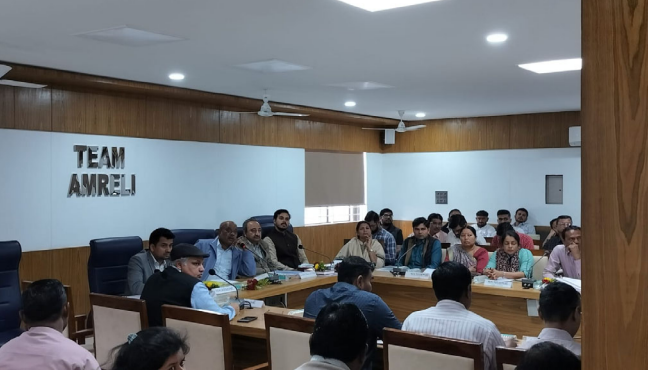
જરૂરી સૂચનાઓ અને માર્ગદર્શન પણ સાંસદશ્રીએ આપ્યું હતું. સાંસદશ્રીએ “સ્વામિત્વ યોજના” અન્વયે સમગ્ર જિલ્લામાં પ્રોપર્ટી કાર્ડ લગત કામગીરી ઝડપી ગતિએ હાથ ધરવા બાબતે સૂચનાઓ અને નિર્દેશ આપ્યા હતા. આ ઉપરાંત રેલવે, વીજળી, આધાર અપડેટ કીટ કાર્યરત બનાવવી, બી.એસ.એન.એલ નેટવર્ક સુવ્યવસ્થિત રીતે સંચાલિત બનાવવું, ગ્રામ પંચાયતો ખાતે

અમરેલી: અમરેલી સાંસદ શ્રી ભરતભાઈ સુતરિયાના અધ્યક્ષ સ્થાને જિલ્લા વિકાસ કો-ઓર્ડિનેશન અને મોનિટરિંગ કમિટી (DISHA) ની બેઠક યોજાઈ હતી. અમરેલી જિલ્લા કલેક્ટર કચેરી ખાતે યોજાયેલ આ બેઠકમાં સાંસદશ્રીએ કેન્દ્ર સરકાર સંચાલિત જનકલ્યાણકારી યોજનાઓ, અભિયાનો અને વિકાસ કાર્યો અન્વયે થયેલી કામગીરીની સર્વગ્રાહી સમીક્ષા કરી હતી. સાંસદશ્રીએ, જિલ્લામાં સામાજિક અને આર્થિક ઉત્કર્ષ માટે નાગરિકો માટે થયેલા વિકાસ કાર્યોને સરાહનીય કામગીરી ગણાવી હતી. જિલ્લામાં હજી વધુ સારા કાર્યો કરવા માટે અનુરોધ કર્યો હતો. કેન્દ્ર સરકારની યોજનાઓ અને પ્રકલ્પો વધુ પ્રભાવી રીતે નાગરિકો સુધી પહોંચે તે માટે