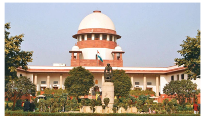
સંબંધિત બાબતોમાં નિષ્ણાત પર્યાવરણવાદીઓ અને વૈજ્ઞાનિકોના નામોની ભલામણ કરીને ઉચ્ચ સ્તરીય નિષ્ણાત સમિતિની રચના કરવાનો નિર્દેશ આપ્યો હતો. આ સમિતિ સુપ્રીમ કોર્ટની દેખરેખ અને માર્ગદર્શન હેઠળ કાર્ય કરશે.

જયપુર, સુપ્રીમ કોર્ટે અરવલ્લી પર્વતમાળામાં ગેરકાયદેસર ખાણકામ પર ગંભીર ચિંતા વ્યક્ત કરી છે, અને કહ્યું છે કે તેનાથી પર્યાવરણને ન ભરવાપાત્ર નુકસાન થઈ શકે છે. આ મુદ્દા પર કડક વલણ અપનાવતા, કોર્ટે અરવલ્લી પ્રદેશમાં ખાણકામ અને તેના સંબંધિત તમામ પાસાઓની વ્યાપક તપાસ કરવા માટે એક નિષ્ણાત સમિતિની રચના કરવાનો નિર્ણય લીધો છે. મુખ્ય ન્યાયાધીશ સૂર્યકાંત, ન્યાયાધીશ જ્યોત્સના કાપડિયા અને વિપુલ એમ. પંચોલીની બનેલી બેન્ચે જણાવ્યું હતું કે અરવલ્લી પ્રદેશ જેવા