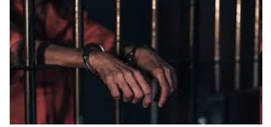
ઉભો કરનાર કોઈપણને ૧,૦૦૦ રૂપિયા સુધીનો દંડ અને ત્રણ વર્ષ સુધીની જેલ થઈ શકે છે.

યુપી સરકારે જાહેરનામું બહાર પાડ્યું વિભાગીય સ્તરથી તહસીલ સ્તર સુધીના અધિકારીઓની જવાબદારી સ્થાપિત કરવામાં આવી