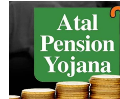
યોજના માટે સરકારી સહાય ચાલુ રહેશે. આમાં પ્રમોશનલ, ક્ષમતા નિર્માણ અને વિકાસ પ્રવૃત્તિઓ માટે ભંડોળનો સમાવેશ થાય છે. યોજનાની નાણાકીય ટકાઉપણું સુનિશ્ચિત કરવા માટે ગેપ ફંડિંગને પણ મંજૂરી આપવામાં આવી

નવીદિલ્હી, મોદી સરકારે અટલ પેન્શન યોજના (એપીવાય) અંગે એક મહત્વપૂર્ણ નિર્ણય લીધો છે, જે લાખો અસંગઠિત અને ઓછી આવક ધરાવતા કામદારોને નોંધપાત્ર રાહત આપે છે. ભુધવારે વડા પ્રધાન નરેન્દ્ર મોદીની અધ્યક્ષતામાં કેન્દ્રીય મંત્રીમંડળે ૨૦૩૦-૩૧ સુધી આ યોજના ચાલુ રાખવાની મંજૂરી આપી હતી. આ નિર્ણયનો સીધો લાભ એવા કામદારોને થશે જેમની પાસે નિવૃત્તિ પછી નિયમિત આવકનો સ્રોત નથી. સરકારના આ પગલાને વૃદ્ધાવસ્થામાં નાણાકીય સુરક્ષાને મજબૂત બનાવવાની દિશામાં એક મોટું પગલું માનવામાં આવી રહ્યું છે. મંત્રીમંડળના નિર્ણય હેઠળ, અટલ પેન્શન