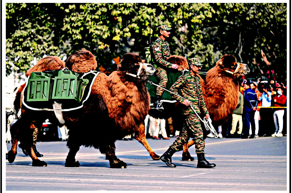
ભારતમાં પ્રજાસત્તાક પર્વની ઉજવણી માટેની તૈયારી શરૂ થઈ ગઈ છે. આ ઉજવણી અંતર્ગત ભારત રિમાઉન્ટ વેટરનરી કોર્પ્સ પ્રજાસત્તાક દિવસની પરેડ માટે રિહર્સલ દરમિયાન તેમના બેક્ટ્રીયન ઊંટોને ચાલવા લઈ જાય છે.

અમેરિકન પ્રમુખ ડોનાલ્ડ ટ્રમ્પ પોતાની નીતિઓ અને આક્રમક અંદાજને કારણે હંમેશા ચર્ચામાં રહે છે. તાજેતરમાં સ્વિટ્ઝર્લેન્ડના દાવોસમાં આયોજિત વર્લ્ડ ઇકોનોમિક ફોરમમાં ટ્રમ્પે એક એવું નિવેદન આપ્યું છે જેનાથી વૈશ્વિક સ્તરે ફરી ચર્ચાઓ જાગી છે. પોતાની ટીકાઓનો જવાબ આપતા ટ્રમ્પે સ્વીકાર્યું કે લોકો તેમને 'તાનાશાહ' ગણાવે છે. વર્લ્ડ ઇકોનોમિક ફોરમને સંબોધિત કર્યા બાદ ટ્રમ્પે તેમના ભાષણ પર મળેલી પ્રતિક્રિયાઓ વિશે વાત કરી હતી. તેમણે કહ્યું કે, 'મેં એક સારું ભાષણ આપ્યું અને મને તેના ખૂબ સારા રિવ્યૂ મળ્યા છે, જેનો મને પણ વિશ્વાસ નથી આવી રહ્યો.' તાના પર લાગતા સરમુખત્યારશાહીના આરોપો અંગે ખુલાસો કરતા ટ્રમ્પે કહ્યું કે, 'સામાન્ય રીતે લોકો કહે છે કે આ વ્યક્તિ એક ભયાનક તાનાશાહ જેવો છે. હા, હું એક તાનાશાહ છું, પરંતુ ક્યારેક તમારે એક સરમુખત્યારની જરૂર હોય છે.' ટ્રમ્પે સ્પષ્ટતા કરી હતી કે, તેમના નિર્ણયો કોઈ ચોક્કસ રૂઢિચુસ્ત કે ઉદારવાદી વિચારધારાથી પ્રેરિત હોતા નથી. તેમણે ભારપૂર્વક જણાવ્યું કે મારા ૯૫% નિર્ણયો માત્ર 'કોમન સેન્સ' (સામાન્ય બુદ્ધિ) પર આધારિત હોય છે અને વ્યવહારિકતા જ સૌથી મહત્વની બાબત છે.