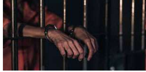
ઊભો કરનાર કોઈપણને ૧,૦૦૦ રૂપિયા સુધીનો દંડ અને ત્રણ વર્ષ સુધીની જેલ થઈ શકે છે.

યુપી સરકારે જાહેરનામું બહાર પાડ્યું વિભાગીય સ્તરથી તહસીલ સ્તર સુધીના અધિકારીઓની જવાબદારી સ્થાપિત કરવામાં આવી