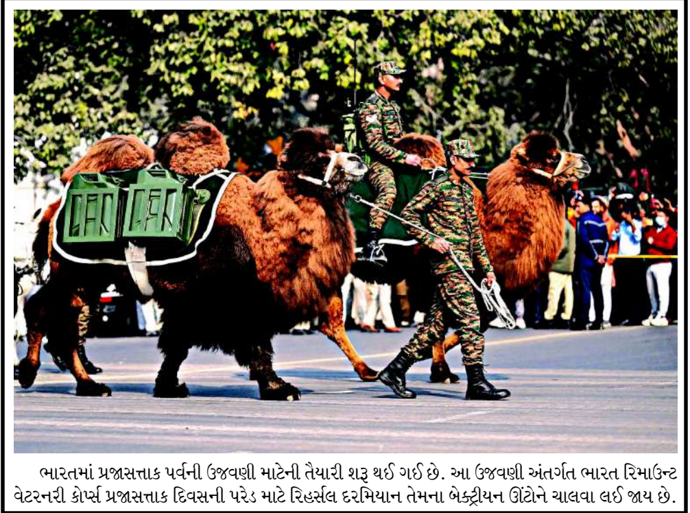
ભારતમાં પ્રજાસત્તાક પર્વની ઉજવણી માટેની તૈયારી શરૂ થઈ ગઈ છે. આ ઉજવણી અંતર્ગત ભારત રિમાઉન્ટ વેટરનરી કોર્પ્સ પ્રજાસત્તાક દિવસની પરેડ માટે રિહર્સલ દરમિયાન તેમના બેક્ટ્રીયન ઊંટોને ચાલવા લઈ જાય છે.

અમેરિકન પ્રમુખ ડોનાલ્ડ ટ્રમ્પ પોતાની નીતિઓ અને આક્રમક અંદાજને કારણે હંમેશા ચર્ચામાં રહે છે. તાજેતરમાં સ્વિટ્ઝર્લેન્ડના દાવોસમાં આયોજિત વર્લ્ડ ઈકોનોમિક ફોરમમાં ટ્રમ્પે એક એવું નિવેદન આપ્યું છે જેનાથી વૈશ્વિક સ્તરે ફરી ચર્ચાઓ જાગી છે. પોતાની ટીકાઓનો જવાબ આપતા ટ્રમ્પે સ્વીકાર્યું કે લોકો તેમને 'તાનાશાહ' ગણાવે છે. વર્લ્ડ ઈકોનોમિક ફોરમને સંબોધિત કર્યા બાદ ટ્રમ્પે તેમના ભાષણ પર મળેલી પ્રતિક્રિયાઓ વિશે વાત કરી હતી. તેમણે કહ્યું કે, 'મેં એક સારું ભાષણ આપ્યું અને મને તેના ખૂબ સારા રિવ્યૂ મળ્યા છે, જેનો મને પણ વિશ્વાસ નથી આવી રહ્યો.' તાના પર લાગતા સરમુખત્યારશાહીના આરોપો અંગે ખુલાસો કરતા ટ્રમ્પે કહ્યું કે, 'સામાન્ય રીતે લોકો કહે છે કે આ વ્યક્તિ એક ભયાનક તાનાશાહ જેવો છે. હા, હું એક તાનાશાહ છું, પરંતુ ક્યારેક તમારે એક સરમુખત્યારની જરૂર હોય છે.' ટ્રમ્પે સ્પષ્ટતા કરી હતી કે, તેમના નિર્ણયો કોઈ ચોક્કસ રૂઢિચુસ્ત કે ઉદારવાદી વિચારધારાથી પ્રેરિત હોતા નથી. તેમણે ભારપૂર્વક જણાવ્યું કે મારા ૯૫% નિર્ણયો માત્ર 'કોમન સેન્સ' (સામાન્ય બુદ્ધિ) પર આધારિત હોય છે અને વ્યવહારિકતા જ સૌથી મહત્વની બાબત છે.