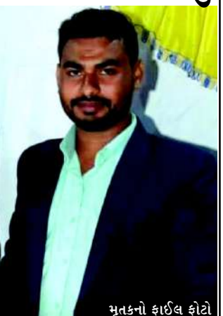
મૃતકનો ફાઇલ ફોટો

દારકા : દારકામાં ઈલેક્ટ્રિક કામ દરમિયાન લોખંડનો સળિયો યુવાનના છાતીના ભાગે ધૂસી જતા તેનું મૃત્યુ નિપજતા પરિવારમાં ભારે કષ્ટતા પ્રસરી ગઈ છે. આ બનાવની જાણ થતા સ્થાનિક પોલીસે સ્થળ પર દોડી જઈ આગળની તપાસ હાથ ધરી હતી.