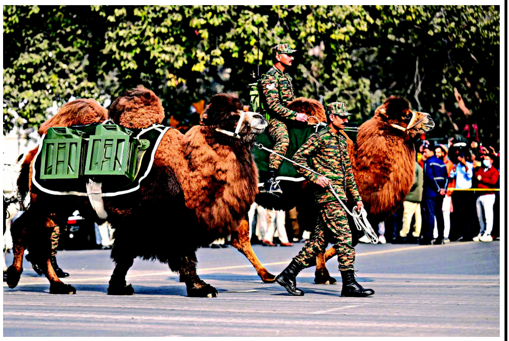
ભારતમાં પ્રજાસત્તાક પર્વની ઉજવણી માટેની તૈયારી શરૂ થઈ ગઈ છે. આ ઉજવણી અંતર્ગત ભારત રિમાઉન્ટ વેટરનરી કોર્પ્સ પ્રજાસત્તાક દિવસની પરેડ માટે રિહર્સલ દરમિયાન તેમના બેક્ટ્રીયન ઊંટોને ચાલવા લઈ જાય છે.

અમેરિકાના આર્થિક વિકાસ અંગે ડોનાલ્ડ ટ્રમ્પે જણાવ્યું કે, અમેરિકા આ દુનિયાનું આર્થિક એન્જિન છે, જ્યારે અમેરિકામાં આર્થિક ઉછાળો આવે છે, તો સમગ્ર વિશ્વમાં ઉછાળો આવે છે. આ ઇતિહાસ છે. જ્યારે આર્થિક મંદી આવે છે, ત્યારે આ સૌ તેનું અનુસરણ કરીએ છીએ. આજે બપોરે, હું આ વાત પર ચર્ચા કરવા ઇચ્છું છું કે અમે આ આર્થિક ચમત્કાર કેવી રીતે કર્યો, અમે અમારા નાગરિકોના જીવનસ્તરને અભૂતપૂર્વ સ્તર સુધી કેવી રીતે લઈ જવાનો ઇરાદો રાખીએ છીએ અને તમે પણ અને તમારા વિસ્તારમાં પણ અમારા કાર્યોનું અનુસરણ કરીને વધુ સારું કરી શકો છો."