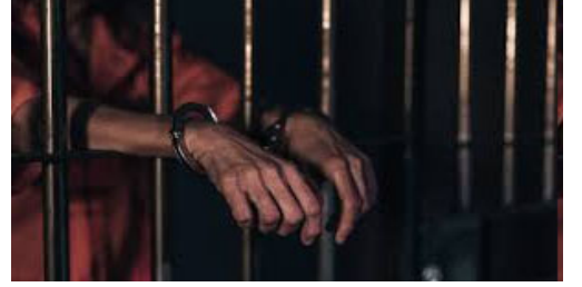
ઉભો કરનાર કોઈપણને ૧,૦૦૦ રૂપિયા સુધીનો દંડ અને ત્રણ વર્ષ સુધીની જેલ થઈ શકે છે.

યુપી સરકારે જાહેરનામું બહાર પાડ્યું વિભાગીય સ્તરથી તહસીલ સ્તર સુધીના અધિકારીઓની જવાબદારી સ્થાપિત કરવામાં આવી