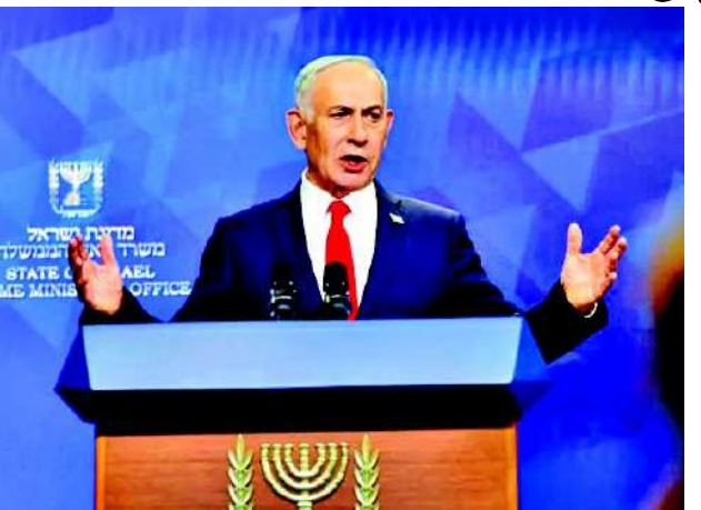
ઈઝરાયેલ અને અમેરિકાના સંબંધો અંગે નેતન્યાહુએ આપ્યું નિવેદન

વચ્ચે ચાલી રહેલા રાજદ્વારી ગજગાહની વચ્ચે એક મોટા સમાચાર સામે આવ્યા છે. ઈરાનની સત્તાવાર ન્યૂઝ એજન્સીના અહેવાલ અનુસાર, બંને દેશો વચ્ચે સતત ૧૮ કલાક સુધી મેરેથોન બેઠક યોજાઈ હતી. આ વાટાઘાટોમાં કતાર અને પાકિસ્તાને મધ્યસ્થ તરીકેની મુખ્ય ભૂમિકા ભજવી છે. ઈરાનના વિદેશ મંત્રાલયના પ્રવક્તાએ સ્પષ્ટ