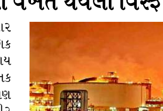
ટર્મિનલ ફરીથી શરૂ કરી રહ્યા હતા. ઈરાને કરેલા બોમ્બમારા અને સ્ટ્રેટ ઓફ હોર્મુઝ બંધ કરી દેવાને કારણે કતાર બહારના દેશોને ગેસ મોકલી શકતું ન હતું, જેથી કતારે ગેસનું ઉત્પાદન બંધ કરવું પડ્યું હતું. જોકે, યુદ્ધનો કાયમી અંત લાવવા માટે ચાલી રહેલી શાંતિ

કતારના પ્રખ્યાત રસ લાફાન ઔદ્યોગિક વિસ્તારમાં આવેલા બરજાન ગેસ સંવાય પ્લાન્ટમાં રવિવારે મોડી રાત્રે એક ભયાનક વિસ્ફોટ થયો હતો, જેના કારણે ત્યાં ભીષણ આગ લાગી ગઈ હતી. આ ગંભીર અકસ્માતમાં આશરે ૫૪ કર્મચારીઓ ઘાયલ થયા છે, જ્યારે અન્ય ૧૮ કર્મચારીઓ હજી પણ ગુમ છે. આ અકસ્માતને કારણે વૈશ્વિક ઊર્જા બજારમાં મોટો આંચકો લાગવાની આશંકા સેવાઈ રહી છે. વાસ્તવમાં આ અકસ્માત ત્યારે થયો જ્યારે કર્મચારીઓ ગેસ