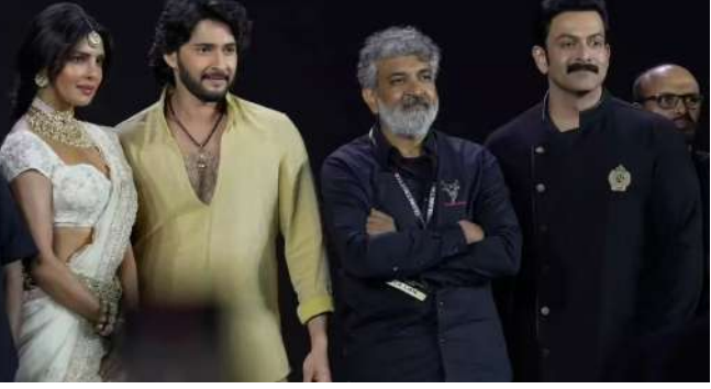
કરતા ઘણી અલગ હોય છે. વારાણસી' ફિલ્મનો પહેલે શેડ્યુલ શુટ થવાનો છે. આ ફિલ્મ આવતા વર્ષે રિલીઝ થવાની છે. દમદાર સેટ અને એકથી એક ચરિત્રાત્મક ડાયલોગથી ફિલ્મે કેન્સનો ઉત્સાહ અત્યારથી વધારી દીધો છે. પ્રિયંકા ચોપરા આ ફિલ્મમાં મંદાકિનીનું પાત્ર પ્લે કરી રહી છે. આ ફિલ્મને લઈને તેનો લુક પણ થોડા સમય પહેલા વાયરલ થયો હતો. રૂદ્રના રૂપમાં મહેશબાબુ, હુંભાના રૂપમાં પૃથ્વીરાજ

મુંબઈ, 'બાહુબલી' ફિલ્મના બન્ને ભાગે દમદાર સફળતા મેળવી છે. માત્ર ભારત જ નહી વર્લ્ડવાઈડ જોરદાર કલેક્શન કરતા ફિલ્મની સફળતા પુરવાર થઈ હતી. હવે ફિલ્મ ડાયરેક્ટર રાજામૌલી વધુ એક મોટાબજેટની ફિલ્મ લઈને આવી રહ્યા છે. આ ફિલ્મથી પ્રિયંકા ચોપરાનું ફિલ્મમાં કમબેક થવાનું છે, એક લાંબા બ્રેકબાદ તે મોટી સ્ક્રિન પર દેખાવવાની છે. ફિલ્મ 'વારાણસી'નું શૂટિંગ શરૂ થઈ ગયું છે. આ ફિલ્મના શેડ્યુલ પણ નક્કી થઈ ગયા છે. આ ફિલ્મ પણ ઓટબલ બ્લોકબસ્ટર થશે એવું એટલા માટે કહી શકાય કારણે રાજામૌલીની વાર્તા બાકીની ફિલ્મો