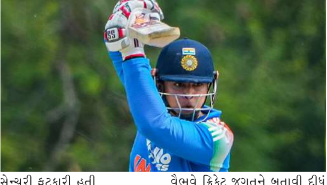
સેન્યુરી ફટકારી હતી. વૈભવએ આ સાથે શ્રીલંકા-એ ટીમને થોડા દિવસ પહેલાંના એના અપશબ્દોવાળા ગંભીર ગેરવર્તનનો વીરરત્નેએ ૧૨ બોલમાં હાફ કરતા ઘણી અલગ હોય છે. વારાણસી' ફિલ્મનો પહેલે શેડ્યુલ શુટ થવાનો છે. આ ફિલ્મ આવતા વર્ષે રિલીઝ થવાની છે. દમદાર સેટ અને એકથી એક ચરિત્રાત્મક ડાયલોગથી ફિલ્મે કેન્સનો ઉત્સાહ અત્યારથી વધારી દીધો છે. પ્રિયંકા ચોપરા આ ફિલ્મમાં મંદાકિનીનું પાત્ર પ્લે કરી રહી છે. આ ફિલ્મને લઈને તેનો લુક પણ થોડા સમય પહેલા વાયરલ થયો હતો. રૂદ્રના રૂપમાં મહેશબાબુ, હુંભાના રૂપમાં પૃથ્વીરાજ

દમ્બુલા, માત્ર ૧૫ વર્ષના વૈભવ સૂર્યવંશી (૯૪ રન, ૨૯ બોલ, આઠ છગ્ગા, દસ ચોગ્ગા)એ અહીં ટ્રાયેગ્યુલર વન-ડે ટૂર્નામેન્ટની ફાઈનલમાં ઈન્ડિયા-એ વતી ધમાકેદાર બેટિંગ કરી છે. તેણે ફક્ત ૧૧ બોલમાં હાફ સેન્યુરી ફટકારીને લિસ્ટ-એ પ્રકારની ક્રિકેટમાં નવો વિશ્વિક્રમ સ્થાપિત કર્યો છે. તેણે શ્રીલંકાના જ ખેલાડીનો ફાસ્ટેસ્ટ ફિફ્ટીનો વિશ્વ વિક્રમ તોડ્યો છે. ભૂતપૂર્વ શ્રીલંકન બેટ્સમેન વીરરત્નેએ ૧૨ બોલમાં હાફ