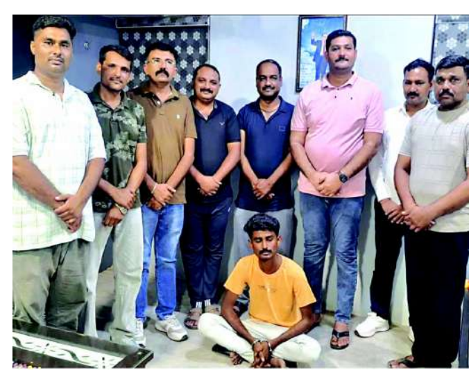
મોટરસાયકલ અને હથિયાર સાથે પાલીતાણા રોડ, ગારીયાધાર સીમ વિસ્તારમાં ઉભો છે અને ત્યાંથી નાસી જવાની ફિરાકમાં છે. બાતમીના આધારે પોલીસે ત્વરિત

ભાવનગર, તા. ૨૨ ભાવનગર જિલ્લાના ગારીયાધારના મફતપરા વિસ્તારમાં પત્નીની ઘાતકી હત્યા કરી નાસી છૂટેલા આરોપી પતિને ગારીયાધાર પોલીસે ગણતરીના કલાકોમાં જ હથિયાર સાથે દબોચી લીધો હતો. ભાવનગર જિલ્લા પોલીસ અધિક્ષક નિતેશ પાંડેય, પોલીસ મહાનિરીક્ષક રાજેન્દ્ર અસારી તથા નાયબ પોલીસ અધિક્ષક મિહિર બારીયાના માર્ગદર્શન હેઠળ ગારીયાધાર પોલીસ સ્ટેશનના પી.આઈ. આર.ડી. રબારી દ્વારા આરોપીને પકડવા માટે ત્રણ અલગ-અલગ ટીમો બનાવવામાં આવી હતી. આ દરમિયાન પોલીસને ખાનગી રાહે ચોક્કસ બાતમી મળી હતી કે, આરોપી પોતાના