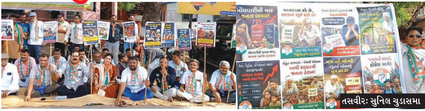
વધી રહેલી મોંઘવારીના કારણે સામાન્ય અને મધ્યમવર્ગીય પરિવારો પર આર્થિક બોજ વધી રહ્યો છે. ખેડૂતોને ખાતર, બિયારણ અને ખેતી ખર્ચમાં વધારો સહન કરવો પડી રહ્યો છે, જ્યારે પેપર લીકની ઘટનાઓના કારણે યુવાનોના ભવિષ્ય સાથે ચેડું થઈ રહ્યું છે. કોંગ્રેસના આગેવાનોએ સરકાર પર જનતાના પ્રશ્નો પ્રત્યે ઉદાસીનતા દાખવવાનો આક્ષેપ કરી યુવાનો, ખેડૂતો, વેપારીઓ અને શ્રમિકોના પ્રશ્નોના ઉકેલ માટે અસરકારક પગલાં

સૂત્રોચ્ચાર કરાયા જામનગર : જામનગર જિલ્લા કોંગ્રેસ સમિતિ દ્વારા શનિવારે લાલ બંગલા ખાતે મોંઘવારી, બેરોજગારી, પેપર લીક કોબાંડો, ખેડૂતોના પ્રશ્નો તથા કાયદો અને વ્યવસ્થાની સ્થિતિને લઈને જનઆક્રોશ વિરોધ પ્રદર્શન યોજવામાં આવ્યું હતું. આ કાર્યક્રમમાં કોંગ્રેસના આગેવાનો અને કાર્યકરોએ સરકારની નીતિઓ સામે વિરોધ વ્યક્ત કરી વિવિધ પ્રશ્નોના તાત્કાલિક ઉકેલની માંગ કરી હતી. વક્તાઓએ જણાવ્યું હતું કે સતત