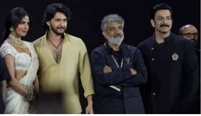
કરતા ઘણી અલગ હોય છે. વારાણસી' ફિલ્મનો પહેલે શેડ્યુલ શુટ થવાનો છે. આ ફિલ્મ આવતા વર્ષે રિલીઝ થવાની છે. દમદાર સેટ અને એકથી એક ચરિત્રાત્મા ડાયલોગથી ફિલ્મે કેન્સનો ઉત્સાહ અત્યારથી વધારી દીધો છે. પ્રિયંકા ચોપરા આ ફિલ્મમાં મંદાકિનીનું પાત્ર પ્લે કરી રહી છે. આ ફિલ્મને લઈને તેનો લુક પણ થોડા સમય પહેલા વાયરલ થયો હતો. રૂદ્રના રૂપમાં મહેશબાબુ, હુંભાના રૂપમાં પૃથ્વીરાજ

મુંબઈ, 'બાહુબલી' ફિલ્મના બન્ને ભાગે દમદાર સફળતા મેળવી છે. માત્ર ભારત જ નહી વર્લ્ડવાઈડ જોરદાર કલેક્શન કરતા ફિલ્મની સફળતા પુરવાર થઈ હતી. હવે ફિલ્મ ડાયરેક્ટર રાજામૌલી વધુ એક મોટાબજેટની ફિલ્મ લઈને આવી રહ્યા છે. આ ફિલ્મથી પ્રિયંકા ચોપરાનું ફિલ્મમાં કમબેક થવાનું છે, એક લાંબા બ્રેકબાદ તે મોટી સ્ક્રિન પર દેખાવવાની છે. ફિલ્મ 'વારાણસી'નું શૂટિંગ શરૂ થઈ ગયું છે. આ ફિલ્મના શેડ્યુલ પણ નક્કી થઈ ગયા છે. આ ફિલ્મ પણ ઓટબલ બ્લોકબસ્ટર થશે એવું એટલા માટે કહી શકાય કારણે રાજામૌલીની વાર્તા બાકીની ફિલ્મો