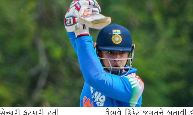
સેન્યુરી ફટકારી હતી. વૈભવએ આ સાથે શ્રીલંકા-એ ટીમને થોડા દિવસ પહેલાંના એના અપશબ્દોવાળા ગંભીર ગેરવર્તનનો વીરરત્નેએ ૧૨ બોલમાં હાફ કરતા ઘણી અલગ હોય છે. વારાણસી' ફિલ્મનો પહેલે શેડ્યુલ શુટ થવાનો છે. આ ફિલ્મ આવતા વર્ષે રિલીઝ થવાની છે. દમદાર સેટ અને એકથી એક ચરિત્રાત્મા ડાયલોગથી ફિલ્મે કેન્સનો ઉત્સાહ અત્યારથી વધારી દીધો છે. પ્રિયંકા ચોપરા આ ફિલ્મમાં મંદાકિનીનું પાત્ર પ્લે કરી રહી છે. આ ફિલ્મને લઈને તેનો લુક પણ થોડા સમય પહેલા વાયરલ થયો હતો. રૂદ્રના રૂપમાં મહેશબાબુ, હુંભાના રૂપમાં પૃથ્વીરાજ

દમ્બુલા, માત્ર ૧૫ વર્ષના વૈભવ સૂર્યવંશી (૯૪ રન, ૨૯ બોલ, આઠ છગ્ગા, દસ ચોગ્ગા)એ અહીં ટ્રાયેગ્યુલર વન-ડે ટૂર્નામેન્ટની ફાઈનલમાં ઈન્ડિયા-એ વતી ધમાકેદાર બેટિંગ કરી છે. તેણે ફક્ત ૧૧ બોલમાં હાફ સેન્યુરી ફટકારીને લિસ્ટ-એ પ્રકારની ક્રિકેટમાં નવો વિશ્વિક્રમ સ્થાપિત કર્યો છે. તેણે શ્રીલંકાના જ ખેલાડીનો ફાસ્ટેસ્ટ ફિફ્ટીનો વિશ્વ વિક્રમ તોડ્યો છે. ભૂતપૂર્વ શ્રીલંકન બેટ્સમેન વીરરત્નેએ ૧૨ બોલમાં હાફ