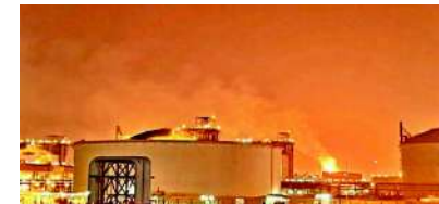
ટર્મિનલ ફરીથી શરૂ કરી રહ્યા હતા. ઈરાને કરેલા બોમ્બમારા અને સ્ટ્રેટ ઓફ હોર્મુઝ બંધ કરી દેવાને કારણે કતાર બહારના દેશોને ગેસ મોકલી શકતું ન હતું, જેથી કતારે ગેસનું ઉત્પાદન બંધ કરવું પડ્યું હતું. જો કે, યુદ્ધનો કાયમી અંત લાવવા માટે ચાલી રહેલી શાંતિ

કતારના પ્રખ્યાત રસ લાફાન ઔદ્યોગિક વિસ્તારમાં આવેલા બરજાન ગેસ સપ્લાય પ્લાન્ટમાં રવિવારે મોડી રાત્રે એક ભયાનક વિસ્ફોટ થયો હતો, જેના કારણે ત્યાં ભીષણ આગ લાગી ગઈ હતી. આ ગંભીર અકસ્માતમાં આશરે ૫૪ કર્મચારીઓ ઘાયલ થયા છે, જ્યારે અન્ય ૧૮ કર્મચારીઓ હજી પુલ્કાયેલા છે. આ અકસ્માતને કારણે વૈશ્વિક આંકડા ઊપાવવાનો ગંભીર આરોપ લગાવ્યો હતો. જો કે, તેમણે પોતે સ્વીકાર્યું પણ હતું કે છેલ્લા એક વર્ષમાં થયેલા ઘટનાક્રમો અંગે તેમની પાસે કોઈ સચોટ કે વર્તમાન