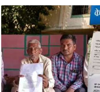
અન્ય વ્યક્તિઓના આધારકર્ડ અને ઓળખ સંબંધિત દસ્તાવેજો જોડીને લોન મંજૂર કરાઈ હોવાનો આક્ષેપ છે. ત્યારબાદ આ લોનની રકમ અન્ય લોકો દ્વારા ઉપાડી લેવામાં આવી હોવાનું પણ જણવાઈ રહ્યું છે. પ્રાથમિક તપાસમાં એવી પણ વિગતો સામે આવી છે કે જમીનના મૂળ માલિક અને લોનની રકમ મેળવનાર વ્યક્તિ અલગ હોઈ શકે

મહીસાગર, મહીસાગર જિલ્લામાં કેનેરા બેંક સાથે જોડાયેલા એક કથિત લોન કૌભાંડનો પર્દાફાશ થતાં ચક્રચાર મચી ગઈ છે. પ્રાથમિક માહિતી મુજબ, કેટલાક ખેડૂતો અને તેમના પરિવારજનોની જાણ બહાર તેમના નામે લોન મંજૂર કરવામાં આવી હોવાના ગંભીર આક્ષેપો સામે આવ્યા છે. ખાસ કરીને કેટલાક મૃતક વ્યક્તિઓના નામે પણ લોન લેવામાં આવી હોવાનું સામે આવતા સમગ્ર મામલો ચર્ચાનું કેન્દ્ર બન્યો છે.