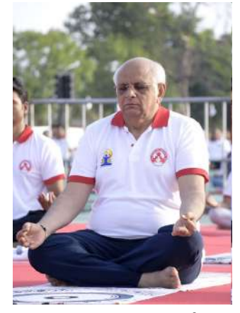
સમગ્ર ગુજરાતમાં ૩૩૦થી વધુ સ્થળોએ સવા કરોડથી વધુ લોકો સામુદાયિક યોગમાં જોડાયા છે. મુખ્યમંત્રીએ ગૌરવપૂર્વક જણાવ્યું કે ગુજરાત યોગ ક્ષેત્રે

ગયો છે. આ સાથે જ પર્યાવરણ સુરક્ષા માટે 'એક પેડ માં કે નામ', 'કેચ ધ રેઈન' અને સોલાર એનર્જી દ્વારા ઝીન-ક્લીન ઊર્જાનો અભિગમ તેમજ રસાયણમુક્ત પ્રાકૃતિક ખેતી તેમજ 'મિશન લાઈફ' દ્વારા પર્યાવરણ સાથે સંતુલિત જીવન જીવવાનો માર્ગ પણ વડાપ્રધાનશ્રીએ બતાવ્યો છે. મુખ્યમંત્રીએ ભારપૂર્વક જણાવ્યું હતું કે, આજના તણાવપૂર્ણ જીવનમાં બ્લડ પ્રેશર, ડાયાબિટીસ અને હૃદયરોગ જેવા ગંભીર રોગો સામે યોગ એ સ્વાસ્થ્યપ્રદ જીવનનો સૌથી સરળ અને સચોટ માર્ગ છે. આ વર્ષની થીમ 'યોગ ફોર હેલ્થી એજિંગ' છે. રાજ્યમાં વિવિધ સ્થળે આજના ૧૨મા વિશ્વ યોગ દિવસે