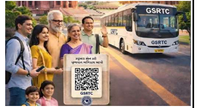
જીએસઆરટીસીના ૧ માર્ચથી ૧૯ જૂન, ૨૦૨૬ સુધીના પેસેન્જર ફીડબેક રિપોર્ટ મુજબ નિગમ પાંચથી ૪.૭ સ્ટારનું મજબૂત મુસાફર સંતોષ રેટિંગ પ્રાપ્ત કર્યું છે. આ અહેવાલ ૩,૧૩,૮૨૪ મુસાફરો પાસેથી પ્રાપ્ત થયેલા પ્રતિસાદ પર આધારિત છે, જે વિવિધ કામગીરીના માપદંડો પર નિગમની સેવાઓ પ્રત્યે ઊંચો સંતોષ દર્શાવે છે. નાયબ મુખ્યમંત્રી હર્ષ સંઘવીએ જણાવ્યું હતું કે, જીએસઆરટીસી માત્ર ફીડબેક એકત્રિત કરતી નથી, પરંતુ તેના આધારે સક્રિય રીતે કાર્યવાહી પણ કરે છે.

પરંતુ તેમાં સારો પ્રતિસાદ મળતા હવે જીએસઆરટીસીએ તેને વ્યાપક સ્તરે અમલમાં મૂકી છે. હાલમાં રાજ્યના ૧૨૫ બસ સ્ટેશન, ૩૫૦ કંટ્રોલ પોઈન્ટ્સ તેમજ ૮,૦૦૦થી વધુ બસોમાં ઊર્થ કોડ લગાવવામાં આવ્યા છે. આ સિસ્ટમ દ્વારા પ્રાપ્ત થયેલા પ્રતિસાદ અનુસાર મુસાફરોએ જીએસઆરટીસીની સેવાઓ પ્રત્યે ઊંચો સંતોષ વ્યક્ત કર્યો છે. પાંચ સ્ટારના માપદંડ પર આપવામાં આવેલા રેટિંગ્સ દર્શાવે છે કે મુસાફરો સેવાના વિવિધ પાસાઓથી ખુશ છે અને નિગમ દ્વારા મુસાફરીના અનુભવને વધુ સારો બનાવવા માટે કરવામાં આવેલા પ્રયાસોને સકારાત્મક પ્રતિસાદ મળ્યો