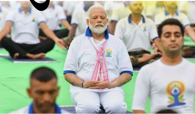
રાષ્ટ્રપતિ દ્રૌપદી મુર્મુએ રવિવારે જબલપુરમાં આંતરરાષ્ટ્રીય યોગ દિવસ નિમિત્તે આયોજિત મુખ્ય કાર્યક્રમનું નેતૃત્વ કર્યું હતું અને યોગ કર્યા હતા.

સ્થળોએ ઉજવણીનું નેતૃત્વ કર્યું છે. એક સત્તાવાર નિવેદન અનુસાર, વિશ્વભરમાં લગભગ ૨,૫૦૦ સ્થળોએ યોગ દિવસની ઉજવણીનું આયોજન કરવામાં આવ્યું જેમાં ૨૧૦ થી વધુ ભારતીય મિશન અને પોસ્ટલ ભાગ લીધો, જે યોગને સ્વાસ્થ્ય, સંવાદિતા અને સામુહિક સુખાકારી માટે વૈશ્વિક ચળવળ તરીકેની સ્થિતિને પુષ્ટિ આપે છે.