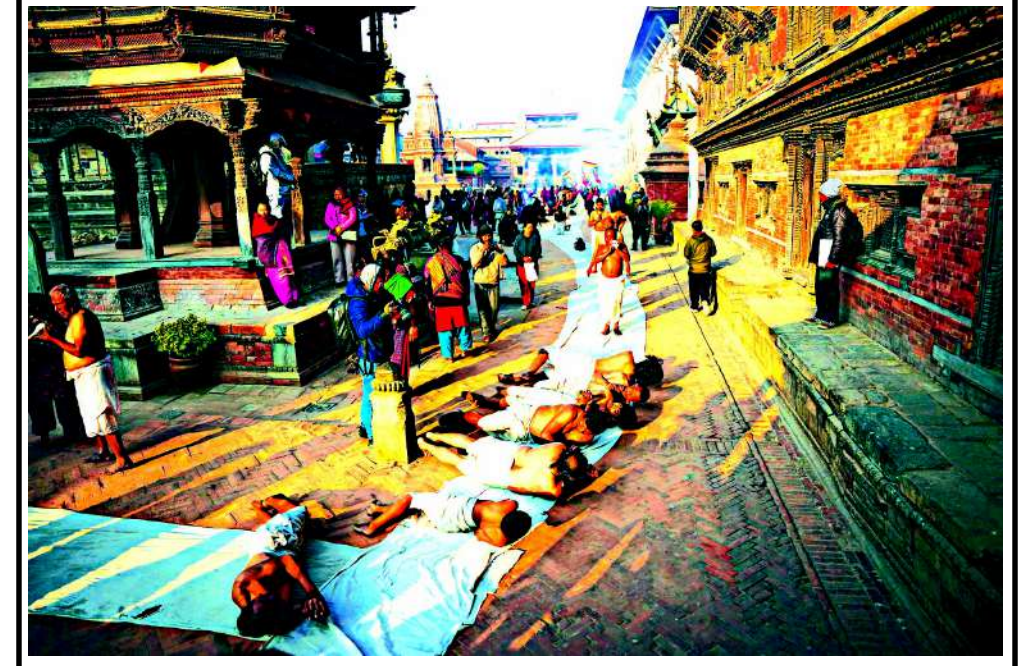
નેપાળના ભક્તપુરમાં સ્વસ્થાની ભૂત કથા ઉત્સવ દરમિયાન હિન્દુ ભક્તો પ્રાર્થના કરી રહેલા જોવા મળે છે. ભગવાન માધવ નારાયણ અને દેવી સ્વસ્થાનીને સમર્પિત એક મહિના સુધી ચાલનારા આ ઉત્સવમાં ઘણા હિન્દુ ઘરોમાં તેમના દ્વારા કરવામાં આવેલા ચમત્કારિક પરાક્રમો વિશે લોકકથાઓનું પઠન કરવામાં આવે છે.

નોઈડામાં પણ શાળાઓમાં બોમ્બ મુક્યા હોવાની ધમકી નોઈડાની કેટલીક ખાનગી શાળાઓમાં ઈમેલ દ્વારા મળેલી ધમકીઓના અહેવાલોએ વ્યાપક ગભરાટ ફેલાવ્યો છે. આ ગંભીર ઘટના બાદ, સ્થાનિક પોલીસ વહીવટીતંત્રે ઉચ્ચ અધિકારીઓના નિર્દેશન હેઠળ તાત્કાલિક કાર્યવાહી કરી હતી. વિવિધ પોલીસ સ્ટેશનોના પોલીસ ઘરો, બોમ્બ સ્કવોડ, ફાયર બ્રિગેડ, ડોગ સ્કવોડ અને બોમ્બ ડિસ્પોઝલ સ્કવોડ તાત્કાલિક અસરગ્રસ્ત શાળાઓમાં મોકલવામાં આવ્યા હતા. આ ખાસ ટીમો કોઈપણ સંભવિત ધમકીઓને શોધવા અને તેને નિષ્ક્રિય કરવા માટે શાળા પરિસરની સઘન તપાસ કરી રહી છે. નોઈડાના સેક્ટર ૬૨ માં ફાધર એન્જલ સ્કૂલમાં બોમ્બ હોવાની માહિતી મળ્યા બાદ પોલીસ ઘટનાસ્થળે પહોંચી હતી. ધમકાવનારા ઈમેલની ટેકનિકલ તપાસ કરવા માટે સાયબર સેલ ટીમને પણ સંપૂર્ણપણે સક્રિય કરવામાં આવી છે. ટીમ ઈમેલના સ્ત્રોતને શોધવા, મોકલનારને ઓળખવા અને તેની પાછળનો હેતુ સમજવાનો પ્રયાસ કરી રહી છે. આ ટેકનિકલ તપાસથી એ નક્કી કરવામાં મદદ મળશે કે આ ખરેખર ધમકી છે કે માત્ર અફવાઓ ફેલાવવાનો પ્રયાસ છે. પોલીસ તમામ સંભવિત ખૂલાઓની તપાસ કરી રહી છે.