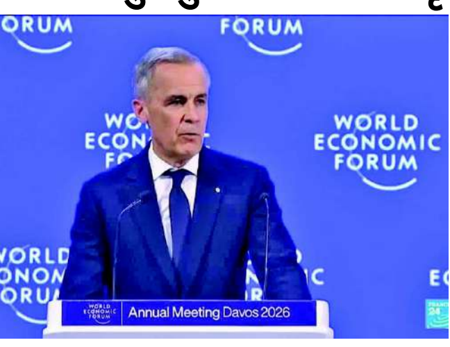
એક છે જેમણે ટ્રમ્પ દ્વારા મજબૂત વલણ અપનાવ્યું છે. ગ્રીનલેન્ડના જોડાણના મુદ્દા પર ફોરમમાં પોતાના શક્તિશાળી

નવીદિલ્હી, કેનેડિયન વડા પ્રધાન માર્ક કાર્નેએ સ્વિટ્ઝર્લેન્ડના દાવોસમાં પોતાના ભાષણથી વિશ્વનું ધ્યાન ખેંચ્યું છે. વર્લ્ડ ઈકોનોમિક ફોરમમાં, કાર્નેએ યુએસ રાષ્ટ્રપતિ ડોનાલ્ડ ટ્રમ્પની નીતિઓ પર નિશાન સાધ્યું અને નવી વિશ્વ વ્યવસ્થા વિશે વાત કરી. તેમણે ખાસ કરીને ભારત અને ચીન જેવા દેશોની ભૂમિકા પર ભાર મૂક્યો. તેમણે કહ્યું કે ભારત જેવી "મધ્યમ શક્તિઓ" ને એક થવાની જરૂર છે કારણ કે વર્તમાન યુએસ-નેતૃત્વ હેઠળની વિશ્વ વ્યવસ્થા નબળી પડી ગઈ છે. કાર્ને એવા નેતાઓમાંનો