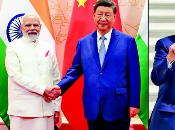
કાર્યકાળ અને તેમની નીતિઓમાં રહેલી ટ્રમ્પ કરતા વધુ પ્રભાવી બનાવે છે. આ સાતત્યતા તેમને યુરોપિયન નેતાઓ અને લાંબો કાર્યકાળ તેમને કોઈપણ દબાણનો

નવી દિલ્હી અમેરિકી રાષ્ટ્રપતિ ડોનાલ્ડ ટ્રમ્પ સતત પોતાની જગત જમાદાર બનવાના પેટાર કરી રહ્યા છે. વળી તેને 'નોબલ પુરસ્કાર'નું ભૂત વડગયું છે. સતત તેઓ તાકાત, ટેરિફ દ્વારા નકો મેળવવા અને યુદ્ધ અટકાવીને નોબેલ પુરસ્કાર જીતવાના દાવા કરી રહ્યા છે, પરંતુ વૈશ્વિક રાજકીય જાણકારોનું માનવું કંઈક અલગ જ છે. જાણીતા રાજકીય વિશ્લેષક ઈયન બ્રેમરના મતે, ભલે અમેરિકા દુનિયાનો સૌથી શક્તિશાળી દેશ હોય, પરંતુ વ્યક્તિગત નેતા તરીકે ડોનાલ્ડ ટ્રમ્પ કરતા ચીનના શી જિનપિંગ અને ભારતના પીએમ નરેન્દ્ર મોદી વધુ મજબૂત સ્થિતિમાં છે. ઈયન બ્રેમરના જણાવ્યા અનુસાર, શી જિનપિંગની તાકાતનું મુખ્ય કારણ ત્યાંની વ્યવસ્થા છે. જિનપિંગે ટ્રમ્પની જેમ મિડર્ટમ ઈલેક્શનનો સામનો કરવો પડતો નથી, કે ત્યાં કોઈ સ્વતંત્ર ન્યાયતંત્ર તેમને રોકી શકે તેમ નથી. વધુમાં, ટ્રમ્પ આગામી ત્રણ વર્ષમાં પદ પર નહીં હોય, જ્યારે જિનપિંગ લાંબા સમય સુધી સત્તામાં રહેવાના છે. બીજી તરફ, વડાપ્રધાન મોદી વિશે વાત કરતા તેમણે કહ્યું કે, મોદીનો લાંબો