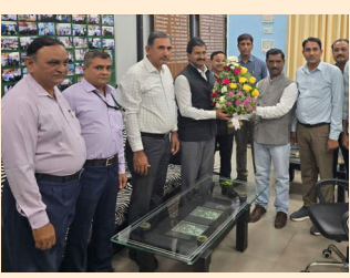
તેમજ મુખ્ય સ્ટેશનો પર તેમની ડ્યુટીની સમીક્ષા કરવી, ૧૦ ટકા ઈટેક કોટામાં વર્કશોપ અધિકારીની નિમણૂક કરવી, પસંદગી પામેલા કર્મચારીઓને તુરંત છૂટકા કરવા માટે વધારે કર્મચારીઓ ભાવનગરને આપવા, ડીઆરએમ ઓફિસ તેમજ વિવિધ હિલ્ડ ઓફિસમાં

સર્વિસ ગ્રાઉંડ પર ટ્રાન્સફર કરવા માટે પર્યાપ્ત માત્રામાં કર્મચારીઓ ભાવનગર ડીવિઝનને ફાળવણી કરવી, સાસણગીર, સોમનાથ તથા દીવ ખાતે લોહી ૩ હોમ માટેની ભાડે પટ્ટા પર વ્યવસ્થા કરવી, જેતલસરથી લોકો લોભ ને રાજકોટ ખાતે ટ્રાન્સફર કરેલ તેની સમીક્ષા કરીને ભાવનગરમાં કંટ્રોલ હેઠળ કરવી, પોઈન્ટસમેન કેટેગરીમાં રેલવે ૧૮૮ જગ્યાઓ તુરંત ભરવી