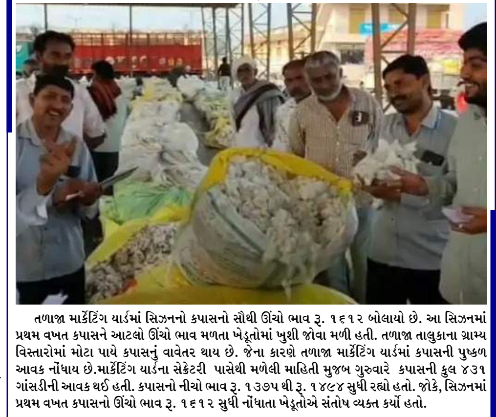
તળાજા માર્કેટિંગ યાર્ડમાં સિઝનનો કપાસનો સૌથી ઊંચો ભાવ રૂ. ૧૬૧૨ બોલાયો છે. આ સિઝનમાં પ્રથમ વખત કપાસને આટલો ઊંચો ભાવ મળતા ખેડૂતોમાં ખુશી જોવા મળી હતી. તળાજા તાલુકાના ગ્રામ્ય વિસ્તારમાં મોટા પાયે કપાસનું વાવેતર થાય છે. જેના કારણે તળાજા માર્કેટિંગ યાર્ડમાં કપાસની પુષ્કળ આવક નોંધાય છે. માર્કેટિંગ યાર્ડના સેક્રેટરી પાસેથી મળેલી માહિતી મુજબ ગુરુવારે કપાસની કુલ ૪૩૧ ગાંસડીની આવક થઈ હતી. કપાસનો નીચો ભાવ રૂ. ૧૩૭૫ થી રૂ. ૧૪૮૪ સુધી રહ્યો હતો. જોકે, સિઝનમાં પ્રથમ વખત કપાસનો ઊંચો ભાવ રૂ. ૧૬૧૨ સુધી નોંધાતા ખેડૂતોએ સંતોષ વ્યક્ત કર્યો હતો.