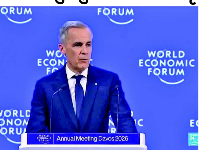
એક છે જેમણે ટ્રમ્પ દ્વારા મજબૂત વલણ અપનાવ્યું છે. ગ્રીનલેન્ડના જોડાણના મુદ્દા પર ફોરમમાં પોતાના શક્તિશાળી

નવીદિલ્હી, કેનેડિયન વડા પ્રધાન માર્ક કાર્નેએ સ્વિટ્ઝર્લેન્ડના દાવોસમાં પોતાના ભાષણથી વિશ્વનું ધ્યાન ખેંચ્યું છે. વર્લ્ડ ઈકોનોમિક ફોરમમાં, કાર્નેએ યુએસ રાષ્ટ્રપતિ ડોનાલ્ડ ટ્રમ્પની નીતિઓ પર નિશાન સાધ્યું અને નવી વિશ્વ વ્યવસ્થા વિશે વાત કરી. તેમણે ખાસ કરીને ભારત અને ચીન જેવા દેશોની ભૂમિકા પર ભાર મૂક્યો. તેમણે કહ્યું કે ભારત જેવી "મધ્યમ શક્તિઓ" ને એક થવાની જરૂર છે કારણ કે વર્તમાન યુએસ-નેતૃત્વ હેઠળની વિશ્વ વ્યવસ્થા નબળી પડી ગઈ છે. કાર્ને એવા નેતાઓમાંનો