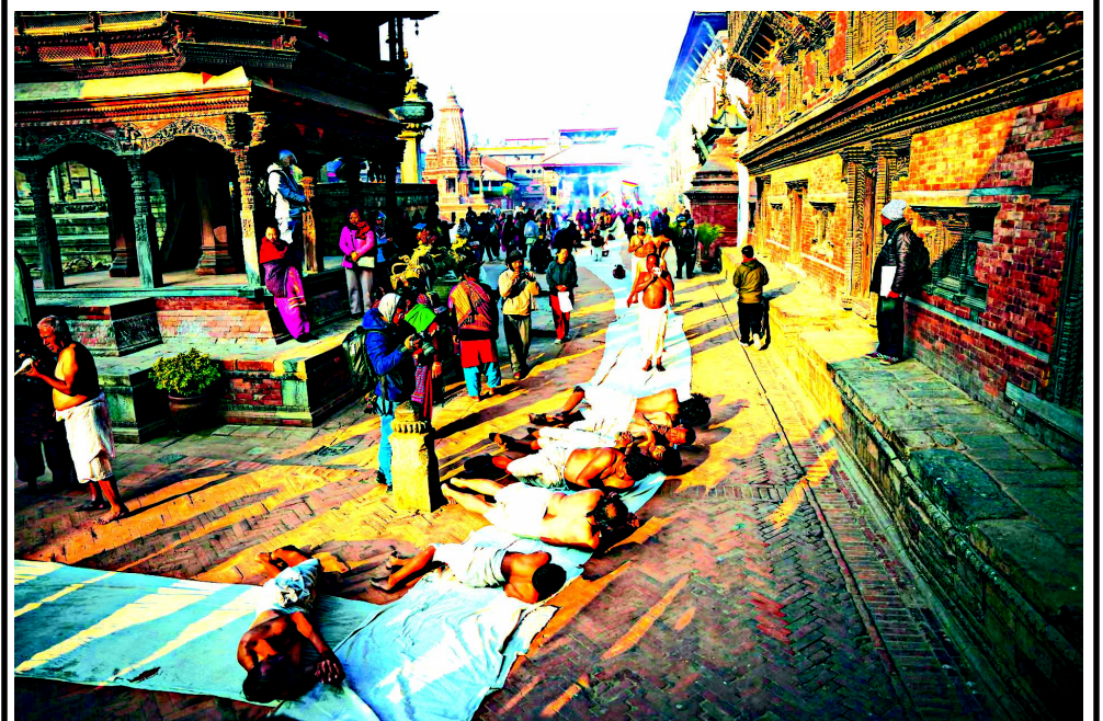
નેપાળના ભક્તપુરમાં સ્વસ્થાની ભ્રત કથા ઉત્સવ દરમિયાન હિન્દુ ભક્તો પ્રાર્થના કરી રહેલા જોવા મળે છે. ભગવાન માધવ નારાયણ અને દેવી સ્વસ્થાનીને સમર્પિત એક મહિના સુધી ચાલનારા આ ઉત્સવમાં ઘણા હિન્દુ ઘરોમાં તેમના દ્વારા કરવામાં આવેલા ચમત્કારિક પરાક્રમો વિશે લોકકથાઓનું પઠન કરવામાં આવે છે.

ઉલ્લેખનીય છે કે, છેલ્લા ત્રણ મહિનામાં અમદાવાદ સહિત રાજ્યના મોટા શહેરોમાં શાળાઓ ઉપરાંત કોર્ટ ક્વેરી, કલેક્ટર ક્વેરી સહિતની સરકારી બિલ્ડિંગોમાં બોમ્બ મુક્યો હોવાની ધમકી મળી છે. પોલીસ તપાસમાં ધમકી માત્ર અફવા બની રહી છે.