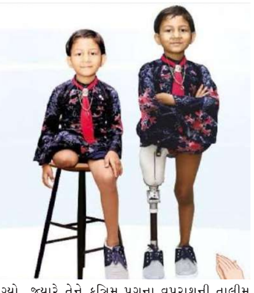
જ્યારે તેને કૃત્રિમ પગના વપરાશની તાલીમ આપવા આવનારાઓએ જાહેર કર્યું કે હવે તાલીમ આપવાનું શરૂ થશે. એ પગને કઈ રીતે ગોઠવવો, કઈ રીતે ચાલવું, કઈ સાવધાનીઓ અને સાવચેતીઓ તેણે રાખવી વગેરેની તાલીમ શરૂ થઈ. એક દિવસની એ બેઠક પૂરી થઈ ત્યારે એ કૃત્રિમ પગની તાલીમ આપનારા તેના ખાટલાની પાસે જ મૂકીને રવાના થયા. હવે તેણે એ પગ જાતે જ પહેરવાનો હતો. એ નવાંગતુક પગ સાથે તે પ્રેમમાં પડ્યો, જેની સાથે તેને જીવનભર જોડાવાનું આવ્યું હતું. પણ અત્યારે તેને એકલા જ ચાલવું હતું. તેની આસપાસ માતાપિતા હતાં, જેઓ તે જ્યારે-જ્યારે ખાટલામાંથી ઊભો થવા જાય ત્યારે સહેજે અથડાય કે પડવા લાગે નહીં તે માટે તેને પકડી લેવા હાજર જ રહેતાં. તે અધીરો બની ગયો. તે જાણતો હતો કે પોતાની જાત વિના બીજું કોઈ આ સંઘર્ષની તીવ્ર યાતનાને સમજી શકે તેમ નહોતું. તે કેટકેટલી મુશ્કેલીમાંથી પસાર થયો હતો. શારીરિક પીડા સહન

હવે તે તેને ઝડપથી સાજા થઈ જવું હતું. તેના શિક્ષકે વિકલાંગ સહાયક સંસ્થા દ્વારા કૃત્રિમ પગ લગાવવાની જાણકારી મેળવી. ખરું પૂછો તો છોકરો એ દિવસની બહુ આતુરતાથી રાહ જોવા લાગ્યો કે તેને હવે કૃત્રિમ પગ ક્યારે પહેરાવશે. જ્યારે છેવટે એ દિવસ આવી પહોંચ્યો ત્યારે એને નાચવાનું મન થઈ આવ્યું. તે ઉપરાંત એ કૃત્રિમ પગ તો લગભગ તેના પોતાના પગ જેવું જ કામ આપતો હતો. બસે વચ્ચે તેને ભેદ પાડવો અઘરો લાગ્યો. તેને તો જાણે નવું જીવન જ મળ્યું. હવે તેના મનમાં જ પર્વતારોહકનો મોભો બનાવવા માટે જાતને શક્તિ આપવા