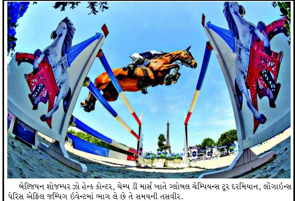
બેલ્જિયન શોજમ્પર ઝો હેન્ક ક્રોન્ટર, ચેમ્પ ડી માર્સ ખાતે ગ્લોબલ ચેમ્પિયન્સ ટૂર દરમિયાન, લોગાઈસ પેરિસ એફિલ જમિંગ ઈવેન્ટમાં ભાગ લે છે તે સમયની તસવીર.

ભાજપના વરિષ્ઠ નેતા જ્યોર્જ કુરિયનનું મંત્રી પદેથી રાજીનામું રાજ્યસભાના સાંસદ તરીકે નિવૃત્ત થતા હોવાથી આખું રાજીનામું નવી દિલ્લી મંત્રી પદ છોડવું પડ્યું છે. ભારતીય જનતા પક્ષના વરિષ્ઠ નેતા જ્યોર્જ કુરિયને મંગળવારે કેન્દ્રીય લઘુમતી બાબતો નિર્ણયની પુષ્ટિ કરવામાં આવી છે. અને મત્સ્યદોગ રાજ્ય મંત્રી (MoS)ના પદ પરથી સત્તાવાર રીતે રાજીનામું આપી દીધું છે. તેમની ૬ વર્ષની રાજ્યસભાની મુદત પૂર્ણ થવાને કારણે તેમણે આ રાષ્ટ્રપતિ ભવન દ્વારા જાહેર કરાયેલા સત્તાવાર નિવેદનમાં આ નિર્ણયની પુષ્ટિ કરવામાં આવી છે. રાષ્ટ્રપતિએ કુરિયનનું રાજીનામું સ્વીકારી લીધું છે. ૬૫ વર્ષીય જ્યોર્જ કુરિયન વડાપ્રધાન નરેન્દ્ર મોદીના નેતૃત્વ હેઠળની ત્રીજી કેન્દ્રીય કેબિનેટમાં ઓગસ્ટ ૨૦૨૪થી રાજ્ય મંત્રી (MoS) તરીકે સેવા આપી રહ્યા હતા. તેઓ ભાજપના વરિષ્ઠ નેતા છે, જેઓ વર્ષ ૧૯૮૦માં પક્ષની સ્થાપના થઈ ત્યારથી જ તેની સાથે જોડાયેલા છે. રાજકારણી હોવાની સાથે-સાથે તેઓ ભારતીય સર્વોચ્ચ અદાલતમાં વકીલ તરીકે પણ પ્રેક્ટિસ કરી ચૂક્યા છે.