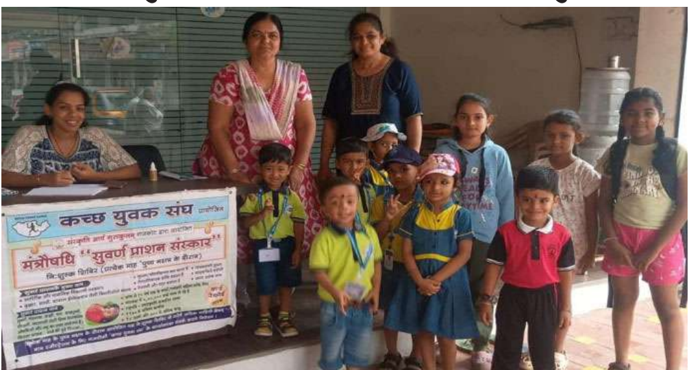
લાખો બાળકોને મંત્રીપદિ સુવર્ણપ્રાશનના ડોઝ સંપૂર્ણપણે વિનામૂલ્યે પીવાડાવવામાં આવ્યા હતા. સામાન્ય રીતે બજારમાં જે સુવર્ણપ્રાશન ડોઝની કિંમત રૂ. ૩૦ થી લઈને રૂ. ૫૦ સુધીની હોય છે, તે

રાજકોટ: સમગ્ર ભારતમાં બાળ સ્વાસ્થ્ય અને બાળ સંસ્કારના ઉત્થાન માટે છેલ્લા ૫૫ વર્ષથી કાર્યરત સંસ્કૃતિ આર્ય ગુરુકુલમ્ દ્વારા દેશભરમાં એક અનોખું અને ભવ્ય નિ:શુલ્ક મંત્રીપદિ સુવર્ણપ્રાશનમ અભિયાન ચલાવવામાં આવી રહ્યું છે. આ અંતર્ગત ગત ગુરુવાર, ૧૮ જૂન ના રોજ પુષ્ય નક્ષત્રના પવિત્ર અવસરે ભારતભરમાં વિશાળ કેમ્પનું આયોજન કરવામાં આવ્યું હતું. ભારતનું સૌથી જૂનું બાળસ્વાસ્થ્ય અભિયાન ગણાતા આ સેવાયત્ર હેઠળ દેશના ૧૮ રાજ્યોમાં ૧૧૦૦થી વધારે અને એકલા ગુજરાતમાં જ ૪૦૦થી વધુ કેન્દ્રો પર