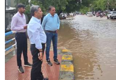
શહેરના કેટલાક વિસ્તારોમાં પાણી ભરાઈ જવા તથા વૃક્ષો તૂટી પડવા, શેડ ઉડવા જેવા બનાવોમાં ભાવનગર

ભાવનગર, તા. ૨૩ ભાવનગર શહેરમાં સોમવારે ઢળતી બપોરે ધોધમાર ૩૯ મી.મી. વરસાદ નોંધાતા વિવિધ વિસ્તારોમાં પાણી ભરાવાની સ્થિતિ સર્જાઈ હતી. પ્રથમ વરસાદ જ ધોધમાર પડતા એક તબક્કે કહી શકાય કે તંત્રની કસોટી થઈ હતી અને અનેક વિસ્તારોમાં પાણી ભરાઈ ગયા હતા આથી મ્યુ. કમિશનરે ગ્રાઉન્ડ પર ઉતરવું પડ્યું હતું અને પ્રભાવિત વિસ્તારોની મુલાકાત લઈ તાબડતોબ કાર્યવાહી કરાવી હતી.