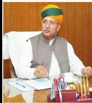
:-શ્રી અર્જુન રામ મેઘવાલ

સભ્યતાના સતત વિકાસના પરિણામે, જ્ઞાન, વિજ્ઞાન અને ટેકનોલોજી સમૃદ્ધ આધુનિક સમાજમાં, વિવિધ વિચારો અને મંતવ્યોને કારણે વ્યક્તિઓ અને સમુદાયો વચ્ચેના સંબંધોમાં પણ પરિવર્તન આવ્યું છે. જો કે, તેમાં કોઈ શંકા નથી કે વૈજ્ઞાનિક પ્રગતિ અને ટેકનોલોજીકલ પ્રગતિએ રાષ્ટ્રીય સરહદોની બહાર વિચારોના મુક્ત આદાનપ્રદાનને સરળ બનાવ્યું છે. અનાદિ કાળથી, એક વિચારને બીજા વિચાર પર શ્રેષ્ઠતા સ્થાપિત કરવાની સ્પર્ધા ન્યાયશાસ્ત્રના વિકાસ માટે એક મજબૂત પાયો રહી છે. વિચારો અને મૂલ્યોના આ સંઘર્ષ વચ્ચે, ન્યાયિક સંસ્થાઓએ, યુગોથી, સત્ય, નિષ્પક્ષતા અને કાયદાના શાસનમાં લોકોની શ્રદ્ધા પુનઃસ્થાપિત કરવાની જવાબદારી નિભાવી છે. તેઓએ એક સેતુ તરીકે સેવા આપી છે જે દરેક સંબંધિત પક્ષને, એકલતા અનુભવતા લોકો