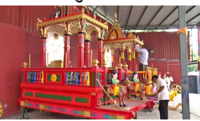
રથયાત્રાની તૈયારીઓ ચાલુ થઈ ગઈ છે, બે માસ પહેલાથી રથયાત્રાને લઈને કામગીરી પૂરજોશમાં શરૂ થઈ જાય છે. રથને જનમેદની બહુ જ વધારે હોય છે. એ સમયે રથને રમેજ થાય છે. જેના પહેલા શરૂ થાય છે. દર વર્ષે રથનું કલર કામ કરવામાં આવે છે, અને જ્યારે રથયાત્રા નીકળે છે, ત્યારે જનમેદની બહુ જ વધારે હોય છે. એ સમયે રથને રમેજ થાય છે. જેના