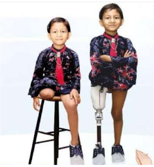
જ્યારે તેને કૃત્રિમ પગના વપરાશની તાલીમ આપવા આવનારાઓએ જાહેર કર્યું કે હવે તાલીમ આપવાનું શરૂ થશે. એ પગને કઈ રીતે ગોઠવવો, કઈ રીતે ચાલવું, કઈ સાવધાનીઓ અને સાવચેતીઓ તેણે રાખવી વગેરેની તાલીમ શરૂ થઈ. એક દિવસની એ બેઠક પૂરી થઈ ત્યારે એ કૃત્રિમ પગની તાલીમ આપનારા તેના ખાટલાની પાસે જ મૂકીને રવાના થયા.

હવે તે તેને ઝડપથી સાજા થઈ જવું હતું. તેના શિક્ષકે વિકલાંગ સહાયક સંસ્થા દ્વારા કૃત્રિમ પગ લગાવવાની જાણકારી મેળવી. ખરું પૂછો તો છોકરો એ દિવસની બહુ આતુરતાથી રાહ જોવા લાગ્યો કે તેને હવે કૃત્રિમ પગ ક્યારે પહેરાવશે. જ્યારે છેવટે એ દિવસ આવી પહોંચ્યો ત્યારે એને નાચવાનું મન થઈ આવ્યું. તે ઉપરાંત એ કૃત્રિમ પગ તો લગભગ તેના પોતાના પગ જેવું જ કામ આપતો હતો. બસે વચ્ચે તેને ભેદ પાડવો અઘરો લાગ્યો. તેને તો જાણે નવું જીવન જ મળ્યું. હવે તેના મનમાં જ પર્વતારોહકનો મોભો બનાવવા માટે જાતને શક્તિ આપવા