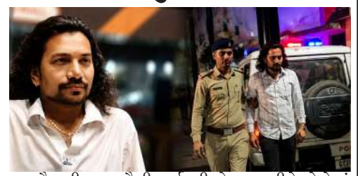
સુરત, સુરતની સરથાણા પોલીસે દેહવ્યાપારના અડા પર મોટી કાર્યવાહી કરી છે. યોગી ચોક નજીક સ્થળ પર એક ગ્રાહક પણ ઝડપાયો હતો. પોલીસે દરોડા પાડી દેહવ્યાપાર માટે રાખવામાં આવેલી ૭ મહિલાઓને મુક્ત કરાવી હતી. મહિલાઓ પાસેથી દેહવ્યાપાર કરાવવામાં આવી રહ્યો હતો. ગ્રાહકો પાસેથી રૂપિયા લઈ સ્થાની આડમાં મહિલાઓ પૂરી પાડવામાં આવતી હતી. પોલીસે હાથ ધરી છે. કાયદેસરની કાર્યવાહી હાથ ધરી છે. પોલીસ દ્વારા દરોડા પાડી મોબાઈલ ફોન અને રોકડ રકમ જપ્ત રવામાં આવી છે. આ સિવાય કોરોમ સહિત અન્ય પુરાવા એકત્ર કરવામાં આવ્યા છે.

સુરત, સુરત શહેરમાં એક ચોકવાનરી ઘટના સામે આવી છે, જેમાં ધાર્મિક માન્યતા અને ઉપચારના બહાને એક પરિણીતા સાથે દુષ્કર્મ આચરવામાં આવ્યું હોવાનો આરોપ સામે આવ્યો છે. કતારગામ વિસ્તારમાં રહેતી પરિણીતાની ફરિયાદના આધારે પોલીસે આરોપી ભુવાની ધરપકડ કરી વધુ તપાસ હાથ ધરી છે. મળતી માહિતી મુજબ, આરોપી ભુવા ધાર્મિક વિધિઓ અને સમસ્યાઓના નિવારણના નામે લોકોનો વિશ્વાસ જીતતો હતો. ફરિયાદી મહિલાનો સંપર્ક પણ આ જ રીતે થયો હતો. મહિલાએ આરોપ મુક્યો છે કે ભુવાએ ધાર્મિક ઉપચાર અને વિશેષ વિધિ કરાવવાના બહાને તેને હોટલમાં બોલાવી હતી. ત્યાં પહોંચ્યા બાદ મહિલાની મરજી વિરુદ્ધ દુષ્કર્મ આચરવામાં આવ્યું હોવાનું ફરિયાદમાં જણાવાયું છે. પોલીસ તપાસમાં સામે આવ્યું છે કે આરોપી ભાડાના મકાનમાં રહેતો હતો અને સોશિયલ મીડિયા પર વેબવી જીવનશૈલી દર્શાવતી પોસ્ટ્સ મુકીને લોકોમાં પોતાની અલગ છાપ ઊભી કરતો હતો. મોંઘી ગાડીઓ, ભવ્ય જીવન અને ધાર્મિક પ્રભાવ દર્શાવતી પોસ્ટ્સ દ્વારા લોકોનો વિશ્વાસ જીતવાનો પ્રયાસ કરતો હોવાનું પણ તપાસમાં સામે આવ્યું છે. મહિલાની ફરિયાદ બાદ પોલીસે તાત્કાલિક ગુનો નોંધી આરોપીની ધરપકડ કરી છે. હાલ પોલીસ દ્વારા ઘટનાના તમામ પાસાઓની તપાસ કરવામાં આવી રહી છે. સાથે જ આરોપીએ અન્ય કોઈ મહિલાને પણ આ જ રીતે શિકાર બનાવી છે કે નહીં તે અંગે પણ માહિતી એકત્રિત કરવામાં આવી રહી છે.