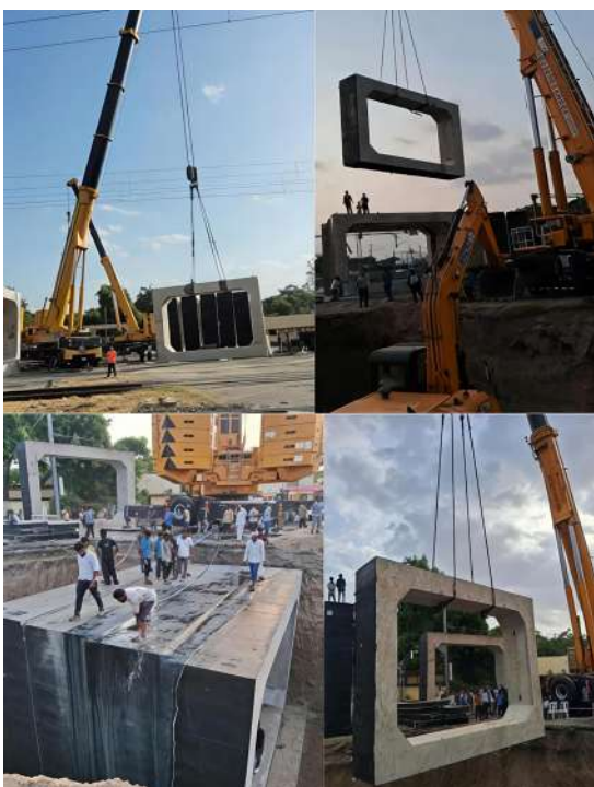
જ આરસીસી બોક્સના લોન્ચિંગ અને પ્લેસમેન્ટ માટે મેગા ટ્રાક્ટિક અને પાવર બ્લોક સફળતાપૂર્વક પૂર્ણ કરવામાં આવ્યો હતો. નિર્ધારિત બ્લોક સમયગાળા દરમિયાન રેલવે પ્રશાસન દ્વારા ભારે મશીનરી અને મોટી સંખ્યામાં