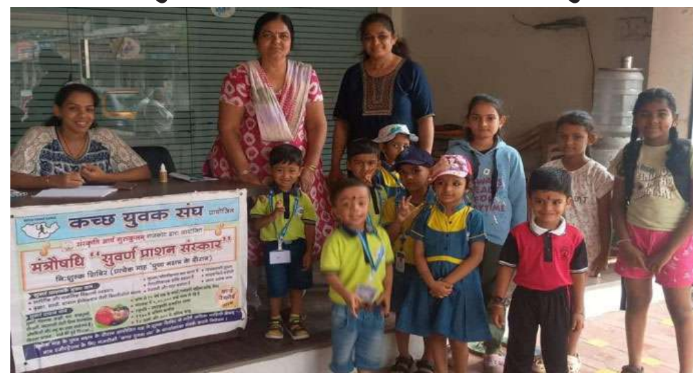
લાખો બાળકોને મંત્રીપદિ સુવર્ણપ્રાશનના ઝોજ સંપૂર્ણપણે વિનામૂલ્યે પીવાડાવવામાં આવ્યા હતા. સામાન્ય રીતે બજારમાં જે સુવર્ણપ્રાશન ઝોજની કિંમત રૂ. ૩૦ થી લઈને રૂ. ૫૦ સુધીની હોય છે, તે

રાજકોટ: સમગ્ર ભારતમાં બાળ સ્વાસ્થ્ય અને બાળ સંસ્કારના ઉત્થાન માટે છેલ્લા ૫૫ વર્ષથી કાર્યરત સંસ્કૃતિ આર્ય ગુરુકુલમ્ દ્વારા દેશભરમાં એક અનોખું અને ભવ્ય નિઃશુલ્ક મંત્રીપદિ સુવર્ણપ્રાશન અભિયાન ચલાવવામાં આવી રહ્યું છે. આ અંતર્ગત ગત ગુરુવાર, ૧૮ જૂન ના રોજ પુષ્પ નક્ષત્રના પવિત્ર અવસરે ભારતભરમાં વિશાળ કેમ્પનું આયોજન કરવામાં આવ્યું હતું. ભારતનું સૌથી જૂનું બાળસ્વાસ્થ્ય અભિયાન ગણાતા આ સેવાયત્ર હેઠળ દેશના ૧૯ રાજ્યોમાં ૧૧૦૦થી વધારે અને એકલા ગુજરાતમાં ૪૦૦થી વધુ કેન્દ્રો પર