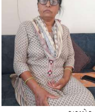
રાજકોટ: દર વર્ષે ૨૩ જૂને 'આંતરરાષ્ટ્રીય વિધવા દિવસે' ગંગાસ્વરૂપા મહિલાઓ માનભરે જીવી શકે, તે માટે વિવિધ કલ્યાણકારી પ્રવૃત્તિઓ હાથ ધરવામાં આવે છે. દેશના વડાપ્રધાન શ્રી નરેન્દ્રભાઈ મોદીના નેતૃત્વમાં નારી શક્તિને 'સન્માન, સુરક્ષા અને સુવિધા' પૂરી પાડી આત્મનિર્ભર બનાવવાનો સંકલ્પ લેવાયો છે. આ જ માનવીય અભિગમને સાકાર કરવા રાજ્ય સરકારના મહિલા અને બાળ વિકાસ વિભાગ દ્વારા વર્ષ ૧૯૭૯થી 'ગંગાસ્વરૂપા આર્થિક સહાય યોજના' અમલમાં મૂકવામાં આવી છે, જે ગંગાસ્વરૂપા માટે આર્થિક અને સામાજિક સુરક્ષામાં કવચ બની છે.

રાજકોટ જિલ્લામાં એક વર્ષ દરમિયાન ૭૫ હજારથી વધુ મહિલાઓને રૂ. ૧૧૨ કરોડથી વધુની સહાય