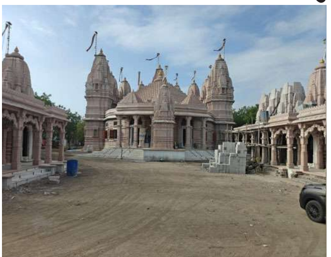
રાજકોટ જિનાલયના આંગણે સવારે ૬-૩૦ કલાકે આદેશ્વર દાદાના અભિષેક તથા પક્ષાલ કરવામાં આવશે. આ અનુષ્ઠાનમાં ઉપસ્થિત રહેનારા ભાવિકોને ભાતુ આપવામાં આવશે.