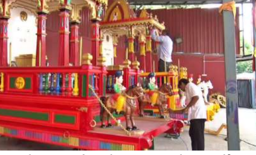
રથયાત્રાની તૈયારીઓ ચાલુ થઈ ગઈ છે, બે માસ પહેલાથી રથયાત્રાને લઈને કામગીરી પૂરજોશમાં શરૂ થઈ જાય છે. રથને જનમેદની બહુ જ વધારે હોય છે. એ સમયે રથને રમેજ થાય છે. જેના પહેલા શરૂ થાય છે. દર વર્ષે રથનું કલર કામ કરવામાં આવે છે, અને જ્યારે રથયાત્રા નીકળે છે, ત્યારે જનમેદની બહુ જ વધારે હોય છે. એ સમયે રથને રમેજ થાય છે. જેના