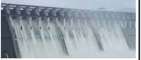
અમદાવાદ, ગુજરાતમાં ભલે હજુ સત્તાવાર યોમાસાની શરૂઆત થઈ નથી પરંતુ સરદાર સરોવર ડેમની સપાટીમાં વધારો થયો છે. ડેમના ઉપરવાસમાંથી પાણીની આવક વધી છે. મધ્યપ્રદેશના ઓમકારેશ્વર અને ઈન્દિરાસાગર ડેમના પાવર હાઉસ પણ ચાલુ કરવામાં આવ્યા છે. નર્મદા ડેમમાં ઉપરવાસમાંથી ૧૬૦૫૫ ક્યુસેક પાણીની આવક થઈ છે. ગુજરાતની જીવાદોરી ગણાતા નર્મદા ડેમની સપાટીમાં વધારો થઈ રહ્યો છે. ઉપરવાસમાંથી પાણી છોડતા નર્મદા ડેમની સપાટીમાં વધારો થયો છે. નર્મદા ડેમમાં હાલ પાણીની સપાટી ૧૨૬.૭૮ મીટર છે. નર્મદા ડેમના સીએચપીએચ પાવરહાઉસના ત્રણ યુનિટ ચાલુ કરવામાં આવ્યા છે. રાજ્યમાં સિંચાઈ અને પીવાના પાણી માટે મુખ્ય કેનાલમાં ૧૬૨૨૩ ક્યુસેક પાણી છોડવામાં આવ્યું છે. નર્મદા ડેમથી કેનાલ દ્વારા રાજ્યભરમાં ખેતી અને પીવા માટે પાણી પહોંચાડવામાં આવે છે. તેવામાં યોમાસા પહેલા નર્મદા ડેમની સપાટીમાં વધારો થયો સારા સમાચાર છે. આજે પણ નર્મદા ડેમ પૉટ ટકા ભરાયેલો છે. નર્મદા ડેમમાં કુલ ૩૩૨૪ MCM ક્યુસેક લાઈવ સ્ટોરેજ પાણી છે.

વેગવંતી બનાવી છે એમ પણ મુખ્યમંત્રીશ્રીએ ઉમેર્યું હતું. આ મૂલાકાત બેઠકની ચર્ચાઓ દરમિયાન નાયબ મુખ્યમંત્રી શ્રી હર્ષ સંઘવીએ કહ્યું કે, ગુજરાત વર્લ્ડ પોલીસ એન્ડ ફાયર ગેઈમ્સ, ક્રોમનવેલ્થ ગેઈમ્સ-૨૦૩૦ સહિત વર્લ્ડક્લાસ સ્પોર્ટ્સના આયોજન માટે સજ્જ છે અને આ હેતુસર વીર સાવરકર સ્પોર્ટ્સ કોમ્પ્લેક્સ, સરદાર પટેલ સ્પોર્ટ્સ એન્ડલેવ, વિશ્વનું સૌથી મોટું સ્ટેડિયમ નરેન્દ્રમોદી સ્ટેડિયમ, કરાઈ એકેડમી જેવા સ્થળોએ આવી વિશ્વ સ્તરીય રમતોના આયોજન માટેની સુવિધાઓ ઝડપભર વિકસી રહી છે. આ મૂલાકાત બેઠકમાં મુખ્યમંત્રીશ્રીના અગ્ર સચિવ શ્રી સંજીવ કુમાર, સ્પોર્ટ્સ ઓથોરિટી ઓફ ગુજરાતના ડાયરેક્ટર જનરલ શ્રી વાળા, શ્રી આદિલ સુમારીવાલા, વાઈસ પ્રેસીડન્ટ વર્લ્ડ એથ્લેટિક્સ વગેરે ઉપસ્થિત રહ્યા હતા.