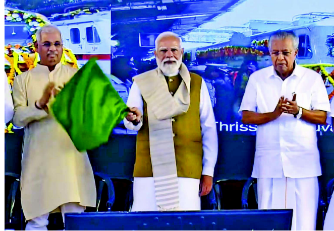
જ રીતે, કેરળમાં અમારી શરૂઆત એક શહેરથી થઈ હતી. મારું માનવું છે કે આ દશવિ છે કે કેરળના લોકો ભાજપ પર વિશ્વાસ કરવા લાગ્યા

તિરુવનંતપુરમ, પીએમ મોદીએ કેરળમાં ઇનોવેશન અને આંતરપ્રેન્ચોરશિપ હબનો શિલાન્યાસ કર્યો. વધુમાં, પીએમ સ્વનિધિ કેડિટ કાર્ડ લોન્ચ કરવામાં આવ્યું હતું, જેનો લાભ શેરી વિકેતાઓને મળશે. પીએમ મોદીએ તિરુવનંતપુરમમાં ત્રણ નવી અમૃત ભારત ટ્રેનોને લીલી ઝંડી આપી. નાગરકોઈલ-મંગલુરુ, તિરુવનંતપુરમ-તાંબરમ, તિરુવનંતપુરમ-ચારલાપલ્લી, અને ત્રિશુર અને ગુરુવાયુર વચ્ચે એક નવી પેસેન્જર ટ્રેન. પીએમ મોદીએ કહ્યું કે કેરળના