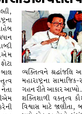
વ્યક્તિત્વને શ્રદ્ધાંજલિ આપીએ છીએ જેમણે મહારાષ્ટ્રના સામાજિક-રાજકીય પરિદેશને ગહન રીતે આકાર આપ્યો. તેમની તીક્ષ્ણ બુદ્ધિ, શક્તિશાળી વક્તૃત્વ કૌશલ્ય અને મજબૂત વિશ્વાસ માટે જાણીતા, બાબા સાહેબનો લોકો સાથે એક અનોખો સંબંધ હતો. રાજકારણ

નવીદિલ્હી, શિવસેના પક્ષના સ્થાપક અને મહારાષ્ટ્રના રાજકારણમાં અગ્રણી વ્યક્તિ, બાબા સાહેબ ઠાકરેની ૧૦૦મી જન્મજયંતિ પ્રસંગે વડા પ્રધાન નરેન્દ્ર મોદીએ પણ તેમની જન્મ શતાબ્દી નિમિત્તે તેમને શ્રદ્ધાંજલિ આપી. પીએમ મોદીએ બાલ ઠાકરે સાથેના પોતાના જૂના ફોટા શેર કર્યા અને તેમની પ્રશંસા કરી. તેમણે બાલ ઠાકરેને તીક્ષ્ણ બુદ્ધિ, શક્તિશાળી વક્તૃત્વ કૌશલ્ય અને મજબૂત વિશ્વાસ ધરાવતા નેતા તરીકે વર્ણવ્યા. એક્સ પર એક ટ્વિટમાં, પીએમ મોદીએ કહ્યું, "મહાન બાબા સાહેબ ઠાકરેની જન્મશતાબ્દી પર, અમે એક એવા મહાન