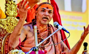
રાષ્ટ્રીય મીડિયા ઈન્ચાર્જ, શેલેન્દ્ર યોગીરાજે તેમના ખરાબ સ્વાસ્થ્યની પુષ્ટિ કરી. મૌની અમાવસ્યા પર, મેળાના વહીવટીતંત્રે તેમની પાલાખી રોકી અને તેમને પાછા ફરવાની દીધા. શંકરાચાર્યના શિષ્યો અને સંતોનો આરોપ છે કે તેમની ટોચની ગાંઠ અને વાળનો ટુકડો

પ્રયાગરાજ, જ્યોતિષ પીઠના શંકરાચાર્ય સ્વામી અધિમુક્તેશ્વરાનંદ સરસ્વતી, જેઓ ૧૮ જાન્યુઆરી, મૌની અમાવસ્યાથી માથે મેળામાં ધરણા પર બેઠા છે, તેમની તબિયત શુક્રવારે ખરાબ થઈ ગઈ. તેમને તાવ આવ્યો. છ દિવસ સુધી ખુલ્લા આકાશ નીચે બેસી રહેવાથી તેમની તબિયત બગડી ગઈ છે. તેમણે ડોક્ટરોની સલાહ લીધી છે. તેઓ હાલમાં આરામ કરી રહ્યા છે અને જાહેર સંપર્ક ટાળી રહ્યા છે. શંકરાચાર્યના