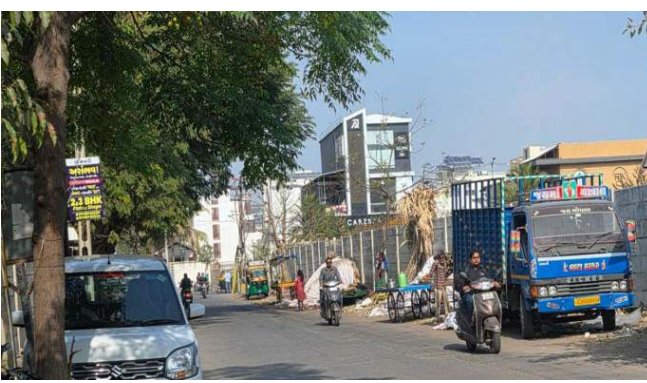
છે. સ્થાનિક કોર્પોરેશનને પણ આ અંગે જાણ કરવામાં આવી હોવા છતાં આજદિન સુધી કોઈ કાયમી ઉકેલ મળ્યો નથી. પ્રશ્ન એ ઊભો થાય છે કે, જ્યારે નાગરિકો નિયમિત રીતે ફેરિયાદ નોંધાવે છે, ત્યારે જવાબદાર અધિકારીઓ દ્વારા ગંભીરતાથી પગલા કેમ લેવામાં આવતા નથી? શું રહેણાંક વિસ્તારમાં અનધિકૃત ધંધાઓને મુલ્કી છૂટ આપવામાં આવી રહી

આ બાબતે રહેવાસીઓ દ્વારા રાજકોટ મ્યુનિસિપલ કોર્પોરેશનના મનપા પોર્ટલ પર ત્રણ વખત ફેરિયાદ નોંધાવવામાં આવી છે. દુભાગ્યવશ, કોઈપણ પ્રકારની યોગ્ય કાર્યવાહી કર્યા વિના ફેરિયાદો બંધ કરી દેવામાં આવી