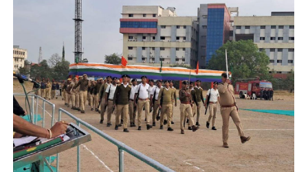
પરેડ નિરીક્ષણ કરવામાં આવ્યું હતું. એ પછી પોલીસ, હોમગાર્ડ્સ તથા એન.સી.સી.ની ગલ્ફ બટાલિયનની પ્લાટૂન દ્વારા માર્ચ પાસ્ટ યોજવામાં આવી હતી. આ તકે વિવિધ શાળાઓના વિદ્યાર્થીઓ દ્વારા યોગ તેમજ