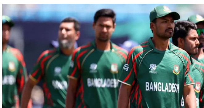
આઘપીએલમાં બાંગ્લાદેશને અડીમેટમ આપ્યું હતું કે કાં તો ભારતની મુસાફરી કરવા સંમત થાઓ અથવા તેમની જગ્યાએ બીજી ટીમ લેવામાં આવશે. આઘપીએલે જણાવ્યું હતું કે ભારતમાં તેના ખેલાડીઓ, અધિકારીઓ અથવા ચાહકોની સલામતી માટે કોઈ ખતરો નથી. બાંગ્લાદેશને નિર્ણય લેવા માટે ૨૨ જાન્યુઆરી સુધીનો સમય

બાંગ્લાદેશ કડક વલણ અપનાવ્યું અને ૭ ફેબ્રુઆરીથી ભારતમાં યોજાનાર ટી ૨૦ વર્લ્ડ કપ માટે તેની ટીમ ભારતમાં મોકલવાનો ઇનકાર કર્યો. તેમણે આ ટી ૨૦ વર્લ્ડ કપનો બહિષ્કાર કર્યો છે. ભારત ન જવાનો અને આઘપીએલ ટૂર્નામેન્ટનો બહિષ્કાર કરવાનો બાંગ્લાદેશ ક્રિકેટ બોર્ડે નિર્ણય આગામી દિવસોમાં બાંગ્લાદેશ ક્રિકેટ માટે નોંધપાત્ર મુશ્કેલીઓ ઊભી કરી શકે છે. ટી ૨૦ વર્લ્ડ કપ દરમિયાન ભારતમાં મેચ ન રમવાથી બાંગ્લાદેશ ક્રિકેટ બોર્ડને નોંધપાત્ર નુકસાન થઈ શકે છે. પરિણામે, બાંગ્લાદેશ ક્રિકેટ હવે પતનની આરે છે. અહેવાલ મુજબ, જે બાંગ્લાદેશ ટી ૨૦ વર્લ્ડ કપમાંથી બહાર થઈ જાય છે, તો બાંગ્લાદેશ ક્રિકેટ બોર્ડને આગામી દિવસોમાં આશરે ૨૪૦ કરોડ રૂપિયા (૩૨૫ કરોડ બાંગ્લાદેશી ટાકા અથવા આશરે ૨૭ મિલિયન) નું નુકસાન થઈ શકે છે. આ રકમ મુખ્યત્વે આઘપીએલ વાર્ષિક આવક હિસ્સા સાથે સંબંધિત છે. આ રકમ બીસીબીની વાર્ષિક આવકનો નોંધપાત્ર ભાગ સ્વૂ કરે છે. તેથી, જે તેઓ ટૂર્નામેન્ટમાં નહીં રમે, તો તેમને આ રકમ મળશે નહીં.