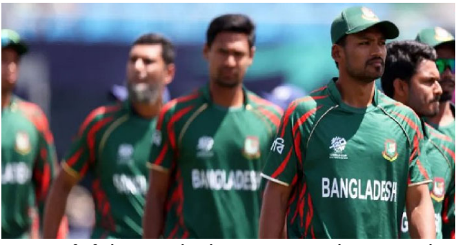
આઘપીએલમાં બાંગ્લાદેશને અડીમેટમ આપ્યું હતું કે કાં તો ભારતની મુસાફરી કરવા સંમત થાઓ અથવા તેમની જગ્યાએ બીજી ટીમ લેવામાં આવશે. આઘપીએલે જણાવ્યું હતું કે ભારતમાં તેના ખેલાડીઓ, અધિકારીઓ અથવા ચાહકોની સલામતી માટે કોઈ ખતરો નથી. બાંગ્લાદેશને નિર્ણય લેવા માટે ૨૨ જાન્યુઆરી સુધીનો સમય

બાંગ્લાદેશ કડક વલણ અપનાવ્યું અને ૭ ફેબ્રુઆરીથી ભારતમાં યોજાનાર ટી ૨૦ વર્લ્ડ કપ માટે તેની ટીમ ભારતમાં મોકલવાનો ઇનકાર કર્યો. તેમણે આ ટી ૨૦ વર્લ્ડ કપનો બહિષ્કાર કર્યો છે. ભારત ન જવાનો અને આઘપીએલ ટૂર્નામેન્ટનો બહિષ્કાર કરવાનો બાંગ્લાદેશ ક્રિકેટ બોર્ડે નિર્ણય આગામી દિવસોમાં બાંગ્લાદેશ ક્રિકેટ માટે નોંધપાત્ર મુશ્કેલીઓ ઊભી કરી શકે છે. ટી ૨૦ વર્લ્ડ કપ દરમિયાન ભારતમાં મેચ ન રમવાથી બાંગ્લાદેશ ક્રિકેટ બોર્ડને નોંધપાત્ર નુકસાન થઈ શકે છે. પરિણામે, બાંગ્લાદેશ ક્રિકેટ હવે પતનની આરે છે. અહેવાલ મુજબ, જે બાંગ્લાદેશ ટી ૨૦ વર્લ્ડ કપમાંથી બહાર થઈ જાય છે, તો બાંગ્લાદેશ ક્રિકેટ બોર્ડને આગામી દિવસોમાં આશરે ૨૪૦ કરોડ રૂપિયા (૩૨૫ કરોડ બાંગ્લાદેશી ટાકા અથવા આશરે ૨૭ મિલિયન) નું નુકસાન થઈ શકે છે. આ સ્કમ મુખ્યત્વે આઘપીએલ વાર્ષિક આવક હિસ્સા સાથે સંબંધિત છે. આ સ્કમ બીસીબીની વાર્ષિક આવકનો નોંધપાત્ર ભાગ સ્વૂ કરે છે. તેથી, જે તેઓ ટૂર્નામેન્ટમાં નહીં રમે, તો તેમને આ સ્કમ મળશે નહીં.