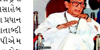
વ્યક્તિત્વને શ્રદ્ધાંજલિ આપીએ છીએ જેમણે મહારાષ્ટ્રના સામાજિક-રાજકીય પરિદેશને ગહન રીતે આકાર આપ્યો. તેમની તીક્ષ્ણ બુદ્ધિ, શક્તિશાળી વક્તૃત્વ કૌશલ્ય અને મજબૂત વિશ્વાસ માટે જાણીતા, બાલાસાહેબનો લોકો સાથે એક અનોખો સંબંધ હતો. રાજકારણ

નવીદિલ્હી, શિવસેના પક્ષના સ્થાપક અને મહારાષ્ટ્રના રાજકારણમાં અગ્રણી વ્યક્તિ, બાબા સાહેબ ઠાકરેની ૧૦૦મી જન્મજયંતિ પ્રસંગે વડા પ્રધાન નરેન્દ્ર મોદીએ પણ તેમની જન્મ શતાબ્દી નિમિત્તે તેમને શ્રદ્ધાંજલિ આપી. પીએમ મોદીએ બાલ ઠાકરે સાથેના પોતાના જૂના ફોટા શેર કર્યા અને તેમની પ્રશંસા કરી. તેમણે બાલ ઠાકરેને તીક્ષ્ણ બુદ્ધિ, શક્તિશાળી વક્તૃત્વ કૌશલ્ય અને મજબૂત વિશ્વાસ ધરાવતા નેતા તરીકે વર્ણવ્યા. એક્સ પર એક ટ્વિટમાં, પીએમ મોદીએ કહ્યું, "મહાન બાલાસાહેબ ઠાકરેની જન્મશતાબ્દી પર, અમે એક એવા મહાન