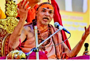
રાષ્ટ્રીય મીડિયા ઈન્ચાર્જ, શેલેન્દ્ર યોગીરાજે તેમના ખરાબ સ્વાસ્થ્યની પુષ્ટિ કરી. મૌની અમાવસ્યા પર, મેળાના વહીવટીતંત્રે તેમની પાલાખી રોકી અને તેમને પાછા ફેરવી દીધા. શંકરાચાર્યના શિષ્યો અને સંતોનો આરોપ છે કે તેમની ટોચની ગાંઠ અને વાળનો ટુકડો

પ્રયાગરાજ, જ્યોતિષ પીઠના શંકરાચાર્ય સ્વામી અધિમુક્તેશ્વરાનંદ સરસ્વતી, જેઓ ૧૮ જાન્યુઆરી, મૌની અમાવસ્યાથી માથે મેળામાં ધરણા પર બેઠા છે, તેમની તબિયત શુક્રવારે ખરાબ થઈ ગઈ. તેમને તાવ આવ્યો. છ દિવસ સુધી ખુલ્લા આકાશ નીચે બેસી રહેવાથી તેમની તબિયત બગડી ગઈ છે. તેમણે ડોક્ટરોની સલાહ લીધી છે. તેઓ હાલમાં આરામ કરી રહ્યા છે અને જાહેર સંપર્ક ટાળી રહ્યા છે. શંકરાચાર્યના