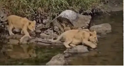
વન્યપ્રેમીઓના દિલ જીતી લીધા છે. આ તસવીરો મા એક સિંહણ તેના બે માસુમ બચ્ચા સાથે જંગલની નદી પાર કરતી જોવા મળી રહી છે. જે માતૃવ ના સાહસનો સંગમ કહી

ગિના: કુદરતના ખોળે પથરાયેલ લીલોતરી યાદર મા પથરાયેલું ગીરનું જંગલ હંમેશા વન્ય વૃક્ષો ભરેલો રહેતો હોય ગીર નેશનલ વન્ય બળખળ વહેતી નદી ના નિર વન્યજીવન સાથે વાતો કરતા હોય આવા કુદરતી વાતાવરણ વચ્ચે ગીર નુ વન્ય વિસ્તાર વિશ્વભરમાં આકર્ષણનું કેન્દ્ર રહ્યું છે. આમ તો ગીર જંગલ રહેલાં વનરાજા ના અનેક વિદીયો તસવીરો છાશવારે સોશિયલ મીડિયા પર વાઈરલ થતી રહે છે પરંતુ આ અનોખો વિદીયો છે જેણે