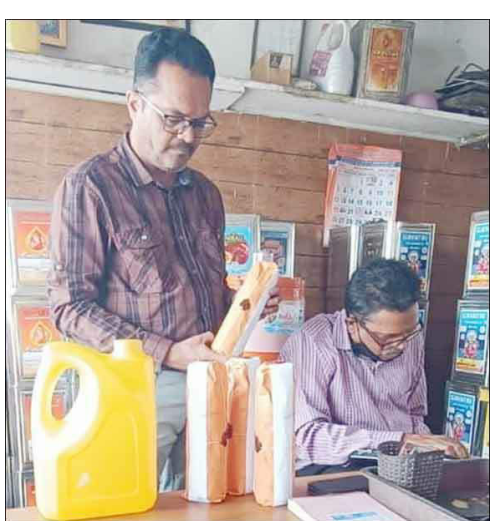
રાજકોટ, રાજકોટ મહાનગરપાલિકાના ફૂડ વિભાગની ટીમ તથા વાન સાથે શહેરના હેમુ ગઢવી

ખાદ્ય ચીજોના કુલ ૧૬ નમૂનાની સ્થળ પર ચકાસણી : બેને લાઇસન્સ અંગે સૂચના