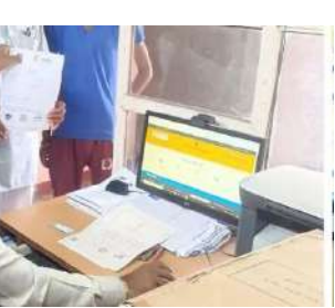
કરવાની પ્રક્રિયા શરૂ કરી હોવાનું જણાવ્યું છે. કર્મચારીઓએ જણાવ્યું છે કે ઈ-ગ્રામ વિશ્વગ્રામ યોજના ગામડાંમાં ડિજિટલ સેવાઓ પહોંચાડવામાં મહત્વની ભૂમિકા ભજવે છે. અત્યુભવી કર્મચારીઓને દૂર કરવાથી ગ્રામ પંચાયતોમાં નાગરિકોને મળતી

રાજ્ય અને જિલ્લા સ્તરના એકિઝક્યુટીવ, આધાર કોઓર્ડિનેટર, સહાયક, પ્રોજેક્ટ કોઓર્ડિનેટર અને મેનેજરોનો સમાવેશ થાય છે. કર્મચારીઓએ જણાવ્યું છે કે અચાનક લેવાયેલો આ નિર્ણય તેમની રોજગાર સુરક્ષા માટે ગંભીર ચિંતા ઊભી કરે છે. પત્રમાં વધુમાં જણાવવાયું છે કે વિકાસ કમિશનરે આ માટેની એજન્સી આર્મી ઈન્ફોટેકને પત્ર લખી માનવ સંસાધનનો ઉપયોગ સીમિત કરવા સૂચના આપી છે. આ સૂચના બાદ કંપનીએ ગાંધીનગર જિલ્લામાં કામ કરતા કર્મચારીઓને ફરજમાંથી દૂર