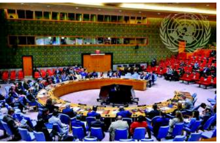
ગણાવી તપાસની માંગ કરી હતી. સંયુક્ત રાષ્ટ્ર માનવાધિકાર પરિષદના ૩૯મા વિશેષ સત્રમાં થયેલા આ મતદાનના પરિણામોએ વૈશ્વિક સ્તરે સ્પષ્ટ વિભાજન દર્શાવ્યું છે. જેમાં ફ્રાન્સ, જર્મની, જાપાન, યુકે, મેક્સિકો અને દક્ષિણ કોરિયા જેવા ૨૫ પશ્ચિમી અને અન્ય દેશોએ પ્રસ્તાવની પક્ષમાં (YES) વોટ આપ્યો હતો. તેની સામે ભારત, ચીન, પાકિસ્તાન, ઈન્ડોનેશિયા, ઈરાક, વિયેતનામ અને ક્યુબા સહિતના ૦૭ દેશોએ પ્રસ્તાવનો સખત વિરોધ કરતા વિરોધમાં (NO) મતદાન કર્યું હતું. જ્યારે બ્રાઝિલ, દક્ષિણ આફ્રિકા અને બાંગ્લાદેશ જેવા ૧૪ દેશો આ પ્રક્રિયાથી અલિપ્ત રહીને તટસ્થ રહ્યા હતા. સામાન્ય રીતે ભારત આંતરરાષ્ટ્રીય મંચ પર આવા મુદ્દાઓ પર 'તટસ્થ' રહેવાની નીતિ અપનાવતું હોય છે, પરંતુ આ વખતે ઈરાનના મુદ્દે સીધો વિરોધ કરવા પાછળ ભારતની મજબૂત રાષ્ટ્રનીતિ રહેલી છે. ભારતે આ પગલા દ્વારા સ્પષ્ટ સંદેશ આપ્યો છે કે તેની વિદેશ નીતિ સંપૂર્ણપણે સ્વતંત્ર છે અને તે પશ્ચિમી દેશોના કોઈ પણ પ્રકારના દબાણ વગર પોતાના રાષ્ટ્રીય હિતોના આધારે નિર્ણય લેશે.

નવી દિલ્હી ઈરાનમાં ચાલી રહેલા વિરોધ પ્રદર્શનો અને માનવાધિકારના મુદ્દે પશ્ચિમી દેશો દ્વારા લાવવામાં આવેલા નિંદા પ્રસ્તાવનો ભારતે સખત વિરોધ કર્યો છે. ભારત આ વખતે પ્રસ્તાવથી દૂર નથી રહ્યું પરંતુ તેની વિરુદ્ધમાં વોટ આપીને અમેરિકા અને યુરોપિયન યુનિયનને ચોક્કસ ટીકા છે. આ મતદાન પ્રસ્તાવ સંખ્યા ૯/૩૬૭/૨૦-૩૯/૧ પર થયું હતું. જેનો હેતુ ઈરાનમાં રિઝર્વ બેન્ક ઓફ ઈન્ડિયાના કર્મચારીઓ વિરોધ પ્રદર્શનો પર ઈરાન સરકારની કાર્યવાહીની નિંદા કરવાનો અને તેની આંતરરાષ્ટ્રીય તપાસ કરાવવાનો હતો. યુએન ઇઈ કમિશનર વોલ્ટર તુર્કે આને 'ફૂર દમન'