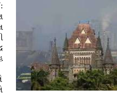
સંસ્થાઓ અને અન્ય સત્તાવાળાઓને વાયુ પ્રદૂષણ ઘટાડવા માટે પગલાં લેવા માટે અનેક નિર્દેશો આપ્યા હતા. બૃહદ્-મુંબઈ મ્યુનિસિપલ કોર્પોરેશનના વકીલ એસ. યુ. કામદારે કોર્ટને જણાવ્યું હતું કે સુધારાઈઓએ અનેક બાંધકામ સ્થળોએ કામ બંધ કરવાની નોટિસ જારી કરી છે અને ૬૦૦ સ્થળોએ જ્યાં હવા ગુણવત્તા

મુંબઈ: બોમ્બે હાઈ કોર્ટે આજે વાયુ પ્રદૂષણ ઘટાડવાના તેના આદેશોની અવગણના બદલ પાલિકાના અધિકારીઓની ઝાટકણી કાઢી હતી અને નોંધ્યું હતું કે તેઓ પણ એ જ અશુદ્ધ હવા શ્વાસમાં લઈ રહ્યા છે અને કોઈ પરગ્રહ પર નથી રહેતા. મુખ્ય ન્યાયાધીશ ચંદ્રશેખર અને ન્યાયાધીશ સુમન શ્યામની બેન્ચે મુંબઈ અને નવી મુંબઈ સુધારાઈના કમિશનરોને ચેતવણી આપી હતી કે જો તેઓ કોર્ટના આદેશોનું પાલન કરવામાં તથા વાયુ પ્રદૂષણ સુધારવાનાં પગલાં લેવામાં નિષ્ફળ જશે તો તેમનો પગાર અટકાવી દેવાશે. વર્ષ ૨૦૨૩માં કોર્ટે વધતા વાયુ પ્રદૂષણ અંગે આપમેળે નોંધ લીધી હતી અને નાગરિક