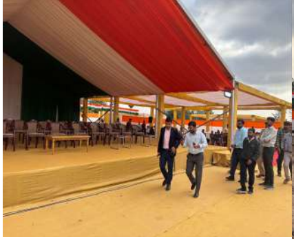
પ્રજાસત્તાક પર્વની ઉજવણી પૂર્વે જિલ્લા કલેક્ટરે આખરી તૈયારીઓનું નિરીક્ષણ કર્યું - પરેડ નિરીક્ષણ, માર્ચ પાસ્ટ, સાંસ્કૃતિક કાર્યક્રમનું રિહર્સલ યોજાયું