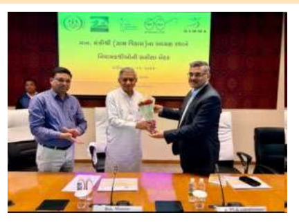
જણાવ્યું હતું કે, રાજ્યના ગામડાઓ ઈકોનોમી હબ બનશે ત્યારે જ વિકસિત ભારતનું સ્વપ્ન સાકાર થશે. જેથી ગામોને શહેર જેવા વિકસિત બનાવવા "Innovative of life" સુનિશ્ચિત કરવી મૂખ જરૂરી છે. તેમણે કહ્યું હતું કે, રાજ્યના તમામ

ગાંધીનગર, ગ્રામ વિકાસ મંત્રી કુંવરજીભાઈ બાવળીયાની અધ્યક્ષતામાં તાજેતરમાં ગાંધીનગર ખાતે ગ્રામ વિકાસ અંતર્ગત અમલીકૃત યોજનાઓની કામગીરી અંગે વ્યાપક સમીક્ષા બેઠકનું આયોજન કરવામાં આવ્યું હતું. આ બેઠકમાં મંત્રીએ પ્રધાનમંત્રી આવાસ યોજના-ગ્રામીણ(PMAY-G), સ્વચ્છ ભારત મિશન-ગ્રામીણ(SBM-G), મહાત્મા ગાંધી નરેગા(MGNREGA) અંતર્ગત કરવામાં આવતી વિવિધ કામગીરીની વિસ્તૃત માહિતી મેળવી હતી. વડાપ્રધાન નરેન્દ્રભાઈ મોદીના વિકસિત ભારતજર૦૪૭ના વિઝન પર ભાર મુકતાં ગ્રામ વિકાસ મંત્રી કુંવરજીભાઈ બાવળીયાએ