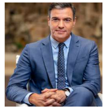
સુરક્ષા વ્યવસ્થા ગોઠવશે અને યુદ્ધમાંથી ઉદ્ભવતા સ્થળોએ પુનર્નિર્માણનું સંકલન કરશે. આ ખ્યાલ ટ્રમ્પની ગાઝા શાંતિ યોજનામાંથી ઉદ્ભવે છે. સ્વિટ્ઝર્લેન્ડના દાવોસમાં વર્લ્ડ ઈકોનોમિક ફોરમમાં આયોજિત બોર્ડના લોન્ચ સમારોહમાં કેનેડા,

સ્પેન, સ્પેન વૈશ્વિક સંઘર્ષોનો સામનો કરવા માટે યુએસ પ્રમુખ ડોનાલ્ડ ટ્રમ્પ દ્વારા શરૂ કરાયેલ બોર્ડ ઓફ પીસ પહેલમાં ભાગ લેશે નહીં, એમ કહીને કે આ નિર્ણય બહુપક્ષીયતા અને સંયુક્ત રાષ્ટ્ર પ્રણાલીમાં તેની માન્યતા સાથે સુસંગત છે. "અમે આમંત્રણની પ્રશંસા કરીએ છીએ, પરંતુ અમે નકારીએ છીએ, સ્પેનિશ વડા પ્રધાન પેડ્રો સાંચેઝે ગુરુવારે મોડી રાત્રે બ્રસેલ્સમાં ઈ સમિતિ પછી પત્રકારોને જણાવ્યું. વોશિંગ્ટન કહે છે કે આ સંસ્થા યુદ્ધવિરામમાં મધ્યસ્થી અને દેખરેખ રાખવામાં મદદ કરશે,