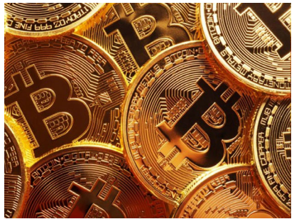
ફોરેન્સિક તપાસ દરમિયાન મ્યુચ્યુઅલ ફંડમાં કરાયેલા રોકાણ સંબંધિત દસ્તાવેજો મળી આવ્યા છે. ઉપરાંત ક્રિપ્ટો કરન્સી અને ભારતીય ચલણ રૂપે કુલ રૂ. ૧૯ કરોડની મિલકત જપ્ત કરવામાં આવી છે.