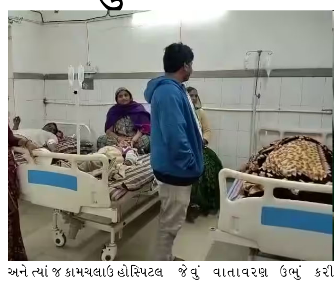
અને ત્યાં જ કામચલાઉ હોસ્પિટલ જેવું વાતાવરણ ઉભું કરી

સારવાર શરૂ કરી દેવામાં આવી હતી. આરોગ્ય વિભાગની ટીમ દોડતી થઈ ગઈ હતી. જે પૈકી ૫ લોકોની હાલત વધુ નાજુક જણાતા તેમને તાત્કાલિક ધોળકાની હોસ્પિટલમાં રીફર કરવામાં આવ્યા હતા. ઘટનાની જાણ થતા જ આરોગ્ય વિભાગની ટીમ કાફલા સાથે કૌકા ગામે પહોંચી હતી. ફૂડ એન્ડ ડ્રગ્સ વિભાગ દ્વારા ખાણી-પીણીના નમૂના લેવાની તજવીજ હાથ ધરવામાં આવી છે. હાલમાં તમામ દર્દીઓની તબિયત સ્થિર હોવાનું જાણવા મળી રહ્યું છે.