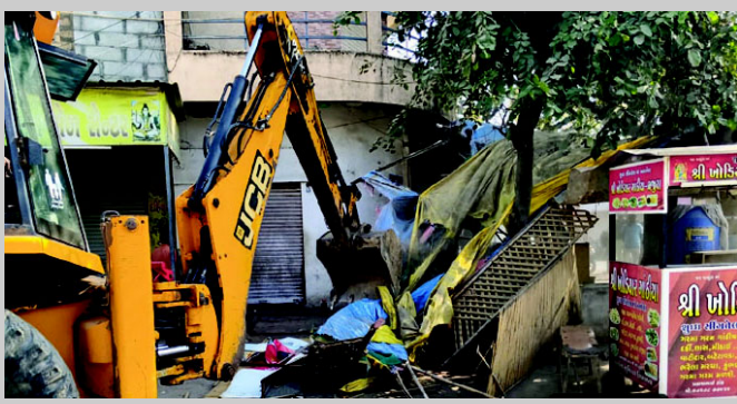
જામજોધપુર નગરપાલિકા દ્વારા

જામજોધપુર : જામજોધપુર ટાઉનમાં નગરપાલિકા દ્વારા ગઈકાલે બપોર બાદ દબાણ હટાવ ઝુંબેશ હાથ ધરવામાં આવી હતી, અને જાહેર માર્ગ પર અડચણ થાય તેવા અનેક દબાણો દૂર કરવાની કાર્યવાહી હાથ ધરવામાં આવી હતી, જેમાં જેસીબી ની મદદ લઈને આ દબાણો હટાવવાયા હતા.