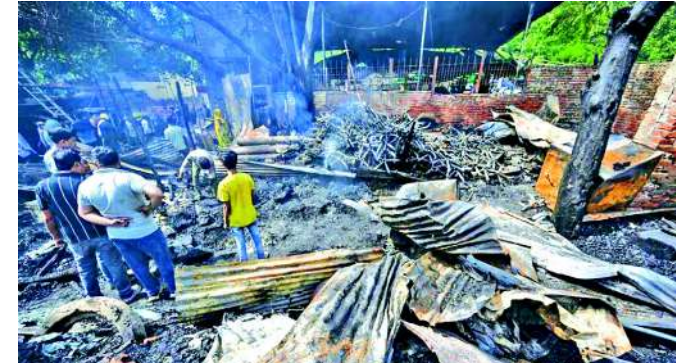
જે તે જાણી શકાયું નથી. તેમજ તપાસ કરવામાં આવી રહી છે. આ અંગે એક પોલીસ અધિકારીએ

નવી દિલ્હી દિલ્હીમાં માર્ચ માસમાં લાગેલી ભયાનક આગની દુર્ઘટના લોકો હજુ ભૂલી શક્યા નથી. ત્યારે આજે તકીયા કાલે પામાં લાગેલી આગમાં ત્રીસ ઝૂંપડા બળીને રાખ થઈ છે. આ દુર્ઘટનાની જાણ થતા જ ફાયર બ્રિગેડ ઘટના સ્થળે પહોંચી હતી અને આગને કાબુમાં લીધી હતી. જ્યારે પોલીસે ઘટના સ્થળે પહોંચીને ૧૨ લોકોના જીવ બચાવ્યા હતા. જોકે, આગ કેવી રીતે લાગી