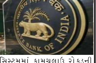
સિસ્ટમમાં કામચલાઉ રોકડની અછત અથવા અતિરેકને સંતુલિત કરે છે. નિષ્ણાતોના મતે, ગુડ્સ એન્ડ સર્વિસ ટેક્સ યુકવણીને કારણે બેંકિંગ સિસ્ટમમાંથી ભંડોળ પાછું ખેંચી લેવાને કારણે આ રોકડની અછત છે. રોકડની અછતને કારણે રાતોરાત મની માર્કેટ રેટ પર દબાણ વધ્યું છે, જ્યાં ભારતીય સરેરાશ કોલ મની રેટ ૫.૪૩ ટકા હતો, જે આરબીઆઈના રેપો રેટ કરતા ૦.૧૮ ટકા વધારે છે.

બેંકિંગ સિસ્ટમમાં ભંડોળ એકઠું થવાથી, બેંકો સામાન્ય લોકોને સરળતાથી લોન આપી શકે છે. હાલમાં, બેંકિંગ સિસ્ટમ રોકડની અછતનો સામનો કરી રહી છે. માહિતી અનુસાર, ૨૧ જૂને ૩૦,૬૮૯.૧૧ કરોડનો સરપ્લસ ૨૨ જૂને ઘટીને ૧૮,૮૭૧.૮૮ કરોડની ખામ થઈ ગઈ છે. તેથી, રિઝર્વ બેંકે આ અછતને પહોંચી વળવા માટે ૫.૨૬ ટકાના કટ-ઓફ દરે આ રકમ બેંકોમાં ઠાપલ કરી છે.