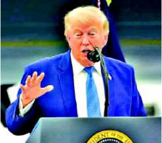
અને દેશની આંતરિક પરિસ્થિતિને કારણે અમેરિકન નાગરિકોમાં ટ્રમ્પ પ્રશાસન પ્રત્યેનો અસંતોષ સપાટી પર આવ્યો છે. 'રોયટર્સ/ઈમ્પોસ' ના તાજા પાંચ દિવસીય સર્વેક્ષણના પરિણામો ચોકવાનારા છે: ડોનાલ્ડ ટ્રમ્પનું એ પ્રુવલ રેટિંગ

પ્રસ્તાવને અર્બંધનકર્તા અને અસંવિધાનિક ગણાવ્યો છે. પ્રશાસનનું કહેવું છે કે રાષ્ટ્રીય સુરક્ષા માટે સૈન્ય પગલાં લેવાનો પ્રમુખ પાસે બંધારણીય અધિકાર છે. જો કે, ભલે આ પ્રસ્તાવથી કાનૂની અસર ન પડે, પરંતુ બંને ગૃહોમાં ડેમોક્રેટ અને રિપબ્લિકન સાંસદો દ્વારા ટ્રમ્પના યુદ્ધના અધિકારો પર સવાલ ઉઠાવવા એ વ્હાઈટ હાઉસ માટે મોટો રાજકીય ઓંચકો છે. હાલમાં બંને દેશો વચ્ચે યુદ્ધવિરામ લાગુ છે અને સ્વિટ્ઝરલેન્ડના જિનીવામાં શાંતિ કરારને લઈને બેઠકો પણ યોજાઈ ચુકી છે. ઈરાન સાથેના યુદ્ધની સ્થિતિ