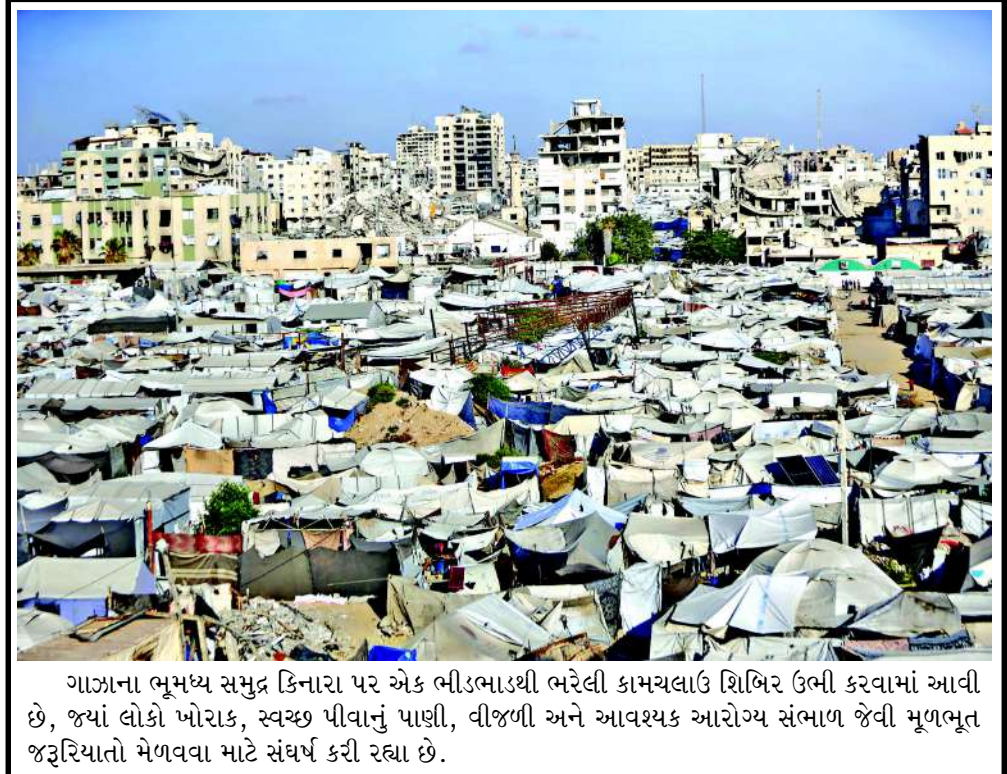
ગાઝાના ભૂમધ્ય સમુદ્ર કિનારા પર એક ભીડભાડથી ભરેલી કામચલાઉ શિબિર ઉભી કરવામાં આવી છે, જ્યાં લોકો ખોરાક, સ્વચ્છ પીવાનું પાણી, વીજળી અને આવશ્યક આરોગ્ય સંભાળ જેવી મૂળભૂત જરૂરિયાતો મેળવવા માટે સંઘર્ષ કરી રહ્યા છે.

જ મુંબઈના દરિયામાં સવારે ૮:૨૫ વાગ્યે મોટી ભરતી એટલે કે હાઈ ટાઈડ હોવાથી, જો આ સમયે પણ ભારે વરસાદ ચાલુ રહેશે તો મુંબઈમાં પાણી ભરાવાની સ્થિતિ વધુ ગંભીર બની શકે છે. આ જ કારણે પ્રશાસન દ્વારા લોકોને વગર કામે ઘરની બહાર ન નીકળવાની સલાહ આપવામાં આવી છે.