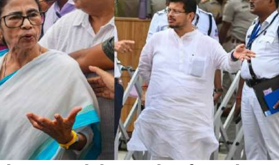
બળવાખોર ધારાસભ્યોએ મમતા બેનર્જીના સ્થાને અરૂપ રોયને તૃણમૂલ કોંગ્રેસના પ્રમુખ તરીકે નિયુક્ત કર્યા હતા. રાષ્ટ્રીય કાર્યકારી સમિતિના સભ્યોની યાદી શેર કરી. યાદીમાં પ્રમુખ તરીકે મમતા બેનર્જી, ઉપપ્રમુખ તરીકે સુબ્રત બક્ષી અને નવા પક્ષ પ્રમુખ તરીકે જાહેર કર્યા. તેમણે મમતા બેનર્જીને માર્ગદર્શકની ભૂમિકા ભજવવા વિનંતી કરી. મમતા બેનર્જીએ શનિવાર, ૨૦ જૂન સુધીના પદાધિકારીઓ અને

પશ્ચિમ બંગાળમાં રાજકીય વિરોધ અંગે આ સૌથી મોટો પ્રશ્ન બની ગયો છે. ચૂંટણી પંચને સોંપવામાં આવેલા દસ્તાવેજો/યાદીમાં, મમતા બેનર્જીએ પોતાને પાર્ટી પ્રમુખ જાહેર કર્યા છે. દરમિયાન, અલગ થઈ ગયેલા ઋતાબ્રત બેનર્જીના નેતૃત્વ હેઠળના બળવાખોર જૂથે અલગ પ્રમુખની જાહેરાત કરી છે. હવે સૌથી રસદ્ર પ્રશ્ન એ છે કે તૃણમૂલ કોંગ્રેસનો હવાલો કોણ સંભાળશે? ખરેખર, બળવાખોર ધારાસભ્યોએ મમતા બેનર્જીના સ્થાને અરૂપ રોયને તૃણમૂલ કોંગ્રેસના પ્રમુખ તરીકે નિયુક્ત કર્યા છે. જોકે, ભૂતપૂર્વ મુખ્યમંત્રી મમતા બેનર્જીએ ચૂંટણી પંચને પક્ષના અધિકારીઓની યાદી સુપરત કરી હતી, જેમાં તેમણે પોતાને તૃણમૂલ