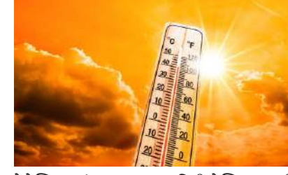
સેબેસ્ટિયનમાં તાપમાન ૪૦ ડિગ્રી સેલ્સિયસ સુધી પહોંચી ગયું છે. ફાન્સના અડધાથી વધુ ભાગમાં ૨૬ હીટવેવની શરૂઆત કરવામાં આવ્યું છે. આ અઠવાડિયે, ફાન્સમાં ગરમીથી ૧૮ લોકો મૃત્યુ પામ્યા છે, જેમાં બે નાના બાળકોનો પણ સમાવેશ થાય છે. બંને બાળકો કારની અંદર બેભાન હાલતમાં મળી આવ્યા હતા. ફાન્સ સરકારે પરિસ્થિતિની સમીક્ષા કરવા માટે કટોકટીની બેઠક બોલાવી છે.

નવીદિલ્હી, ભારતથી યુરોપ સુધી તીવ્ર ગરમી પ્રવાહી રહી છે. ગરમીએ સમગ્ર દેશમાં સામાન્ય જનજીવન ખોટી નાખ્યું છે. રાત્રિનું તાપમાન પણ સામાન્ય કરતા વધારે છે, જેના કારણે લોકો આરામ કરી શકતા નથી. મુંબઈથી એક તસવીર સામે આવી છે જ્યાં મોટી સંખ્યામાં લોકો પોતાના ઘર છોડીને વસોવા બીચ પર સૂતા જોવા મળ્યા હતા. દરમિયાન, યુરોપમાં હીટવેવને કારણે ૧૮ લોકોના મોત થયા છે.