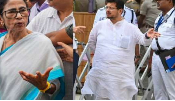
બળવાખોર ધારાસભ્યોએ મમતા બેનર્જીના સ્થાને અરૂપ રોયને તૃણમૂલ કોંગ્રેસના પ્રમુખ તરીકે નિયુક્ત કર્યા હતા. રાષ્ટ્રીય કાર્યકારી સમિતિના સભ્યોની યાદી શેર કરી. યાદીમાં પ્રમુખ તરીકે મમતા બેનર્જી, ઉપપ્રમુખ તરીકે સુબ્રત બક્ષી અને નવા પક્ષ પ્રમુખ તરીકે જાહેર કર્યા. તેમણે મમતા બેનર્જીને માર્ગદર્શકની ભૂમિકા ભજવવા વિનંતી કરી. મમતા બેનર્જીએ શનિવાર, ૨૦ જૂન સુધીના પદાધિકારીઓ અને

પશ્ચિમ બંગાળમાં રાજકીય વિરોધ અંગે આ સૌથી મોટો પ્રશ્ન બની ગયો છે. ચૂંટણી પંચને સોંપવામાં આવેલા દસ્તાવેજો/યાદીમાં, મમતા બેનર્જીએ પોતાને પાર્ટી પ્રમુખ જાહેર કર્યા છે. દરમિયાન, અલગ થઈ ગયેલા ઋતાબ્રત બેનર્જીના નેતૃત્વ હેઠળના બળવાખોર જૂથે અલગ પ્રમુખની જાહેરાત કરી છે. હવે સૌથી રસદ્ર પ્રશ્ન એ છે કે તૃણમૂલ કોંગ્રેસનો હવાલો કોણ સંભાળશે? બેનર્જી, બળવાખોર ધારાસભ્યોએ મમતા બેનર્જીના સ્થાને અરૂપ રોયને તૃણમૂલ કોંગ્રેસના પ્રમુખ તરીકે નિયુક્ત કર્યા છે. જોકે, ભૂતપૂર્વ મુખ્યમંત્રી મમતા બેનર્જીએ ચૂંટણી પંચને પક્ષના અધિકારીઓની યાદી સુપરત કરી હતી, જેમાં તેમણે પોતાને તૃણમૂલ