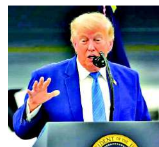
અને દેશની આંતરિક પરિસ્થિતિને કારણે અમેરિકન નાગરિકોમાં ટ્રમ્પ પ્રશાસન પ્રત્યેનો અસંતોષ સપાટી પર આવ્યો છે. 'રોયટર્સ/ઈમ્પોસ' ના તાજા પાંચ દિવસીય સર્વેક્ષણના પરિણામો ચોકવાનારા છે: ડોનાલ્ડ ટ્રમ્પનું એ પ્રુવલ રેટિંગ

પ્રસ્તાવને અર્બંધનકર્તા અને અસંવિધાનિક ગણાવ્યો છે. પ્રશાસનનું કહેવું છે કે રાષ્ટ્રીય સુરક્ષા માટે સૈન્ય પગલાં લેવાનો પ્રમુખ પાસે બંધારણીય અધિકાર છે. જો કે, ભલે આ પ્રસ્તાવથી કાનૂની અસર ન પડે, પરંતુ બંને ગૃહોમાં ડેમોક્રેટ અને રિપબ્લિકન સાંસદો દ્વારા ટ્રમ્પના યુદ્ધના અધિકારો પર સવાલ ઉઠાવવા એ વ્હાઈટ હાઉસ માટે મોટો રાજકીય ઓંચકો છે. હાલમાં બંને દેશો વચ્ચે યુદ્ધવિરામ લાગુ છે અને સ્વિટ્ઝરલેન્ડના જિનીવામાં શાંતિ કરારને લઈને બેઠકો પણ યોજાઈ ચુકી છે. ઈરાન સાથેના યુદ્ધની સ્થિતિ