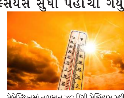
સેબેસ્ટિયનમાં તાપમાન ૪૦ ડિગ્રી સેલ્સિયસ સુધી પહોંચી ગયું છે. ફાનસના અડધાથી વધુ ભાગમાં રેડ હીટવેલ્ટજની કસ્ટોમરોમાં આવ્યું છે. આ અઠવાડિયે, ફાનસમાં ગરમીથી ૧૮ લોકો મૃત્યુ પામ્યા છે, જેમાં બે નાના બાળકોનો પણ સમાવેશ થાય છે. બંને બાળકો કારની અંદર બેભાન હાલતમાં મળી આવ્યા હતા. ફાનસ સરકારે પરિસ્થિતિની સમીક્ષા કરવા માટે કટોકટીની બેઠક બોલાવી છે.

નવીદિલ્હી, ભારતથી યુરોપ સુધી તીવ્ર ગરમી પ્રવાહી રહી છે. ગરમીએ સમગ્ર દેશમાં સામાન્ય જનજીવન ખોટી નાખ્યું છે. રાત્રિનું તાપમાન પણ સામાન્ય કરતા વધારે છે, જેના કારણે લોકો આરામ કરી શકતા નથી. મુંબઈથી એક તસવીર સામે આવી છે જ્યાં મોટી સંખ્યામાં લોકો પોતાના ઘર છોડીને વસાવા બીચ પર સૂતા જોવા મળ્યા હતા. દરમિયાન, યુરોપમાં હીટવેવને કારણે ૧૮ લોકોના મોત થયા છે.