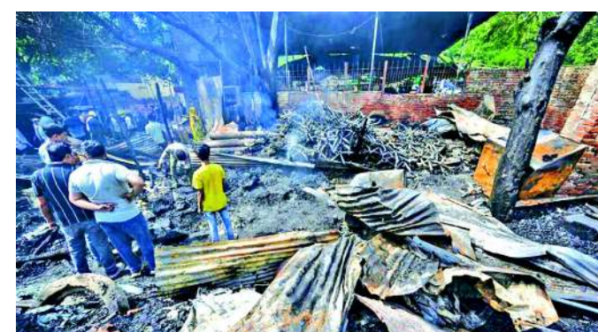
જે તે જાણી શકાયું નથી. તેમજ તપાસ કરવામાં આવી રહી છે. આ હાલ આગ લાગવાના કારણોની અંગે એક પોલીસ અધિકારીએ

નવી દિલ્હી દિલ્હીમાં માર્ચ માસમાં લાગેલી ભયાનક આગની દુર્ઘટના લોકો હજુ ભૂલી શક્યા નથી. ત્યારે આજે તકીયા કાલે પામાં લાગેલી આગમાં ત્રીસ ઝૂંપડા બળીને રાખ થઈ છે. આ દુર્ઘટનાની જાણ થતા જ ફાયર બ્રિગેડ ઘટના સ્થળે પહોંચી હતી અને આગને કાબુમાં લીધી હતી. જ્યારે પોલીસે ઘટના સ્થળે પહોંચીને ૧૨ લોકોના જીવ બચાવ્યા હતા. જોકે, આગ કેવી રીતે લાગી