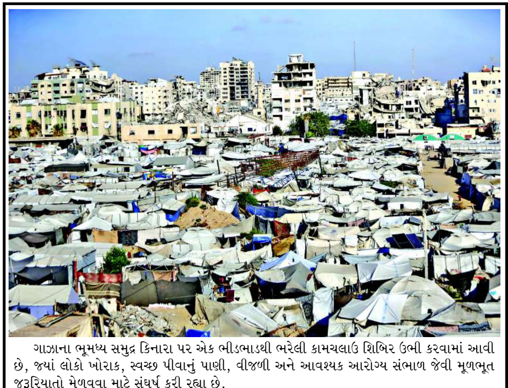
ગાઝાના ભૂમધ્ય સમુદ્ર કિનારા પર એક બીડબાડથી ભરેલી કામચલાઉ શિબિર ઉભી કરવામાં આવી છે, જ્યાં લોકો ખોરાક, સ્વચ્છ પીવાનું પાણી, વીજળી અને આવશ્યક આરોગ્ય સંભાળ જેવી મૂળભૂત જરૂરિયાતો મેળવવા માટે સંઘર્ષ કરી રહ્યા છે.

જ મુંબઈના દરિયામાં સવારે ૮:૨૫ વાગ્યે મોટી ભરતી એટલે કે હાઈ ટાઈડ હોવાથી, જો આ સમયે પણ ભારે વરસાદ ચાલુ રહેશે તો મુંબઈમાં પાણી ભરાવાની સ્થિતિ વધુ ગંભીર બની શકે છે. આ જ કારણે પ્રશાસન દ્વારા લોકોને વગર કામે ધરની બહાર ન નીકળવાની સલાહ આપવામાં આવી છે.