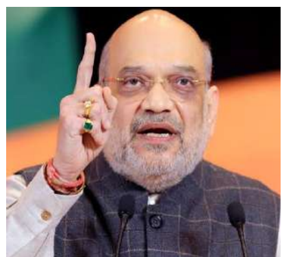
મજબૂત પાયા પર લાવી દીધું. અમિત શાહે જણાવ્યું હતું કે આજે નાફેડે ઉત્પાદન અને ખરીદી બંનેમાં નોંધપાત્ર વધારો નોંધાયો છે. દેશને કઠોળ બેત્રે આત્મનિર્ભર બનાવવા માટે, NCCF અને NAFED એ

પહેલ શરૂ કરવામાં આવી છે, જેમાં NAFEX.in, ડ્રિશ્ટી (DRISHTI), ઈઆરપી (ERP) અને નાફેડ કલ્યાણ (NAFED Kalyan)નો સમાવેશ થાય છે. તેમણે કહ્યું કે NAFEX.in અને અન્ય પહેલો અત્યંત મહત્વપૂર્ણ છે કારણ કે વર્ષ ૨૦૧૪માં નાફેડ બંધ થવાના આરંભ હતાં, પરંતુ આ પ્રયાસોને કારણે આજે નાફેડ ૩૦,૦૦૦ કરોડના ટર્નઓવર અને ૫૦૦ કરોડના નફા સાથે દેશના ૭૪ લાખથી વધુ ખેડૂતોની સેવા કરી રહ્યું છે. શાહે જણાવ્યું હતું કે જ્યારે NAFED ભારે નાણાકીય કટોકટીમાં હતું, ત્યારે પ્રધાનમંત્રી નરેન્દ્ર મોદીજીએ તેને સંપૂર્ણ પારદર્શિતા સાથે ચલાવવાનો નિર્ણય કર્યો હતો. તેમણે કહ્યું કે ભારત સરકારે નાણાકીય સહાય પૂરી પાડી અને નાફેડને ફરી એકવાર