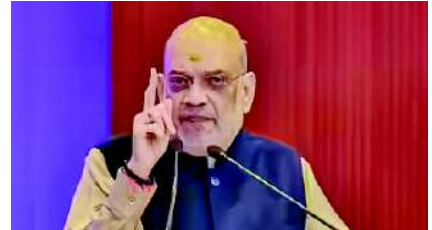
સુરક્ષા એજન્સીઓ દ્વારા પણ આ વાતની પુષ્ટિ કરવામાં આવી હતી. અહેવાલો અનુસાર, ગેરકાયદેસર ઘૂસણખોરીને સંપૂર્ણપણે નાબૂદ કરવા અને ઘૂસણખોરોને ઓળખવા અને દેશનિકાલ કરવા માટે એક અભિયાન ચાલી રહ્યું છે. સરકાર માને છે કે જો સમયમર્યાદા નક્કી કરવામાં આવે, તો બધા રાજ્યો અને એજન્સીઓ તે સમયમર્યાદામાં તેને નાબૂદ કરવા માટે મિશન મોડમાં સાથે મળીને કામ કરશે. ગૃહમંત્રી અમિત શાહે તાજેતરમાં ગુજરાત, રાજસ્થાન અને ત્રિપુરાની મુલાકાત લીધી હતી જેથી દેશમાં ઘૂસણખોરી અને ગેરકાયદેસર સ્થળાંતરનું મુલ્યાંકન કરી શકાય. અમિત શાહ પરિસ્થિતિની સમીક્ષા કરવા માટે પશ્ચિમ બંગાળની પણ મુલાકાત લેશે. હાલમાં, આ કાર્ય વિવિધ રાજ્ય સરકારો અને સુરક્ષા એજન્સીઓ સાથે ગાઢ સંકલનમાં હાથ ધરવામાં આવી રહ્યું છે.

ગેરકાયદેસર ઘૂસણખોરીને સંપૂર્ણપણે નાબૂદ કરવા અને ઘૂસણખોરોને દેશનિકાલ કરવા માટે અભિયાન નવીદિલ્હી, દેશમાંથી નક્સલવાદને લગભગ નાબૂદ કર્યા પછી, કેન્દ્રીય ગૃહમંત્રી અમિત શાહનું ધ્યાન હવે ઘૂસણખોરી રોકવા પર છે. આંતરિક સુરક્ષાને મજબૂત બનાવવા માટે, ઘૂસણખોરીને નાબૂદ કરવા માટે નક્કી કરાયેલ સમયમર્યાદા જેવી જ સમયમર્યાદા ટૂંક સમયમાં નક્સલવાદને નાબૂદ કરવા માટે નક્કી કરવામાં આવી શકે છે. શાહે દેશમાંથી નક્સલવાદને નાબૂદ કરવા માટે ૩૧ માર્ચ, ૨૦૨૬ ની સમયમર્યાદા નક્કી કરી હતી. આ સમયમર્યાદા પસાર થયા પછી, તેમણે સંસદને માહિતી આપી હતી કે દેશમાંથી નક્સલવાદ લગભગ નાબૂદ થઈ ગયો છે.