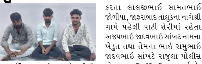
(મિલાપ રૂપારેલ દ્વારા) અમરેલી: અમરેલી પોલીસ

સ્વીકારવામાં આવી નથી. આજે લાખો યુવાનો પોતાના ભવિષ્ય અંગે ચિંતિત છે અને સરકાર તેમની પીડા પ્રત્યે સંવેદનશીલ દેખાતી નથી. ભારતમાં NEET, JEE, UPSC, SSC, RRB સહિતની સ્પર્ધાત્મક તથા અન્ય મહત્વની પરીક્ષાઓની તૈયારી પાછળ વિદ્યાર્થીઓ અને વાલીઓ દ્વારા કરવામાં આવતો કુલ ખર્ચ અંદાજે રૂ. ૩.૫ લાખ કરોડ જેટલો હોવાનો માનવામાં આવે છે, જે કેન્દ્રીય સરકારના વાર્ષિક શિક્ષણ બજેટ કરતાં અનેકગણો વધારે છે. આ આંકડો દર્શાવે છે કે દેશના પરિવારો શિક્ષણ અને ભવિષ્ય માટે કેટલું મોટું આર્થિક રોકાણ કરે છે. દેશના વિવિધ ભાગોમાં તથા ગુજરાતમાં પણ પરીક્ષા સંબંધિત તથાવા કારણે વિદ્યાર્થીઓએ આત્મહત્યા કર્યાના બનાવો સામે આવ્યા છે, જે અત્યંત ચિંતાજનક છે. રાહુલ ગાંધીના નેતૃત્વ અને માર્ગદર્શન હેઠળ કોંગ્રેસ પાર્ટી શિક્ષણ વ્યવસ્થામાં જરૂરી સુધારા, પરીક્ષા વ્યવસ્થામાં પારદર્શિતા, પેપર લીક અને ભરતી કૌભાંડ સામે કડક કાર્યવાહી તેમજ શિક્ષણના નામે થતી ઉઘાડી લુંટને રોકવા માટે રાજ્યવ્યાપી અભિયાન ચલાવશે. વિદ્યાર્થીઓના પ્રશ્નો અને યુવાનોના ભવિષ્ય સાથે જોડાયેલા મુદ્દાઓને લઈને કોંગ્રેસ સતત લડત આપતી રહેશે. વિદ્યાર્થીઓના પ્રશ્નો, સૂચનો, ફરિયાદો અને શિક્ષણ વ્યવસ્થાને લગતી ચિંતાઓને વાચા આપવામાં આવશે. જિલ્લા સ્તરે વિદ્યાર્થીઓના અવાજને મજબૂત રીતે ઉઠાવી સરકાર સુધી પહોંચાડવાનો પ્રયાસ કરવામાં આવશે.