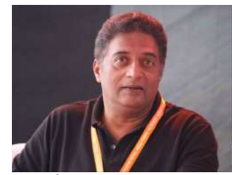
અભિનેતા વિરુદ્ધ આ કડક કાર્યવાહી કરી છે. કોર્ટે જણાવ્યું છે કે આ કેસમાં પ્રકાશ રાજને વારંવાર કાનૂની સમન્સ જારી કરવામાં આવ્યા હતા, જેમાં તેમને કોર્ટમાં હાજર થવાનો નિર્દેશ આપવામાં આવ્યો હતો. આમ રાખવાના આરોપો સાથે સંબંધિત છે, અને વારંવાર સમન્સ છતાં તેઓ કોર્ટમાં હાજર થવામાં નિષ્ફળ રહ્યા. અહેવાલ મુજબ, બેંગ્લુરુની ૪૮મી એડિશનલ ચીફ જ્યુડિશિયલ મેજિસ્ટ્રેટ કોર્ટે

કોર્ટમાં હાજર ન થવા બદલ અભિનેતા પ્રકાશ રાજ વિરુદ્ધ બિનજામીનપાત્ર વોરંટ જારી કરાયું બેંગ્લુરુ, પ્રખ્યાત અભિનેતા પ્રકાશ રાજ હાલમાં તેમની ફિલ્મો કરતાં વિવાદો માટે વધુ સમાચારમાં છે. થોડા દિવસો પહેલા, તેમણે ધર્મસ્થળ મંદિર સંબંધિત કેસમાં પોતાનું સ્થાન સ્વજ કરવા માટે એક પ્રેસ કોન્ફરન્સ યોજાઈ હતી, પરંતુ તે વિવાદ શાંત થાય તે પહેલાં, તેઓ એક નવી કાનૂની મુશ્કેલીમાં ફસાઈ ગયા છે. બેંગ્લુરુની એક મેજિસ્ટ્રેટ કોર્ટે તેમના વિરુદ્ધ બિનજામીનપાત્ર વોરંટ જારી કર્યું છે. આ કેસ અનેક રાજ્યોમાં મતદાર ઓળખ કાર્ડ રાખવાના આરોપો સાથે સંબંધિત છે, અને વારંવાર સમન્સ છતાં તેઓ કોર્ટમાં હાજર થવામાં નિષ્ફળ રહ્યા. અહેવાલ મુજબ, બેંગ્લુરુની ૪૮મી એડિશનલ ચીફ જ્યુડિશિયલ મેજિસ્ટ્રેટ કોર્ટે