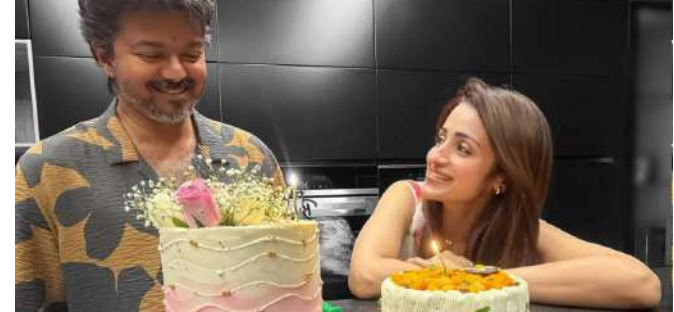
અટકળોનો અંત લાવી દીધો છે, જે તે દિવસની બધી અટકળો અને ચર્ચાઓને સંપૂર્ણપણે ફગાવી દે છે. ત્રિશાની પોસ્ટમાં બંને વચ્ચેના ઊંડા બંધન અને એકબીજાને જોવાની તેમની રીત દર્શાવવામાં આવી હતી, જેને ચાહકો અવગણી શકતા ન હતા. આ કોટમાં, ત્રિશા વિજય સાથે જોવા મળે છે. કોટા સાથે તેણે જે કેપ્શન લખ્યું છે તેણે બધાના દિલ

હેદરાબાદ, ચાહકો હંમેશા સુપરસ્ટાર વિજયના જન્મદિવસને તહેવારની જેમ ઉજવે છે. તેમના જન્મદિવસ પર સવારથી જ શુભેચ્છાઓનો વરસાદ જોવા મળ્યો. ફિલ્મ સ્ટાર્સથી લઈને વિશ્વભરના પ્રખ્યાત રાજકારણીઓ અને તેમના ચાહકો સુધી, સોશિયલ મીડિયા શુભેચ્છાઓથી છલકાઈ ગયું હતું. આ બધા વચ્ચે, ઈન્ટરનેટ પર એક શાંતિ છવાઈ ગઈ જેણે બધાનું ધ્યાન ખેંચ્યું. વિજયના સૌથી નજીકના મિત્રો અને તેમના પ્રિય ઓન-સ્ક્રીન કો-સ્ટાર ત્રિશા કૃષ્ણને આખો દિવસ વિજય વિશે કોઈ પોસ્ટ શેર કરી ન હતી. આનાથી સોશિયલ મીડિયા પર અટકળો અને ગપસપનો માહોલ સર્જાયો. જોકે, ત્રિશાએ હવે તમિલનાડુના મુખ્યમંત્રી માટે એક ખાસ સંદેશ શેર કરીને બધી