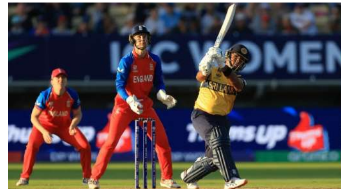
કર્યું અને ૯ વિકેટથી મેચ જીતી લીધી. મહિલા ટી ૨૦ વર્લ્ડ કપના ઇતિહાસમાં આ પહેલી વાર છે જ્યારે કોઈ બેટ્સમેને લક્ષ્યનો પીછો કરતી વખતે સદી ફટકારી હોય. અગાઉ, સફળ રન ચેઝમાં સૌથી વધુ સ્કોર વેસ્ટ ઈન્ડિઝની શેમન કેમ્પબેલના નામે હતો, જેણે તે જ ટુર્નામેન્ટમાં ન્યૂઝીલેન્ડ સામે અણનમ ૯૦ રન બનાવ્યા હતા. અટાપટ્ટુએ ઈનિંગની શરૂઆતથી જ આક્રમક અભિગમ અપનાવ્યો. તેણી અને ઈમેશા

બ્રિસ્ટલ, શ્રીલંકાની કેપ્ટન ચમારી અટાપટ્ટુએ આઈસીસી મહિલા ટી ૨૦ વર્લ્ડ કપમાં ઇતિહાસ રચ્યો. બ્રિસ્ટલમાં કાઉન્ટી ગ્રાઉન્ડ ખાતે આયર્લેન્ડ સામે ચુપ બી મેચમાં, તેણીએ શાનદાર અણનમ ૧૦૬ રન બનાવ્યા, જે એક એવો રેકોર્ડ છે જે પહેલાં કોઈ અન્ય ખેલાડીએ હાંસલ કર્યો ન હતો. ૩૬ વર્ષીય ડાબી બેટ્સમેનને ૧૩૧ રનના લક્ષ્યનો પીછો કરતી વખતે માત્ર ૬૧ બોલમાં ૧૦૬ રન બનાવ્યા. તેની ઈનિંગમાં ૧૭ ચોગ્ગા અને બે શાનદાર છગ્ગાનો સમાવેશ થતો હતો. અટાપટ્ટુની વિસ્ફોટક બેટિંગને કારણે શ્રીલંકાએ માત્ર એક વિકેટ ગુમાવીને લક્ષ્ય હાંસલ