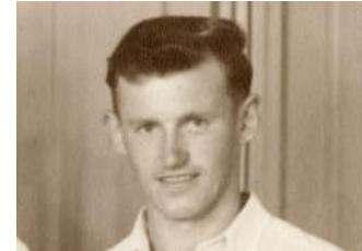
નોટિંગહામ, ન્યૂઝીલેન્ડના ભૂતપૂર્વ ફાસ્ટ બોલર મેટ હેનરી ઈંગ્લેન્ડમાં અવસાન થયું છે. બ્લેર, જેમણે તેમના ૮૪મા જન્મદિવસે અવસાન પામ્યા હતા, તેઓ માત્ર એક ક્રિકેટર જ નહીં પરંતુ હિંમત, સંઘર્ષ અને ખેલદિલીનું ઉદાહરણ હતા. ન્યૂઝીલેન્ડ ક્રિકેટ બોર્ડે બ્લેરના નિધન પર ઊંડી શોક વ્યક્ત કરી છે. તેમની યાદમાં, ન્યૂઝીલેન્ડની ટીમ નોટિંગહામમાં ઈંગ્લેન્ડ સામેની ત્રીજા ટેસ્ટના પહેલા દિવસે કાળી પટ્ટી બાંધશે. બ્લેરે ૧૯૫૨ થી ૧૯૬૪ દરમિયાન ન્યૂઝીલેન્ડ માટે ૧૯ ટેસ્ટ મેચ રમી હતી અને ૪૩ વિકેટ લીધી હતી. ડોમેસ્ટિક ક્રિકેટમાં તેમનો રેકોર્ડ વધુ પ્રભાવશાળી હતો, તેમણે ૫૯ ફર્સ્ટ-ક્લાસ મેચોમાં

ટેસ્ટ બોલરોના રેકોર્ડમાં નંબર ૧ સ્થાન મેળવનાર તેના દેશનો માત્ર ત્રીજો ખેલાડી બન્યો છે. તેણે ઓવલ ખાતે ઈંગ્લેન્ડ સામેની બીજા ટેસ્ટમાં મેચ-વિનિંગ ૧૧ વિકેટ લીધા બાદ ટોચ પર ભારતના જસપ્રીત બુમરાહની બરાબરી કરી હતી. નવેમ્બર ૨૦૨૪ માં દક્ષિણ આફ્રિકાના કાગોસો રબાડાને ટોચનું સ્થાન જાળવી રાખ્યું હતું, પરંતુ હેનરીના પ્રભાવશાળી પ્રદર્શનથી ન્યૂઝીલેન્ડને ઈંગ્લેન્ડ સામેની ત્રણ મેચની ઝંઝૂલ વર્લ્ડ ટેસ્ટ ચેમ્પિયનશિપ શ્રેણી ૧-૧ થી ડ્રો કરવામાં મદદ મળી, જેનાથી તેઓ ટોચનું સ્થાન મેળવી શક્યા.