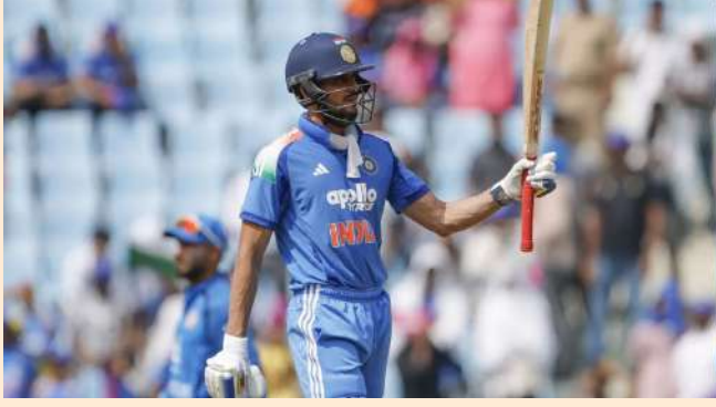
નવીદિલ્હી, બધા ફોર્મેટમાં તેના પ્રભાવશાળી પ્રદર્શનને કારણે, ભારતીય ઓપનર શુભમન ગિલ નવીનતમ આઈસીસી વનડે બેટિંગ રેકોર્ડમાં બીજા સ્થાને પહોંચી ગયો છે. દરમિયાન, ન્યૂઝીલેન્ડના ફાસ્ટ બોલર મેટ હેનરીએ ટેસ્ટ બોલિંગ રેકોર્ડમાં ભારતના જસપ્રીત બુમરાહ સાથે ટોચનું સ્થાન શેર કર્યું છે. ટેસ્ટ બેટિંગ રેકોર્ડમાં ટોચના

ન્યૂઝીલેન્ડના ફાસ્ટ બોલર મેટ હેનરીએ ટેસ્ટ બોલિંગ રેકોર્ડમાં ભારતના જસપ્રીત બુમરાહની બરાબરી કરી