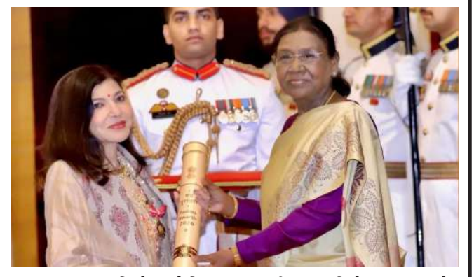
મુંબઈ, હિન્દી સિનેમાની પ્રખ્યાત પ્લેબેક સિંગર, અલકા યાજ્ઞિક, "મેલાડીની રાણી" તરીકે પણ ઓળખાય છે. તેમણે ચાર દાયકાથી વધુ સમય સુધી બોલિવૂડ પ્લેબેક સિંગિંગની દુનિયામાં પ્રભુત્વ જમાવ્યું. ભારતીય સંગીતમાં તેમના મહત્વપૂર્ણ યોગદાન બદલ ૨૩ જૂન, ૨૦૨૬, મંગળવારના રોજ રાષ્ટ્રપતિ ભવનમાં રાષ્ટ્રપતિ દ્રોપદી મુર્મુ દ્વારા તેમને પદ્મ ભૂષણથી સન્માનિત કરવામાં આવ્યા હતા. સમારોહમાં તેમની હાજરીથી અલકામાં તેમના સ્વાસ્થ્ય અંગે ચિંતા વધી ગઈ હતી, જેના કારણે ગાયિકાએ ભાવાનાત્મક પોસ્ટ શેર કરી અને સ્વાસ્થ્ય અપડેટ આપ્યા. મારી સફર વિશે ઘણું બધું શેર કરવાથી દૂર રહી છું. તમારામાંથી ઘણા લોકો જાણે છે કે હું ઘણી સ્વાસ્થ્ય સમસ્યાઓમાંથી પસાર થઈ રહી છું, અને આ સમય દરમિયાન, તમારા પ્રેમ, પ્રાર્થના, સંદેશાઓ અને અવિરત સમર્થન મને દરેક પગલે ટેકો આપ્યો છે.

મુંબઈ, હિન્દી સિનેમાની પ્રખ્યાત પ્લેબેક સિંગર, અલકા યાજ્ઞિક, "મેલાડીની રાણી" તરીકે પણ ઓળખાય છે. તેમણે ચાર દાયકાથી વધુ સમય સુધી બોલિવૂડ પ્લેબેક સિંગિંગની દુનિયામાં પ્રભુત્વ જમાવ્યું. ભારતીય સંગીતમાં તેમના મહત્વપૂર્ણ યોગદાન બદલ ૨૩ જૂન, ૨૦૨૬, મંગળવારના રોજ રાષ્ટ્રપતિ ભવનમાં રાષ્ટ્રપતિ દ્રોપદી મુર્મુ દ્વારા તેમને પદ્મ ભૂષણથી સન્માનિત કરવામાં આવ્યા હતા. સમારોહમાં તેમની હાજરીથી અલકામાં તેમના સ્વાસ્થ્ય અંગે ચિંતા વધી ગઈ હતી, જેના કારણે ગાયિકાએ ભાવાનાત્મક પોસ્ટ શેર કરી અને સ્વાસ્થ્ય અપડેટ આપ્યા.