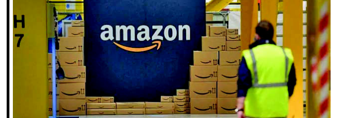
આઈટી હબમાં કામ કરતા કર્મચારીઓમાં ફફડાટ

એમેઝોનના નિર્ણયથી બેંગલુરુ અને હૈદરાબાદ જેવા આઈટી હબમાં કામ કરતા કર્મચારીઓમાં ફફડાટ