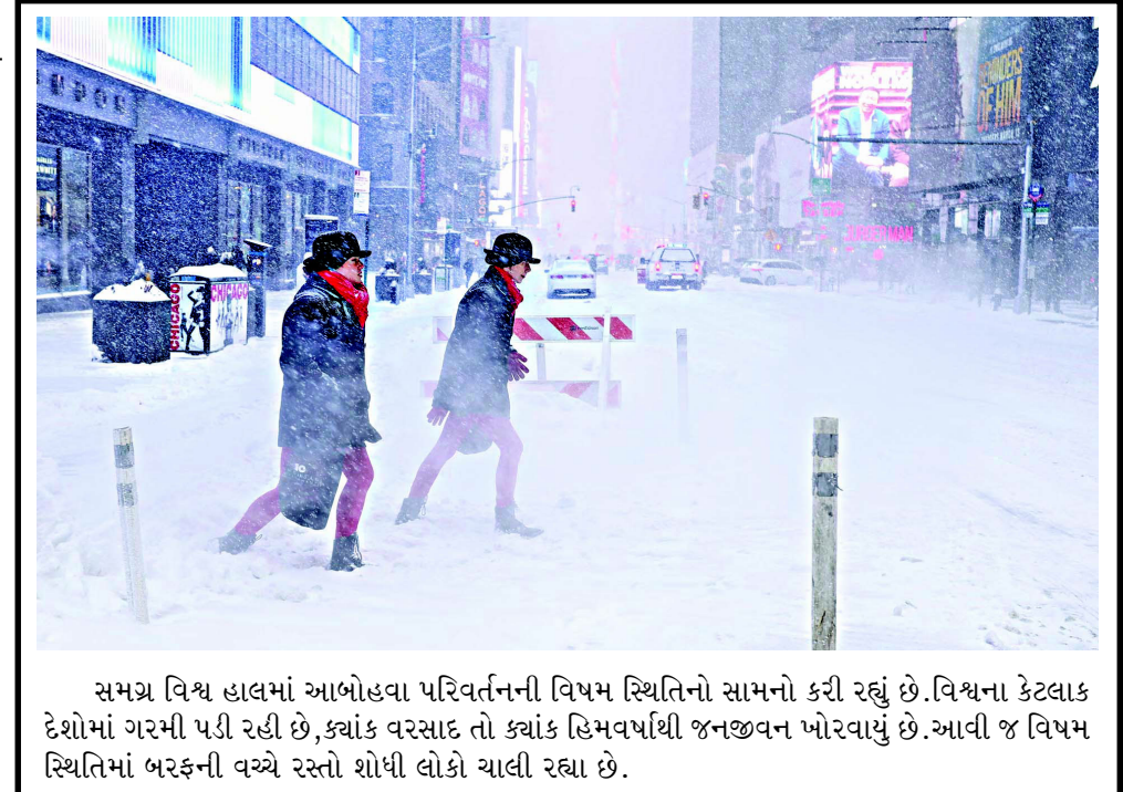
સમગ્ર વિશ્વ હાલમાં આબોહવા પરિવર્તનની વિષમ સ્થિતિનો સામનો કરી રહ્યું છે. વિશ્વના કેટલાક દેશોમાં ગરમી પડી રહી છે, ક્યાંક વરસાદ તો ક્યાંક હિમવર્ષાથી જનજીવન ખોરવાયું છે. આવી જ વિષમ સ્થિતિમાં બરફની વચ્ચે રસ્તો શોધી લોકો ચાલી રહ્યા છે.

અબજ લોકો અને યુરોપિયન દેશોના લાખો લોકો માટે અપાર તકો લઈને આવ્યો છે. તે વિશ્વની બે સૌથી મોટી અર્થવ્યવસ્થાઓ વચ્ચે સંકલનનું એક ઉત્તમ ઉદાહરણ બની ગયું છે. આ કરાર વૈશ્વિક ઊડીપીના લગભગ ૨૫ ટકા અને વૈશ્વિક વેપારના એક તૃતીયાંશ ભાગનું પ્રતિનિધિત્વ કરે છે. પ્રધાનમંત્રીએ કહ્યું કે ભારત અને યુરોપિયન વચ્ચેનો કરાર વેપાર તેમજ લોકશાહી અને કાયદાના શાસન પ્રત્યેની અમારી સહિયારી પ્રતિબદ્ધતાને પુનઃપુષ્ટિ કરે છે. યુરોપિયન યુનિયન સાથેનો આ મુક્ત વેપાર કરાર બ્રિટન અને એશિયા-પેસિફિક વેપાર કરારને પણ મદદ કરશે.