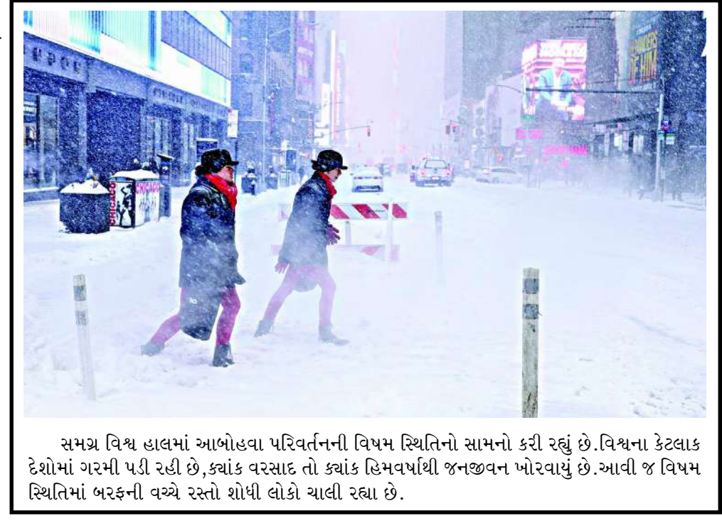
સમગ્ર વિશ્વ હાલમાં આબોહવા પરિવર્તનની વિષમ સ્થિતિનો સામનો કરી રહ્યું છે. વિશ્વના કેટલાક દેશોમાં ગરમી પડી રહી છે, ક્યાંક વરસાદ તો ક્યાંક હિમવર્ષાથી જનજીવન ખોરવાયું છે. આવી જ વિષમ સ્થિતિમાં બરફની વચ્ચે રસ્તો શોધી લોકો ચાલી રહ્યા છે.

અબજ લોકો અને યુરોપિયન દેશોના લાખો લોકો માટે અપાર તકો લઈને આવ્યો છે. તે વિશ્વની બે સૌથી મોટી અર્થવ્યવસ્થાઓ વચ્ચે સંકલનનું એક ઉત્તમ ઉદાહરણ બની ગયું છે. આ કરાર વૈશ્વિક ઊડીપીના લગભગ ૨૫ ટકા અને વૈશ્વિક વેપારના એક તૃતીયાંશ ભાગનું પ્રતિનિધિત્વ કરે છે. પ્રધાનમંત્રીએ કહ્યું કે ભારત અને યુરોપીયન વચ્ચેનો કરાર વેપાર તેમજ લોકશાહી અને કાયદાના શાસન પ્રત્યેની અમારી સહિયારી પ્રતિબદ્ધતાને પુનઃપુષ્ટિ કરે છે. યુરોપિયન યુનિયન સાથેનો આ મુક્ત વેપાર કરાર બ્રિટન અને એશિયા-પેસિફિક વેપાર કરારને પણ મદદ કરશે.