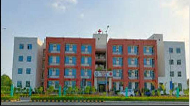
દુર્લભ કેન્સર છે. તેમને પ્રોક્સિમલ ટિબિયા (પગનું ઉપરનું હાડકું)નું 'પ્રાઈમરી નોન-હોજાકિન્સી લિમ્ફોમા' હતું અને તેના કારણે પેથોલોજિકલ ફેકચર પણ થયું હતું. સારવાર અને જટિલ સર્જરી નિદાન બાદ પ્રથમ તબક્કામાં દર્દીને કીમોથેરાપી આપવામાં આવી હતી. કીમોથેરાપી પૂર્ણ