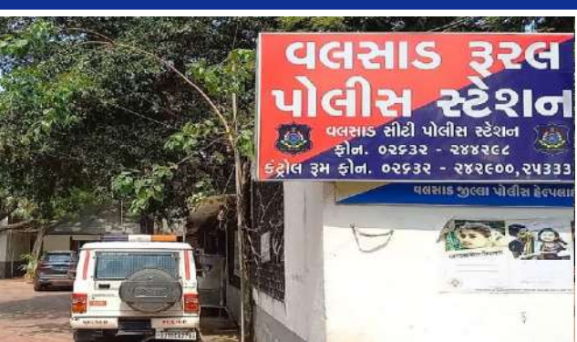
આરોપીની તપાસ હાથ ધરવામાં આવી હતી. અઠવાડિયા બાદ પોલીસે આરોપી યુવકની મુંબઈથી ધરપકડ કરી હતી અને તેને વલસાડ લાવવામાં આવ્યો હતો. પોલીસને યુવતી પણ મળી આવી હતી અને તેના પરિવારને સોંપી દેવામાં આવી હતી. જેનાથી પરિવારજનોએ રાહતનો શ્વાસ લીધો હતો. ગ્રામીણોએ આ મામલે યુવક સામે લવ જિહાદનો પણ આરોપ લગાવ્યો હતો. વલસાડના એસપીએ જણાવ્યું કે, આ મામલે આરોપી સામે અપહરણ અને પોક્સો એક્ટ અંતર્ગત કેસ નોંધીને આગળની કાર્યવાહી કરવામાં આવી હતી.

વલસાડ, વલસાડ જિલ્લાના એક ગામમાંથી ૧૯ જાન્યુઆરીએ યુવતીના અપહરણનો મામલો સામે આવ્યો હતો. જે બાદ તણાવનો માહોલ હતો. ઘટનાને લઈ પરિવારજનો અને સ્થાનિકોમાં આકોશ ફેલાયો હતો. આ મુદ્દે ધરમપુર પોલીસે તાત્કાલિક તપાસ શરૂ કરી હતી. ઘટનાની ગંભીરતા જોતા પોલીસે અનેક ટીમો બનાવી હતી. જેમાં એલસીબી, એસઓજી અને સ્થાનિક પોલીસ પણ સામેલ હતી. આરોપીના પરિવારજનો, મિત્રો, સંબંધીઓ અને સોશિયલ મીડિયા ગતિવિધિની તપાસ કરવામાં આવી હતી. ઉપરાંત મોબાઈલ લોકેશનના આધારે