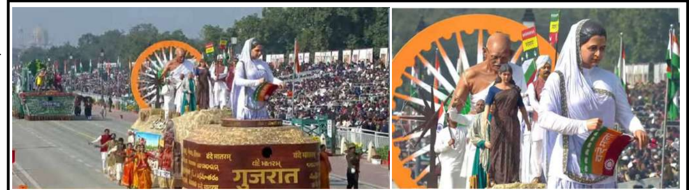
૭૭મા પ્રજાસત્તાક પર્વમાં ગુજરાતના ટેલોનું મુખ્ય આકર્ષણ; "સ્વતંત્રતા કા મંત્ર : વંદે માતરમ"ના વિષયને અનુલક્ષીને ભારતીય રાષ્ટ્રધ્વજની નિર્માણયાત્રા, તેની બદલાતી તાસીર અને તવારીખની રોચક પ્રસ્તુતિ... મેડમ ભીખાઈજી કામાએ તૈયાર કરેલા 'વંદે માતરમ' લિખિત ધ્વજની યશોગાથાનું વર્ણન, 'ચરખા'ના માધ્યમથી સ્વદેશીનો મંત્ર આપનારા મહાત્મા ગાંધીજીની સ્મૃતિ સાથે પ્રવર્તમાન 'આત્મનિર્ભર ભારત' અભિયાનનો સમન્વયે આ ટેલોની અનોખી ભાત ઊભી કરી... આ વર્ષે પ્રજાસત્તાક પર્વની પરેડમાં ૧૭ રાજ્યો અને કેન્દ્રશાસિત પ્રદેશો તથા કેન્દ્ર સરકારના વિવિધ વિભાગોની ૧૩ ઝાંખીઓ મળીને કુલ ૩૦ ટેલોનું પ્રદર્શન થયું; મુખ્ય અતિથિ તરીકે યુરોપિયન યુનિયનના બે વરિષ્ઠ નેતા : યુરોપિયન કમિશનના પ્રમુખ ઉર્સુલા વોન ડેર લાયેન તથા યુરોપિયન કાઉન્સિલના પ્રમુખ એન્ડ્રોનિયો કોસ્ટા ઉપસ્થિત રહ્યા હતા.

સ્થાનિકો દ્વારા યુવાનને બચાવવાનો પ્રયાસ કરાયો પણ તે પહેલા જ ચાલકનું મોત થયું બાવળ, મહેરિયા બહાર નીકળી શક્યો ન હતો અને કારની સાથે જ પાણીમાં ડૂબી ગયો હતો. આ બનાવની જાણ થતા જ સ્થાનિક પોલીસનો કાર્ફો ઘટના સ્થળે પહોંચી ગયો હતો. પોલીસે યુવાનના મૃતદેહને પોસ્ટમોર્ટમ (પે) અર્થે હોસ્પિટલ ખસેડ્યો છે. રાત્રિના અંધારામાં આ અકસ્માત કયા કારણોસર સર્જાયો, શું તે ગાઢ ધુમ્મસ, પૂરપાટ ઝડપ કે અન્ય કોઈ કારણ હતું, તે અંગે પોલીસે વધુ તપાસ હાથ ધરી છે. આ ઘટનાને પગલે ઝેકડા ગામ અને મૃતક યુવાનના પરિવારમાં શોકનું મોજું ફરી વળ્યું છે. બાવળ તાલુકાના ઝેકડા રોડ પર મોડી રાત્રે કાર રોડ સાઈડના તળાવમાં ખાબકી હતી. આ અકસ્માતમાં કાર પાણીમાં ગરકાવ થઈ જતા યુવાનનું ડૂબી જવાથી મોત નિપજ્યું હતું. પ્રકાશ મહેરિયા નામનો યુવાન મોડી રાત્રે પોતાની કાર લઈને ઝેકડા ગામે સ્થિત પોતાના ઘરે જઈ રહ્યો હતો. આ દરમિયાન ઝેકડા રોડ પર અચાનક કાર પરનો કાબૂ ગુમાવતા કાર સીધી રોડની બાજુમાં આવેલા પાણીથી છલોછલ તળાવમાં ખાબકી હતી. કાર ઊંડા પાણીમાં ઉતરી જતાં પ્રકાશ