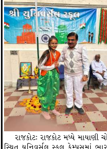
રાજકોટ: રાજકોટ મધ્યે માયાણી ચોક સ્થિત યુનિવર્સલ સ્કૂલ કેમ્પસમાં ભારત