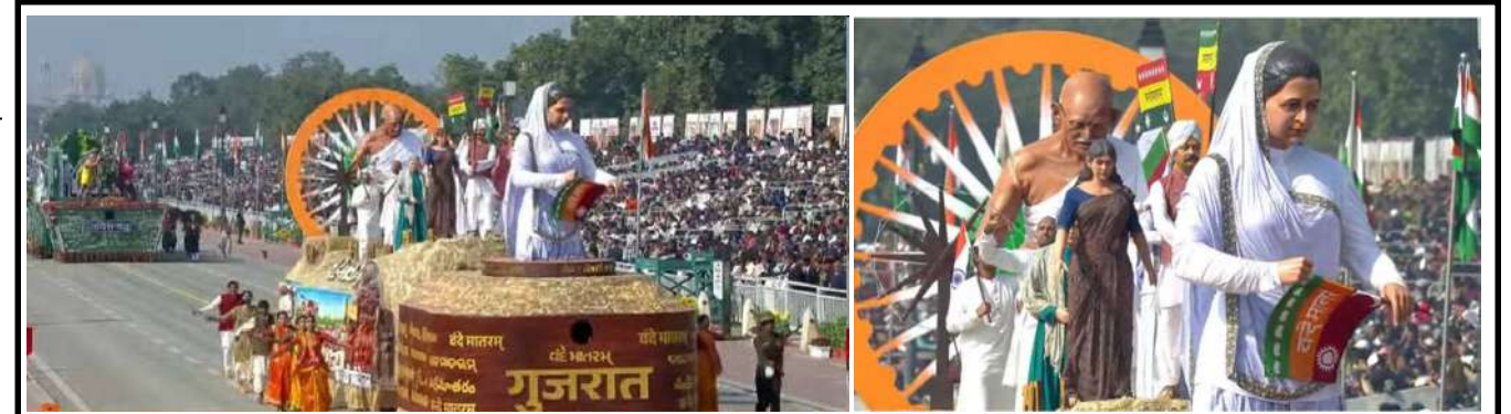
૭૭મા પ્રજાસત્તાક પર્વમાં ગુજરાતના ટેલોનું મુખ્ય આકર્ષણ; "સ્વતંત્રતા કા મંત્ર : વંદે માતરમ"ના વિષયને અનુલક્ષીને ભારતીય રાષ્ટ્રધ્વજની નિર્માણયાત્રા, તેની બદલાતી તાસીર અને તવારીખની રોચક પ્રસ્તુતિ... મેડમ ભીખાઈજી કામાએ તૈયાર કરેલા 'વંદે માતરમ' લિખિત ધ્વજની યશોગાથાનું વર્ણન, 'ચરખા'ના માધ્યમથી સ્વદેશીનો મંત્ર આપનારા મહાત્મા ગાંધીજીની સ્મૃતિ સાથે પ્રવર્તમાન 'આત્મનિર્ભર ભારત' અભિયાનનો સમન્વયે આ ટેલોની અનોખી ભાત ઊભી કરી... આ વર્ષે પ્રજાસત્તાક પર્વની પરેડમાં ૧૭ રાજ્યો અને કેન્દ્રશાસિત પ્રદેશો તથા કેન્દ્ર સરકારના વિવિધ વિભાગોની ૧૩ ઝાંખીઓ મળીને કુલ ૩૦ ટેલોનું પ્રદર્શન થયું; મુખ્ય અતિથિ તરીકે યુરોપિયન યુનિયનના બે વરિષ્ઠ નેતા : યુરોપિયન કમિશનના પ્રમુખ ઉર્સુલા વોન ડેર લાયેન તથા યુરોપિયન કાઉન્સિલના પ્રમુખ એન્ડ્રોનિયો કોસ્ટા ઉપસ્થિત રહ્યા હતા.

સ્થાનિકો દ્વારા યુવાનને બચાવવાનો પ્રયાસ કરાયો પણ તે પહેલા જ ચાલકનું મોત થયું બાવળ, મહેરિયા બહાર નીકળી શક્યો ન હતો અને કારની સાથે જ પાણીમાં ડૂબી ગયો હતો. આ બનાવની જાણ થતા જ સ્થાનિક પોલીસનો કાર્ફો ઘટના સ્થળે પહોંચી ગયો હતો. પોલીસે યુવાનના મૃતદેહને પોસ્ટમોર્ટમ (પે) અર્થે હોસ્પિટલ ખસેડ્યો છે. રાત્રિના અંધારામાં આ અકસ્માત કયા કારણોસર સર્જાયો, શું તે ગાઢ ધુમ્મસ, પૂરપાટ ઝડપ કે અન્ય કોઈ કારણ હતું, તે અંગે પોલીસે વધુ તપાસ હાથ ધરી છે. આ ઘટનાને પગલે ઝેકડા ગામ અને મૃતક યુવાનના પરિવારમાં શોકનું મોજું ફરી વળ્યું છે.