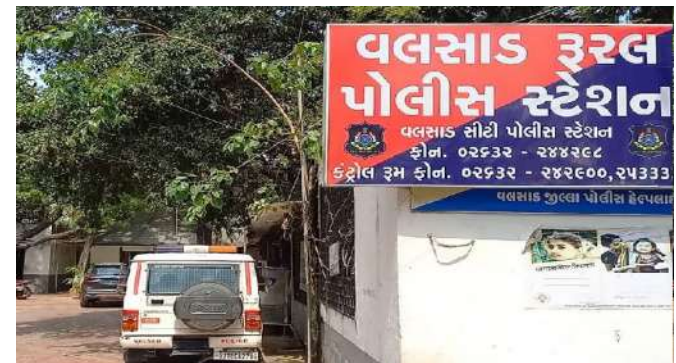
આરોપીની તપાસ હાથ ધરવામાં આવી હતી. અઠવાડિયા બાદ પોલીસે આરોપી યુવકની મુંબઈથી ધરપકડ કરી હતી અને તેને વલસાડ લાવવામાં આવ્યો હતો. પોલીસને યુવતી પણ મળી આવી હતી અને તેના પરિવારને સોંપી દેવામાં આવી હતી. જેનાથી પરિવારજનોએ રાહતનો શ્વાસ લીધો હતો. ગ્રામીણોએ આ મામલે યુવક સામે લવ જિહાદનો પણ આરોપ લગાવ્યો હતો. વલસાડના એસપીએ જણાવ્યું કે, આ મામલે આરોપી સામે અપહરણ અને પોક્સો એક્ટ અંતર્ગત કેસ નોંધીને આગળની કાર્યવાહી કરવામાં આવી હતી.

વલસાડ, વલસાડ જિલ્લાના એક ગામમાંથી ૧૮ જાન્યુઆરીએ યુવતીના અપહરણનો મામલો સામે આવ્યો હતો. જે બાદ તપાસનો માહોલ હતો. ઘટનાને લઈ પરિવારજનો અને સ્થાનિકોમાં આકોશ ફેલાયો હતો. આ મુદ્દે ધરમપુર પોલીસે તાત્કાલિક તપાસ શરૂ કરી હતી. ઘટનાની ગંભીરતા જોતા પોલીસે અનેક ટીમો બનાવી હતી. જેમાં એલસીબી, એસઓજી અને સ્થાનિક પોલીસ પણ સામેલ હતી. આરોપીના પરિવારજનો, મિત્રો, સંબંધીઓ અને સોશિયલ મીડિયા ગતિવિધિની તપાસ કરવામાં આવી હતી. ઉપરાંત મોબાઈલ લોકેશનના આધારે