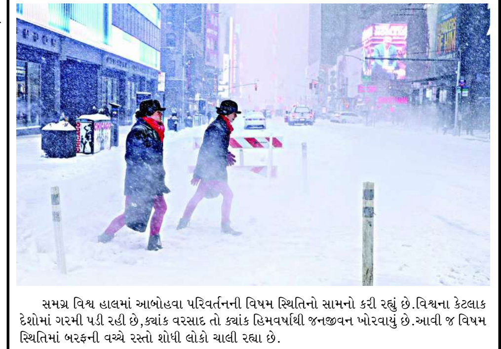
સમગ્ર વિશ્વ હાલમાં આબોહવા પરિવર્તનની વિષમ સ્થિતિનો સામનો કરી રહ્યું છે. વિશ્વના કેટલાક દેશોમાં ગરમી પડી રહી છે, ક્યાંક વરસાદ તો ક્યાંક હિમવર્ષાથી જનજીવન ખોરવાયું છે. આવી જ વિષમ સ્થિતિમાં બરફની વચ્ચે રસ્તો શોધી લોકો ચાલી રહ્યા છે.