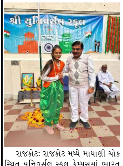
રાજકોટ: રાજકોટ મધ્યે માયાણી ચોક સ્થિત યુનિવર્સલ સ્કૂલ કેમ્પસમાં ભારત

વર્ષના ૭૭મા પ્રજાસત્તાક દિનની ઉજવણી ગૌરવસભર, શિસ્તબદ્ધ અને રાષ્ટ્રીય ભાવનાથી ઓતપ્રોત રીતે કરવામાં આવી. આ અવસરે ભારત સરકારના પૂર્વ મંત્રી તથા પ્રખર રાષ્ટ્રસેવક ડો. વલ્લભભાઈ કથીરિયાના કરકમળે ધ્વજવંદન કરવામાં આવ્યું. સલામી બાદ જન - ગણ - મન રાષ્ટ્રગીતનું ગાન કરવામાં આવ્યું, સમગ્ર રાષ્ટ્રીય ઉત્સવમાં શાળાના વિદ્યાર્થીઓ, શિક્ષકવર્ગ, સંચાલકમંડળ તથા ઉપસ્થિત મહેમાનોએ ઉત્સાહપૂર્વક ભાગ લીધો. સમગ્ર શાળા પરિસર દેશપ્રેમ અને રાષ્ટ્રીય ગૌરવની ભાવનાથી ગુંજી ઉઠ્યો. આ સંગે વિદ્યાર્થીઓ અને ઉપસ્થિતોને સંબોધન કરતાં ડો. વલ્લભભાઈ કથીરિયાએ જણાવ્યું કે પ્રજાસત્તાક દિન