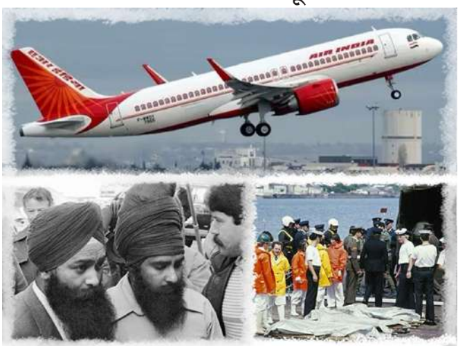
પર, CSIS એર ઈન્ડિયા ફ્લાઈટ ૧૮૨ પરના ૩૨૯ લોકોને યાદ કરે છે જેમણે આતંકવાદના જન્મ કૃત્યને કારણે જીવ ગુમાવ્યા હતા. ૨૩ જૂન, ૧૯૮૮ના રોજ, કેનેડા સ્થિત ખાલિસ્તાની ઉગ્રવાદીઓ દ્વારા મૂકવામાં આવેલા બોમ્બે વિમાનનો નાશ કર્યો હતો, જેમાં સવાર દરેક વ્યક્તિ માર્યા ગયા હતા, જેમાં મોટાભાગના કેનેડિયન હતા. તે કેનેડાના ઈતિહાસનો સૌથી ઘાતક આતંકવાદી હુમલો અને આપણા રાષ્ટ્રીય સુરક્ષા સમુદાય માટે એક નિષ્ણાધિક્ષણ રહ્યો છે, જે અજન્મીએ ફેસબુક પોસ્ટમાં જણાવ્યું હતું. કેનેડાના વડા પ્રધાન માર્ક કાર્નેએ પણ પીટિતોને શ્રદાંજલિ આપી, કનિષ્ક બોમ્બ વિસ્ફોટને "આપણા દેશના ઈતિહાસનો સૌથી ભયંકર આતંકવાદી હુમલો" ગણાવ્યો અને હિંસક ઉગ્રવાદનો સામનો કરવા માટે કેનેડાની પ્રતિબદ્ધતાને ફરીથી વ્યક્ત કરી.

ટોરોન્ટો, કેનેડિયન સિક્યુરિટી ઈન્ટેલિજન્સ સર્વિસ (CSIS) એ ચાર દાયકાથી વધુ સમયમાં પહેલી વાર સત્તાવાર રીતે સ્વીકાર્યું છે કે, ૧૯૮૮માં એર ઈન્ડિયા ફ્લાઈટ ૧૮૨, જે કનિષ્ક તરીકે જાણીતી છે, પર થયેલા બોમ્બ વિસ્ફોટ માટે કેનેડા સ્થિત ખાલિસ્તાની ઉગ્રવાદીઓ જવાબદાર હતા. તેને "આતંકનું જન્મ કૃત્ય" ગણાવતા, કેનેડાની ગુમચર એજન્સીએ કહ્યું કે વિમાન કેનેડાથી કાર્યરત ખાલિસ્તાની આતંકવાદીઓ દ્વારા મૂકવામાં આવેલા બોમ્બ દ્વારા નાશ પામ્યું હતું. "આતંકવાદના ભોગ બનેલા લોકોના સ્મૃતિ દિવસ