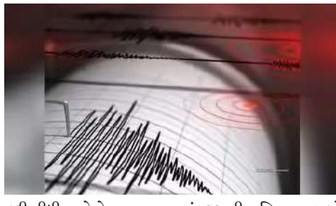
કરી દીધી અને દેશના મુખ્ય આંતરરાષ્ટ્રીય વિમાનમથકને ભારે નુકસાન પહોંચાડ્યું. દેશભરમાં લોકો ગુમ થયેલા સંબંધીઓને શોધી રહ્યા હતા, અને સોશિયલ મીડિયા ફોટોગ્રાફ્સ અને માહિતી માટે અપીલોથી ભરેલું હતું. વેનેઝુએલાના રાજકીય વિપક્ષ સરકારી પ્રયાસોની સાથે સાથે ગુમ થયેલા લોકોને શોધવા માટે એક વેબસાઇટ બનાવી છે, અને તે દર્શાવે છે કે ૪૯,૦૦૦ થી વધુ લોકો ગુમ છે. આ સરકારના સત્તાવાર આંકડા કરતાં ઘણું વધારે છે. "અમે દેશભરમાં એક અસાધારણ પ્રયાસ કરી રહ્યા છીએ," આરોગ્ય પ્રધાન કાર્લોસ અલ્વારાડોએ રાજ્ય ટેલિવિઝનને જણાવ્યું. "સૌથી વધુ અસરગ્રસ્ત પ્રદેશ, લા ગુએરા પ્રદેશમાં હોસ્પિટલો મહત્તમ ક્ષમતા પર છે, અને અમે ફિલ્ડ હોસ્પિટલો સ્થાપવાનું શરૂ કર્યું છે.

ફિલિપાઈન્સ, વેનેઝુએલામાં આવેલા ભયંકર ભૂકંપમાં સંકેતો લોકોના મોત થયાના એક દિવસ પછી, શુક્રવારે દક્ષિણ ફિલિપાઈન્સમાં ૬.૭ ની તીવ્રતાનો ભૂકંપ આવ્યો, યુનાઈટેડ સ્ટેટ્સ જીઓલોજિકલ સર્વે અનુસાર. યુએસજીએસ અનુસાર, મિડાનાઓ ટાપુના સારંગાની શહેરથી લગભગ ૨૧ કિલોમીટર દક્ષિણપશ્ચિમમાં ૬.૫-૭ કિલોમીટર (૪૧ માઈલ) ની ઊંડાઈએ સંજે ૭:૪૨ વાગ્યે (૧૧:૪૨ સ્) ભૂકંપ આવ્યો. આ જ વિસ્તારમાં આવેલા મોટા ભૂકંપમાં ૮૦ થી વધુ લોકોના મોત થયાના ત્રણ અઠવાડિયા કરતાં પણ ઓછા સમય પછી આ ઘટના બની છે. તાત્કાલિક સુનામીની કોઈ ચેતવણી આપવામાં આવી ન હતી. વેનેઝુએલાની દુર્ઘટના બીજી તરફ, વેનેઝુએલાને હયમથાવી નાખનારા બે ભૂકંપમાં મૃત્યુઆંક ઓછામાં ઓછો ૨૩૫ થયો છે, જ્યારે હજારો લોકો ઘાયલ થયા છે, કારણ કે બચાવ ટીમો ફસાયેલા પીટીનો સુધી પહોંચવા માટે કાટમાળ સાફ કરી રહી છે. ભુધવારે સાંજે ૭.૨ અને ૭.૫ ની તીવ્રતાના શક્તિશાળી ભૂકંપે એક મિનિટના અંતરે ઈમારતો ધરાશયી