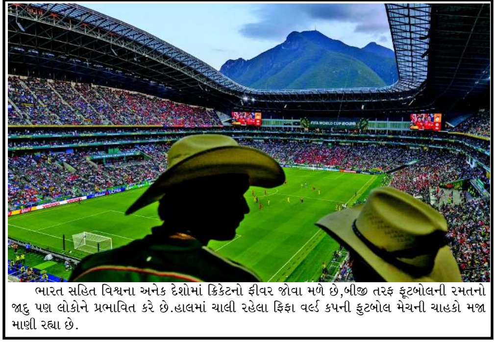
ભારત સહિત વિશ્વના અનેક દેશોમાં ક્રિકેટનો ફીવર જોવા મળે છે, બીજી તરફ ફૂટબોલની રમતનો જાદુ પણ લોકોને પ્રભાવિત કરે છે. હાલમાં ચાલી રહેલા ફિફા વર્લ્ડ કપની ફૂટબોલ મેચની ચાહકી મજા માણી રહ્યા છે.

આ ઘટનામાં કોઈના પણ ઈજાગ્રસ્ત થવાના સમાચાર નથી. ઈન્ટરનેશનલ મેરિટાઈમ ઓર્ગનાઈઝેશનએ પર્શિયન ગલ્ફમાં ફસાયેલા જહાજોને બહાર કાઢવાની પ્રક્રિયા અસ્થાયી ધોરણે રોકી દીધી છે. સંગઠને જણાવ્યું છે કે જ્યાં સુધી અન્ય જહાજોની સુરક્ષાની ખાતરી નહીં મળે, ત્યાં સુધી જહાજોની અવરજવર ફરી શરૂ કરવામાં નહીં આવે. અમેરિકન પ્રમુખ ડોનાલ્ડ ટ્રમ્પે આ પહેલા 'સ્ટ્રેટ ઓફ હોર્મુઝ'માં માલવાહક જહાજ પર થયેલા હુમલાને યુદ્ધવિરામ કરારનું મૂળતાપૂર્ણ ઉલ્લંઘન ગણાવ્યું હતું. ટ્રમ્પે સોશિયલ મીડિયા પર લખ્યું કે જહાજ પર છોડવામાં આવેલા ચાર ડ્રોનમાંથી એક ડ્રોને તેના ઉપરના ભાગને તુકસાન પહોંચાડ્યું હતું.