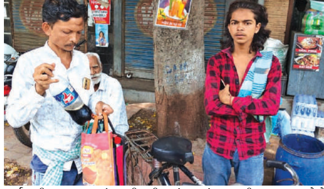
કાર્યવાહી હાથ ધરવામાં આવી રહી છે. પશ્ચિમ બંગાળના નવ જેટલા શપ્સો કોઈ પણ રીતે બોક્સમાં

૫,૦૦૦ જેટલા મરઘીના બચ્ચાને રેસ્ક્યુ કરી લીધા છે, અને તેને કમશ કલ્યાણપુર પોલીસ ફાર્મમાં મોકલવાની કાર્યવાહી હાથ ધરવામાં આવી રહી છે, જ્યારે ગેરકાયદે મરઘીના બચ્ચાનું જાહેરમાં વેચાણ કરનાર બે શપ્સોને સીટી બી. ડિવિઝન પોલીસ મથકે પહોંચાડી દીધા છે, અને તેઓ સામે ફરિયાદ નોંધવા