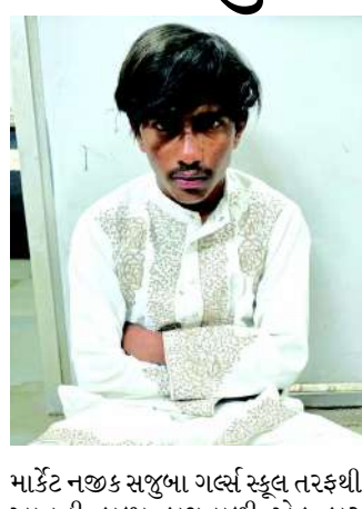
મોહરમના સુભાષ શાક સ્કૂલ તરફથી આવતી કાળા કાચવાળી એક કાર