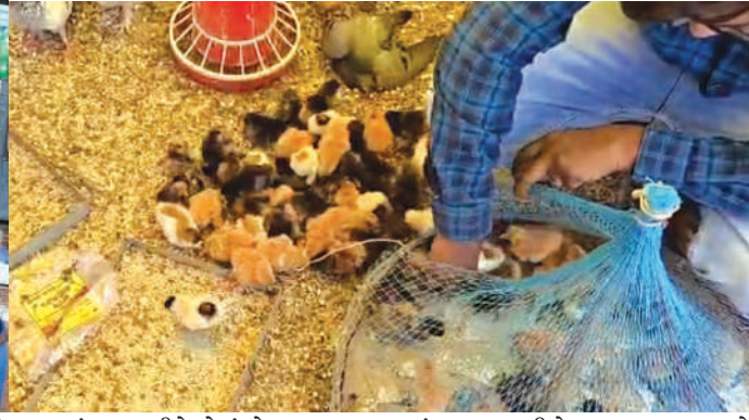
બચ્ચું, આ રીતે તેનું વેચાણ કરતા હોવાનું એનિમલ વેલ્ફેરની સંસ્થા જીવા ફાઉન્ડેશન ને જાણવા મળ્યું હતું. જામનગરની એનિમલ વેલ્ફેર

વિસ્તારમાં પહોંચ્યા હતા. જ્યાં હાજર રહેલા બે વ્યક્તિઓ પાસે જઈ પૂછપરછ કરતાં તેઓએ એક બોક્સમાં માત્ર પાંચ બચ્ચાને રાખી શકાય તેને બદલે ૫૦ થી વધુ મરઘીના બચ્ચાઓને રાખ્યા હતા, અને ગુંગળાઈ જાય તે રીતે તેમજ તેઓને ખોરાક પાણી પણ અપાતો ન હોવાનું ધ્યાનમાં આવ્યું હતું. સૌપ્રથમ તેઓને વાતોમાં કેળવી, તેવો પાસેથી ૧૬૦ જેટલા મરઘીના બચ્ચા વેચાતા લઈ લીધા હતા. ત્યારબાદ આખરે પોતાની ઓળખ આપીને સમગ્ર નવ જેટલા શપ્સો દ્વારા પશ્ચિમ બંગાળ અને ત્યારબાદ આણંદ થી જામનગર લાવવામાં આવેલા આશરે ૫,૦૦ જેટલા નાના બચ્ચાને રેસ્ક્યુ કરી લીધા હતા, અને તે તમામને અન્ય બોક્સ- પિજરા વગેરેમાં સલામત રીતે રેસ્ક્યુ કરી દીધા હતા. ત્યારબાદ હાલ નવાગામ ઘેડ વિસ્તારમાં આવેલી પક્ષીઓ માટેની વ્યવસ્થા ના સ્થળે રાખવામાં આવ્યા હતા. જે પૈકી સૌપ્રથમ ૨,૦૦૦ મરઘીના બચ્ચાને કલ્યાણપુર નજીક