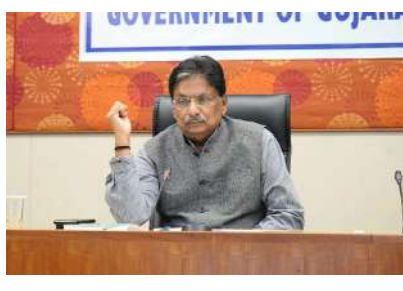
શ્રી ઋષિકેશ પટેલના નેતૃત્વમાં રાજ્ય સરકાર તમામ જાહેર ક્ષેત્રોમાં ઊર્જા કાર્યક્ષમતા, ઊર્જા ઉત્પાદન, ટકાઉ વિકાસ અને ખર્ચ-અસરકારકતાને પ્રોત્સાહન આપવા માટે પ્રતિબદ્ધ છે. રાજ્યની સરકારી કચેરીઓ અને વહીવટી ઈમારતો એ સંસ્થાકીય વીજળી વપરાશનો એક મહત્વપૂર્ણ ભાગ છે. જ્યાં કામકાજની ક્ષમતાને અસર કર્યા વિના મોટા પ્રમાણમાં ઊર્જા બચાવી શકાય છે, જેને

સૂર્યપ્રકાશથી સોલર સુધી, ગુજરાત સરકારનો ગ્રીન એનર્જી રોડમેપ: સરકારી કચેરીઓમાં ઊર્જા બચત અંગે માર્ગદર્શિકા જાહેર ગ્લોબલ વોર્મિંગ અને ક્લિમાટિન વધતા જતા તાપમાનને કારણે વીજળીની માંગમાં સતત વધારો થઈ રહ્યો છે. આ સ્થિતિને પહોંચી વળવા માટે રાજ્યની તમામ સરકારી-અર્ધસરકારી કચેરીઓ, બોર્ડ-કોર્પોરેશનો અને જાહેર ઈમારતોમાં ઊર્જા કાર્યક્ષમતા તેમજ બચત માટે એક વ્યાપક ઝુંબેશ શરૂ કરવામાં આવી છે. ગુજરાત સરકારના ઊર્જા બચાવો અભિયાન અંતર્ગત ઊર્જા અને પેટ્રોકેમિકલ તેમજ માર્ગ અને મકાન વિભાગ દ્વારા સંયુક્ત રીતે આયોજિત આ અભિયાનનો મુખ્ય ઉદ્દેશ્ય કામકાજની ક્ષમતાને અસર કર્યા વિના બિનજરૂરી વીજ વપરાશ ઘટાડીને નાણાકીય શિસ્ત અને પર્યાવરણીય લક્ષ્યાંકો પ્રાપ્ત કરવાનો છે. મુખ્યમંત્રી શ્રી ભૂપેન્દ્ર પટેલના માર્ગદર્શનમાં અને ઊર્જા-પેટ્રોકેમિકલ્સ મંત્રી અનુલક્ષીને રાજ્ય સરકાર દ્વારા માર્ગદર્શિકા જાહેર કરવામાં આવી છે. આ માર્ગદર્શિકા મુજબ વીજ બચતમાં ઉત્કૃષ્ટ પ્રદર્શન કરનાર કચેરીને રાજ્ય સરકાર દ્વારા સન્માનિત પણ કરવામાં આવશે. રાજ્ય સરકાર દ્વારા તમામ અધિકારીઓ અને કર્મચારીઓ માટે જવાબદારીપૂર્વકના ઊર્જા વપરાશની વ્યવસ્થા અમલમાં મૂકવામાં આવી છે. ઓફિસ સમય પૂર્ણ થયા બાદ, સમાહના અંતે અથવા જાહેર રજાઓના દિવસોમાં તમામ લાઈટ, પંખા, એસી અને કમ્પ્યુટર સિસ્ટમ ફરજિયાત બંધ રાખવાની રહેશે. જે અધિકારીઓ રજા પર કે ફિલ્ડ ટ્રુપી પર હોય તેમની પાલી કેબિનના વીજ ઉપકરણો પણ બંધ રાખવા માટે કચેરીના વડાઓએ દૈનિક દેખરેખ રાખવાની રહેશે તેમજ દરેક મોટા વિભાગમાં 'નોડલ અધિકારી' ની નિમણૂક કરવામાં આવશે.