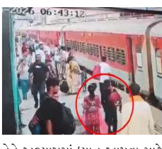
તેને અભ્યાસમાં યાન આપવા માટે ઠપકો આપ્યો હતો. આ વાતનું માર્દુ લાગી આવતા બાળકે ઘર છોડીને ભાગી જવાનો નિર્ણય કર્યો હતો. બાળકના પરિવારજનોએ કામરેજ પોલીસ સ્ટેશનમાં અપહરણની ફરિયાદ નોંધાવતા પોલીસે તાત્કાલિક તપાસના ચક્રો ગતિમાન કર્યા હતા. પીઆઈ આર.બી. ગોજાવાના માર્ગદર્શન હેઠળ પોલીસની ટીમે વિસ્તારના ૭૦થી વધુ સીસીટીવી કેમેરાના ફૂટેજ તપાસ્યા હતા. ફૂટેજમાં બાળક કામરેજ ચોકડીથી રેલવે સ્ટેશન તરફ જતો સુરત જણાઈ આવ્યું હતું. ત્યારબાદ, સુરત રેલવે આરપીએફ (RPF) સાથે સંકલન સાધી પોલીસે બાળકની શોધખોળ શરૂ કરી હતી. તપાસ દરમિયાન જાણવા મળ્યું કે બાળક બિહાર જતી ટ્રેનમાં સવાર થયું હતું. આખરે, વારાણસી રેલવે સ્ટેશન પર બાળકને ટ્રેસ કરી લેવામાં આવ્યું હતું અને કામરેજ પોલીસે તેને સુરક્ષિત રીતે સુરત લાવી પરિવારને સોંપ્યું હતું.

મોબાઈલ ગેમના શોષીન સગીરને માતા-પિતાએ ઠપકો આપતા ભાગી ગયેલ સગીરને પરત શોધી કાઢતી સુરત પોલીસ જીલ્લાના કામરેજ તાલુકામાં આવેલ ખોલવડ વિસ્તારમાં લગભગ પાંચ દિવસ અગાઉ ગુમ થયેલ ૧૧ વર્ષીય બાળક સુરક્ષિત મળી આવતા પરિવારમાં ખુશીનો માહોલ છવાઈ ગયો છે. આ બાળક સુરતથી આશરે ૧૪૦૦ કિમી દૂર વારાણસી રેલવે સ્ટેશનથી મળી આવ્યો હતો. આ મામલે મીડિયા સુત્રો પાસેથી મળતી માહિતી મુજબ, ખોલવડમાં રહેતો ૧૧ વર્ષીય બાળક મોબાઈલ ગેમનો ભારે શોષીન હતો. મોબાઈલના વધુ પડતા ઉપયોગને કારણે વાલીઓએ તેને અભ્યાસમાં યાન આપવા માટે ઠપકો આપ્યો હતો. આ વાતનું માર્દુ લાગી આવતા બાળકે ઘર છોડીને ભાગી જવાનો નિર્ણય કર્યો હતો. બાળકના પરિવારજનોએ કામરેજ પોલીસ સ્ટેશનમાં અપહરણની ફરિયાદ નોંધાવતા પોલીસે તાત્કાલિક તપાસના ચક્રો ગતિમાન કર્યા હતા. પીઆઈ આર.બી. ગોજાવાના માર્ગદર્શન હેઠળ પોલીસની ટીમે વિસ્તારના ૭૦થી વધુ સીસીટીવી કેમેરાના ફૂટેજ તપાસ્યા હતા. ફૂટેજમાં બાળક કામરેજ ચોકડીથી રેલવે સ્ટેશન તરફ જતો સુરત જણાઈ આવ્યું હતું. ત્યારબાદ, સુરત રેલવે આરપીએફ (RPF) સાથે સંકલન સાધી પોલીસે બાળકની શોધખોળ શરૂ કરી હતી. તપાસ દરમિયાન જાણવા મળ્યું કે બાળક બિહાર જતી ટ્રેનમાં સવાર થયું હતું. આખરે, વારાણસી રેલવે સ્ટેશન પર બાળકને ટ્રેસ કરી લેવામાં આવ્યું હતું અને કામરેજ પોલીસે તેને સુરક્ષિત રીતે સુરત લાવી પરિવારને સોંપ્યું હતું.