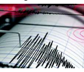
સામે આવ્યા હતા. ત્યારે આજે ફરી એકવાર ૫ જેટલી તીવ્રતાના ભૂકંપથી લોકોમાં દહેશત ફેલાઈ હતી. આ નવો ભૂકંપ ઉત્તર કિનારે ૪.૯ની તીવ્રતાનો નોંધાયો હતો. જેના લીધે રાજધાની કરાક્સ અને મારાકે શહેર હચમચી ગયા હતા. લોકો પોતાનો જીવ બચાવવા માટે આખરે મેદાન તરફ દોડવા લાગ્યા હતા. નવા ભૂકંપને કારણે પહેલાથી ચાલી રહેલા રેસ્ક્યૂ ઓપરેશન પણ અટકાવી દેવાની ફરજ પડી હતી. ઉલ્લેખનીય છે કે જૂના બે ભયાનક ભૂકંપોને કારણે અત્યાર સુધીમાં ૯૨૦થી વધુ લોકો માર્યા ગયા છે અને ૩૩૦૦થી વધુ ઈજાગ્રસ્ત છે. કાટમાળ નીચે હજુ ૧૭૨થી વધુ લોકો દટાયેલા તથા ૫૦૦૦થી વધુ લોકોનો કોઈ અનોપતો જ ન હોવાની માહિતી સામે આવી રહી છે. યુદ્ધના ધોરણે રેસ્ક્યૂ ઓપરેશન ચલાવાઈ રહ્યા છે.

વેનેઝુએલામાં એક પછી એક ૭.૧ અને ૭.૫ની તીવ્રતાના વિનાશકારી ભૂકંપ આવ્યાના અમુક દિવસો બાદ આજે ફરી એકવાર ૪.૯ ની તીવ્રતાને ધરાવતું ધ્રુજતા લોકોમાં ફફડાટ વ્યાપી ગયો છે. નવી દિલ્હી