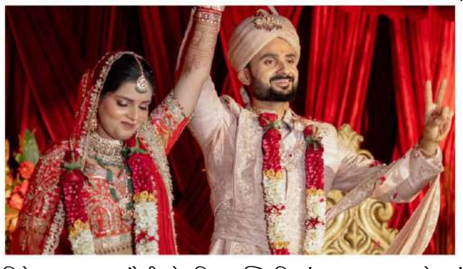
ક્રિકેટના આ ત્રણ સૌથી લોકપ્રિય સ્ટાર્સ લગ્નમાં હાજર રહ્યા હોત, તો તેમને જોવા માટે મોટી સંખ્યામાં લોકો ભેગા થયા હોત. આવી સ્થિતિમાં, લગ્ન સમારોહનું સામાન્ય રીતે આયોજન કરવું મુશ્કેલ બન્યું હોત. આકાશ દીપેનો જવાબ હવે

ભારતીય ક્રિકેટ ટીમના ફાસ્ટ બોલર આકાશ દીપે હાલમાં તેના લગ્નને લઈને સમાચારમાં છે. તાજેતરમાં જ વારાણસીમાં તેમણે અક્ષિતા રાજ સાથે લગ્ન કર્યા હતા. લગ્ન પછી, તેમણે સોશિયલ મીડિયા પર સમારોહના ફોટા અને વીડિયો શેર કર્યા હતા, જેને ચાહકો દ્વારા ખૂબ પસંદ કરવામાં આવ્યા હતા. આ દરમિયાન, લગ્ન સંબંધિત એક વીડિયો ઝડપથી વાયરલ થઈ રહ્યો છે, જેમાં આકાશ દીપેને ભારતીય ક્રિકેટના ત્રણ મોટા નામો - મહેન્દ્ર સિંઘ ધોની, વિરાટ કોહલી અને રોહિત શર્મા વિશે પ્રશ્નો પૂછવામાં આવી રહ્યા છે.