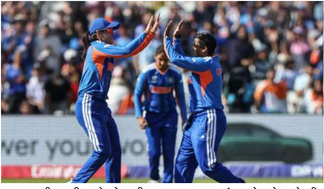
સરળતાથી જીતી શકે છે. બીજી તરફ, ભારતનો અંતિમ મુકાબલો રત જૂને મજબૂત ઓસ્ટ્રેલિયન ટીમ સામે છે. જો તેઓ આ મેચ હારી જાય છે, તો તેઓ વર્લ્ડ કપમાંથી બહાર થઈ શકે છે. તેથી, સેમિફાઇનલમાં સ્થાન મેળવવા માટે ભારતે કોઈપણ કિંમતે ઓસ્ટ્રેલિયાને હરાવવું પડશે. દક્ષિણ આફ્રિકાની

હરમનપ્રીત કોરની આગેવાની હેઠળની ભારતીય મહિલા ટીમે બાંગ્લાદેશને હરાવ્યું. આ ટુર્નામેન્ટમાં ભારતનો આ ત્રીજો વિજય છે, જે તેમને સેમિફાઇનલમાં પહોંચવાની નજીક લાવે છે. દરમિયાન, દક્ષિણ આફ્રિકાએ પણ નેધરલેન્ડ્સને મોટા માર્જિનથી હરાવીને સેમિફાઇનલ રેસમાં પોતાનું સ્થાન મજબૂત બનાવ્યું. ભારત અને દક્ષિણ આફ્રિકા બંને પાસે હવે ટૂંક સમયમાં મેચ રમવાની છે. ભારતીય ક્રિકેટ ટીમના ફાસ્ટ બોલર આકાશ દીપે ધોની, કોહલી અને રોહિતને તેના લગ્નમાં આમંત્રણ ન આપ્યું.