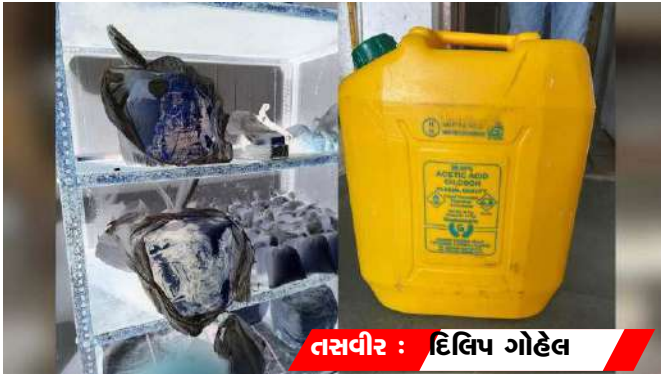
અખાદ મલાઈનો લુજ જથ્થો મહાપાલિકાના જીડસ (સોલિડ મળી આવતા તેને વેસ્ટ મેનેજમેન્ટ) વાહનમાં નાખી

લુજ પનીરનું સેમ્પલ લીધું હતું અને વેપારી પાસેથી ?૫,૦૦૦નો વહીવટી દંડ વસૂલ કરી પ્રીમાયસિસ સીલ કરી દીધી હતી. શ્રીરામ ડેરી (સોમાનાથ-૩, શેરી નંબર ૧, ૧૫૦ ફૂટ રોંગ રોડ, રાજકોટ): અહીં વ્યાપક ગેરરીતિ સામે આવી હતી. ફૂડ વિભાગે મલાઈ અને પનીરના સેમ્પલ લીધા હતા. સ્થળ પરથી અંદાજિત ?૧,૭૫,૦૦૦ની કિંમતનો ૫૦૦ કિલોગ્રામ ફૂગવાળો