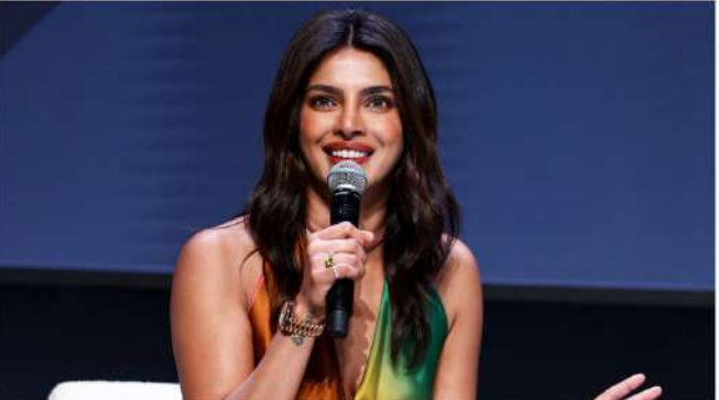
હોલીવુડમાં તેનું શ્રેષ્ઠ કામ હજુ આવવાનું બાકી છે. અભિનેત્રીએ કહ્યું, "મારી હિન્દી ભાષાની કારકિર્દીમાં, મેં કેટલાક શ્રેષ્ઠ ફિલ્મ નિર્માતાઓ અને અભિનેતાઓ સાથે કામ કર્યું છે, અલ્બત્ત વાતચીતો કહી છે અને વિવિધ શૈલીઓનું અભ્યાસ કર્યું છે. જોકે, અમેરિકામાં હોલીવુડમાં મારા અંગ્રેજી ભાષાના કામમાં, મેં એટલું બહુ કર્યું નથી. પ્રિયંકાએ કહ્યું કે તેનો

અભિનેતા પ્રિયંકા ચોપરા એ થોડા ભારતીય કલાકારોમાંની એક છે જેમણે બોલીવુડ અને હોલીવુડ બંનેમાં સફળતા મેળવી છે. તેણીની હિન્દી ફિલ્મ કારકિર્દીની ટોચ પર, તેણી આંતરરાષ્ટ્રીય તકોની શોધમાં યુનાઇટેડ સ્ટેટ્સ ગઈ. જોકે, અનેક વૈશ્વિક પ્રોજેક્ટ્સ પર કામ કરવા છતાં, પ્રિયંકાને લાગે છે કે હોલીવુડમાં તેનું કામ ભારતીય સિનેમામાં તેના કામની તુલનામાં ઓછું છે. કાન્સ લાયન્સ કોન્ફરન્સમાં બોલતા, પ્રિયંકાએ તેના હોલીવુડ કારકિર્દી પર પ્રતિબિંબ પાડ્યો અને વિવિધ પ્રોજેક્ટ્સને આગળ ધપાવવાની ઇચ્છા વ્યક્ત કરી. "બોયો," "દ મ ટ્રિક્સ રિસરેક્શન્સ" અને તાજેતરમાં રિલીઝ થયેલી "દ બ્લક" જેવી હોલીવુડ ફિલ્મોમાં તેના પ્રભાવશાળી અભિનય છતાં, પ્રિયંકાએ કહ્યું કે તેને લાગે છે કે