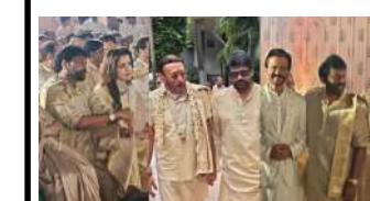
અભિનેત્રી પુશ્પુ સુંદર અને ફિલ્મ નિર્માતા સુંદર સીની મોટી પુત્રી સર્વતિકાના લગ્ન ગોવાના એક રિસોર્ટમાં ખૂબ જ ધામધૂમથી થયા હતા. ચિરંજીવી, નાગાર્જુન અક્કીનેની અને ત્રિશા કૃષ્ણન સહિત ઘણી હસ્તીઓ જીવનમાં હાજર રહી હતી. બધા પરંપરાગત પોશાક પહેરેલા જોવા મળ્યા હતા. અનિલ કપૂર અને જેકી શ્રોફ પણ લગ્નમાં જોવા મળ્યા હતા. બંનેએ પ્રખ્યાત દક્ષિણ ભારતીય સેલિબ્રિટીઝ સાથે ફોટા પડાવ્યા હતા. બંને કલાકારો પરંપરાગત દક્ષિણ ભારતીય પોશાક, વેષ્ટી અને મુંડુ પહેરેલા જોવા મળ્યા હતા, જેને ચાહકો દ્વારા ખૂબ પસંદ કરવામાં આવ્યું હતું.

આપ્યું હતું. વિજય લગ્નમાં હાજર રહ્યો ન હતો, પરંતુ તેની નજીકની મિત્ર ત્રિશાએ હાજરી આપી હતી. એક વાયરલ વીડિયોમાં, ત્રિશા ચિરંજીવી અને તેની પત્ની સાથે વાત કરતી જોવા મળી હતી. ત્રિશાને જોયા પછી ચાહકોએ સોશિયલ મીડિયા પર પ્રતિક્રિયા આપી હતી. કેટલાક ચાહકોએ પ્રશ્ન કર્યો હતો કે ત્રિશાની બાબુની સીટ કેમ ખાલી હતી. આ રીતે, ચાહકો વિજય તરફ ઈશારો કરી રહ્યા હતા. અનિલ કપૂર અને જેકી શ્રોફ પણ લગ્નમાં જોવા મળ્યા હતા. બંનેએ પ્રખ્યાત દક્ષિણ ભારતીય સેલિબ્રિટીઝ સાથે ફોટા પડાવ્યા હતા. બંને કલાકારો પરંપરાગત દક્ષિણ ભારતીય પોશાક, વેષ્ટી અને મુંડુ પહેરેલા જોવા મળ્યા હતા, જેને ચાહકો દ્વારા ખૂબ પસંદ કરવામાં આવ્યું હતું.