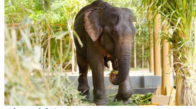
આવે. આ સમિતિ ઉપરાંત આસામ અને ગુજરાત સરકારની જરૂરી મંજૂરીઓ સાથે હવે માણિકીને સુરક્ષિત રીતે વનતારા- જામનગર પહોંચાડી દેવાઈ છે. વનતારામાં માણિકીને અદ્યતન હોસ્પિટલની સંભાળ, સતત સારવાર અને તેના આરામ અને સુવિધા સમાન કાયમી

જામનગર: ૪૮ વર્ષથી ચાલતી માણિકીની ચાલનું દરેક પગલું હવે મુશ્કેલ બન્યું હતું. કારણ, માણિકીના આગળના ડાબા પગમાં લાંબા સમયથી થયેલી ખોડખાપણના લીધે તેના પ્રચલનને અસર થવા લાગી હતી. બીજાતરફ વધતી વયે આરોગ્યની સમસ્યાઓ, ધામાં લાગેલો ચેપ, એક આંખમાં નબળી દ્રષ્ટિ, ડિહાઈડ્રેશન અને શરીરની નબળાઈની સ્થિતિએ તેની પીડા અસહ્ય કરી દીધી છે. પરંતુ હવે એ જ માણિકી સારવાર માટે વનતારા આવી છે. માણિકીને સારવાર માટે લઈ જવાતી હતી ત્યારે આસામના હાઈવે ઉપર પીડાદાયક રીતે લંગડાની સ્થિતિમાં તેનો એક વીરિયો વાઈરલ થયો. આ પછી તેની સ્થિતિ લોકોના