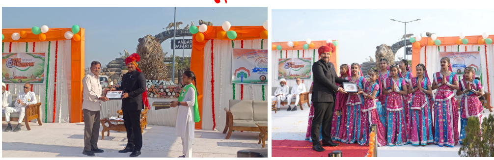
ધારી ગીર (પૂર્વ) વન વિભાગ દ્વારા રાષ્ટ્રધ્વજને સલામી અપાઈ

અમરેલી સમગ્ર દેશ જ્યારે ૭૭મા પ્રજાસત્તાક પર્વના રંગે રંગાયેલો છે, ત્યારે ગીર (પૂર્વ) વન વિભાગ-ધારી દ્વારા રાષ્ટ્રપ્રેમ અને પર્યાવરણ જતનના ઉમદા ઉદ્દેશ્ય સાથે આ પર્વની ભવ્ય ઉજવણી કરવામાં આવી હતી. ધારીના પ્રખ્યાત આંબરડી સહારી પાર્ક ખાતે આયોજિત આ કાર્યક્રમમાં વન વિભાગના અધિકારીઓ, કર્મચારીઓ અને સ્થાનિક આગેવાનોએ ઉમંગભર ભાગ લીધો હતો.