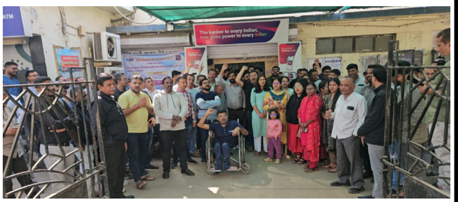
પાડવામાં આવી નથી.

રાષ્ટ્રીયકૃત બેંકોના કર્મચારીઓ પાંચ દિવસ બેંકિંગની માંગણી માટે ગઈકાલે હડતાળ પર રહ્યા હતા. જેનાં અનુસંધાને અમરેલી જિલ્લામાં પણ તમામ રાષ્ટ્રીયકૃત બેંકોના ૬૦૦ થી પણ વધુ કર્મચારીઓ પાંચ દિવસ બેંકિંગની માંગણીને ટેકો આપવાં માટે હડતાળમાં જોડાયા હતા.